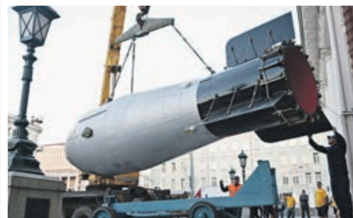
Вчера 06:16 У Манежа идут монтажные работы по установке точной копии самой мощной в мире термоядерной бомбы АН-602 (знаменитая «Царь-бомба»)

Вчера к «Манежу» доставили копию самой мощной ядерной бомбы в мире — АН-602. Так к «Царь-пушке» и «Царь-колоколу» добавилась еще одна величественная персона, ведь одно из названий АН-602 — «Царь-бомба». Но большинству россиян она известна как «Кузькина мать». Именно ее Никита Сергеевич Хрущев в свое время обещал показать американцам, но, к счастью, до этого не дошло. Ведь нашей стране сверхмощное оружие нужно было как гарант безопасности и средство сдерживания.