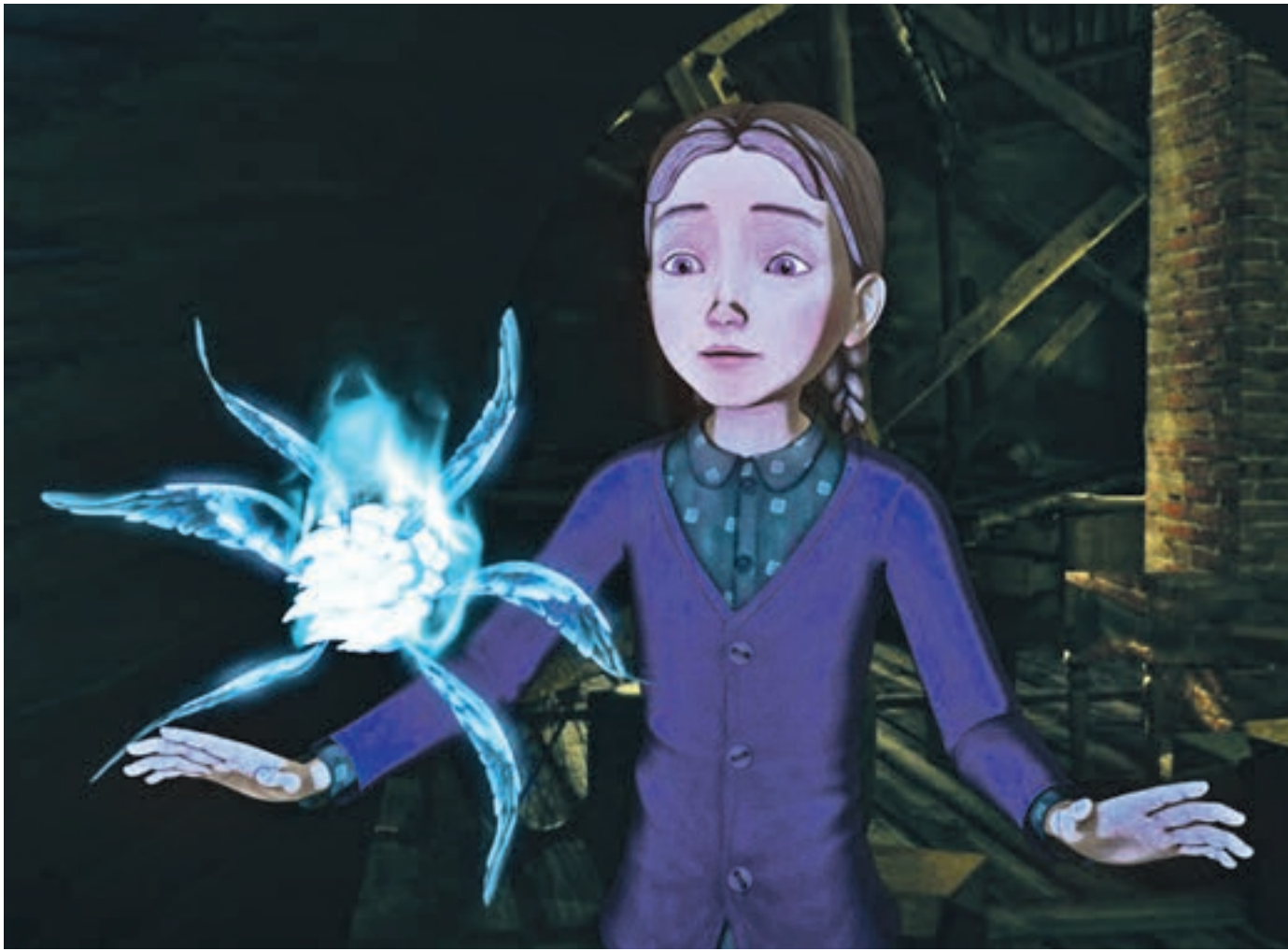
Кадр из мультфильма. Сима является волшебное существо по имени Солнушок — он-то и проводит девочку к старцу Серафиму

Мультфильм обещает стать прорывом для отечественной анимации. Необычен уже сам жанр — православная фантазия. Действие происходит в 1943 году, накануне Пасхи. Десятилетняя Сима Воскресенская, дочь расстрелянного священника, живет в детском доме. Ее хотят заставить отречься от Бога. В страстную неделю Симе придется пройти весь набор христианских испытаний — жесивидельство, предательство, публичный позор. Духовной опорой ей станет ее покровитель, святой Серафим Саровский: он явится девочке в видении и увезет ее в Небесный Иерусалим. Авреальности история разрешится благополучно, как и должно быть на Пасху. — Три года назад к нам обратился Фонд преподобного Серафима Саровского с предложением снять фильм о свя-