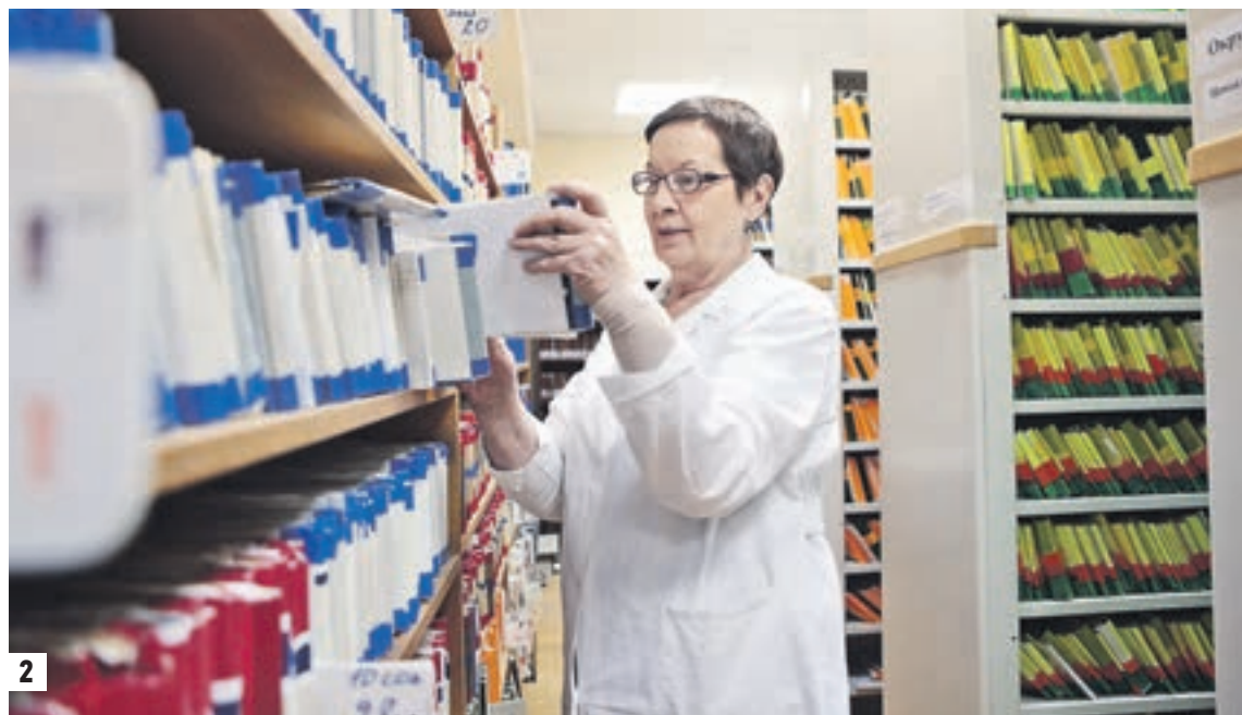
Врач в кабинете

Что еще появилось в поликлиниках нового стандарта? В них создаются специализированные врачебные бригады, которые выезжают к пациенту на дом. Раньше этим занимался участковый терапевт, который добирался до пациента своим ходом. С собой у него был ограниченный набор препаратов и медицинских инструментов. Теперь врач приезжает на вызов на автомобиле поликлиники. Оснащение выездных бригад автотранспортом сокращает длительность обработки одного вызова на дом в среднем с 30 до 17 минут по сравнению с пешим обходом участка. При этом время осмотра пациента не уменьшается и в обоих вариантах составляет в среднем 12 минут. Кроме того, мы расширили набор лекарственных препаратов и инструментов. У врача с собой есть аппарат для измерения электрокардиограммы. Это позволяет нам отслеживать состояние пациентов с заболеваниями сердечно-сосудистой системы и учитывать эти пока-