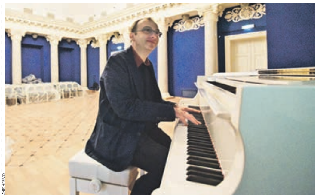
21 августа 2015 года 12:54 Руководитель «Геликон-опера» Дмитрий Бертман играет на белоснежном «Стейнвее». В камерном зале театра, где расположены два рояля, будут проходить небольшие концерты

До конца этого года планируется завершить весь комплекс строительно-монтажных работ еще в одном столичном учреждении культуры — Театре Олега Табакова. Строители приступили к установке систем сценического оборудования, начались отделочные работы в помещениях с первого по четвертый этаж. На объекте задействованы около 100 рабочих. Площадь театра составляет 4,9 тысячи квадратных метров.