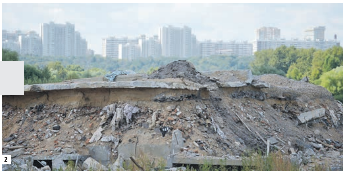
7 августа 12:10 Чудом уцелевший сарай без крыши на окраине поселка Главмосстрой. Внутри только мусор (1) Пустырь на фоне современных многоэтажек смотрится на редкость дико (2) В здании детсада на территории поселка целых окон не осталось, зато полы буквально усыяны бытым стеклом (3) Красивая водонапорная башня из силикатного кирпича — единственная уцелевшая на острове. Всего их было пять (4) Не так давно в этой комнате жил бездомный (5) В помещениях на полу рассыпаны гильзы от автоматных патронов (6)

От себя добавим: даже днем тут жутковато. Исследовать мертвый поселок по записям мертвого краеведа — готовый сюжет для ужасика.