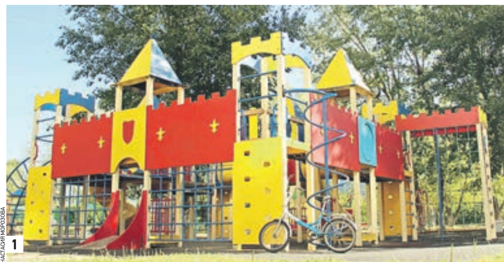
21 августа 11:20 Детский городок во дворе дома № 12 по улице Маршала Голованова. Все конструкции изготовлены из высокотехнологичных и безопасных материалов, сертифицированных Росстандартом (1) Одновременно в городке могут играть до тридцати ребятшек (2)

рожки асфальтом (до этого был гравий, который дети приносили домой в ботинках), установили новые детские городки, сделали на них резиновое покрытие. Лично мне особенно понравились новые фонари. Красивые, под старину, стремя рожками — они стилизованы под газовые. — Качели вот новые поставили, песочницу, скамейки, — рассказывает жительница соседнего дома номер 4 Ирина Кузвлева. — Мы теперь ходим сюда гулять, очень уютно. Но главная фишка благоустройства — декоративные гирлянды на деревьях. Как только темнеет, они зажигаются и возникает ощущение праздника. Просто Новый год какой-то! Лампочки на гирляндах — светодиодные. Они тратят электричества в несколько раз меньше, чем энергосберегающие. И в бытовые раз меньше, чем обычные лампы накаливания! Вот так: нано-