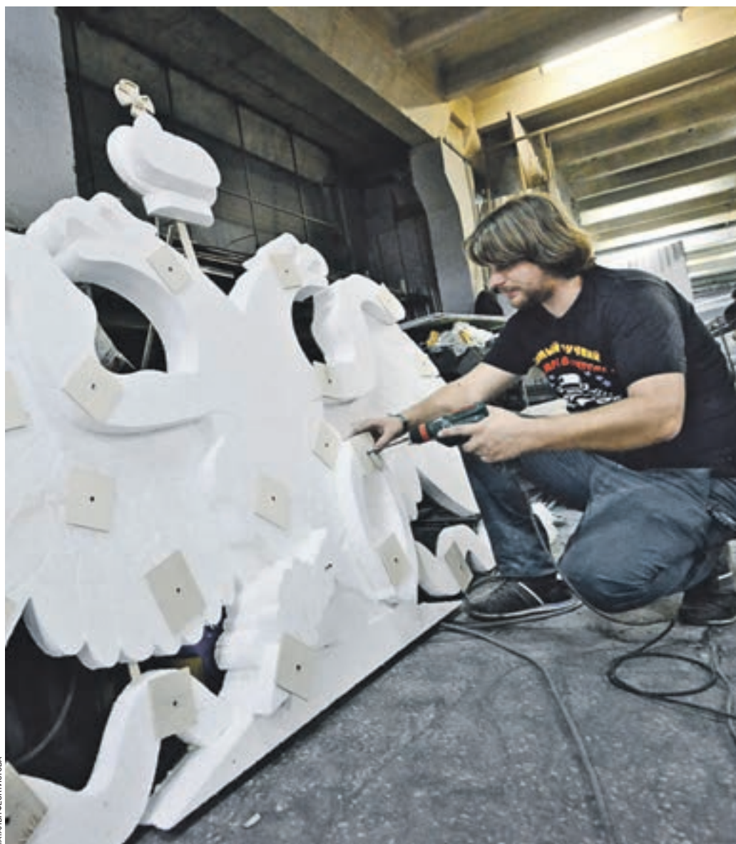
22 августа 14:43 До празднования Дня города остается чуть менее двух недель. Декораторы фабрики имени Первого мая заканчивают работу над триумфальными арками, не отвлекаясь ни на что