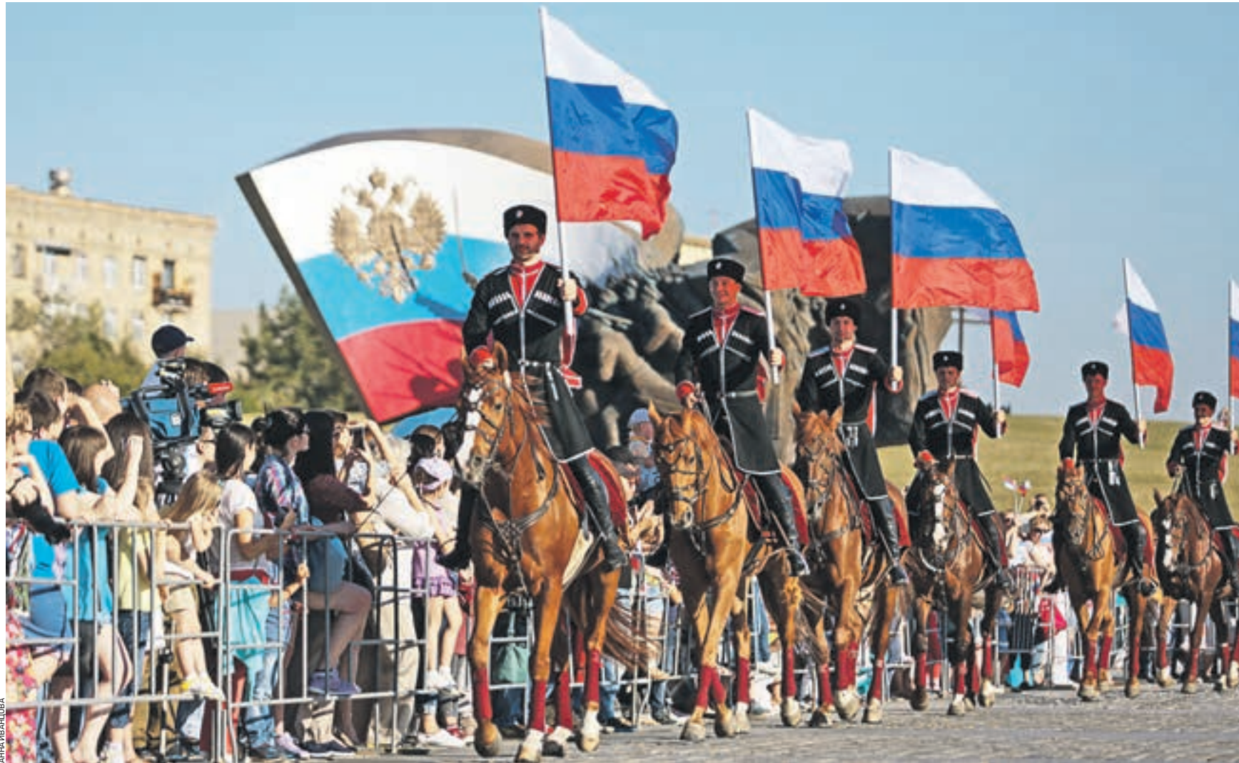
22 августа 18:05 В День флага наездники Кремлевской школы верховой езды и Кавалерийского почетного эскорта Президентского полка выехали на брусчатку с триколором

ПРАЗДНИК В субботу вся страна широко отмечала День российского флага. Корреспондент «ВМ» посетил Поклонную гору, где для горожан выступили всадники Кремлевской школы верховой езды.