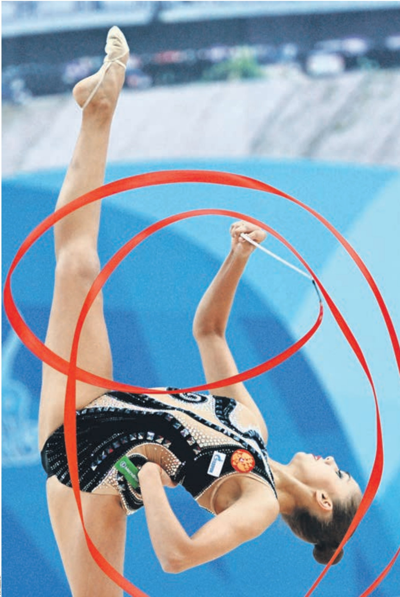
ТОЧКА Сегодня точку в номере ставит спортсменка, чемпионка и просто красавица — Маргарита Мамун, победительница Кубка мира, завершившегося вчера в Казани. Юной россиянке всего 19 лет, но она уже успела завоевать сердца миллионов, став двукратной чемпионкой Европы и мира, а также четырехкратной золотой медалисткой Универсиады-2013. Маргарита Мамун была одной из фавориток прошедших соревнований. Ее победы ждали, и она не разочаровала своих болельщиков. Выступление россиянки с лентой, изящество и грация ее движений покорили строгих судей. По словам самой Маргариты, Кубок мира стал настоящим праздником красоты.