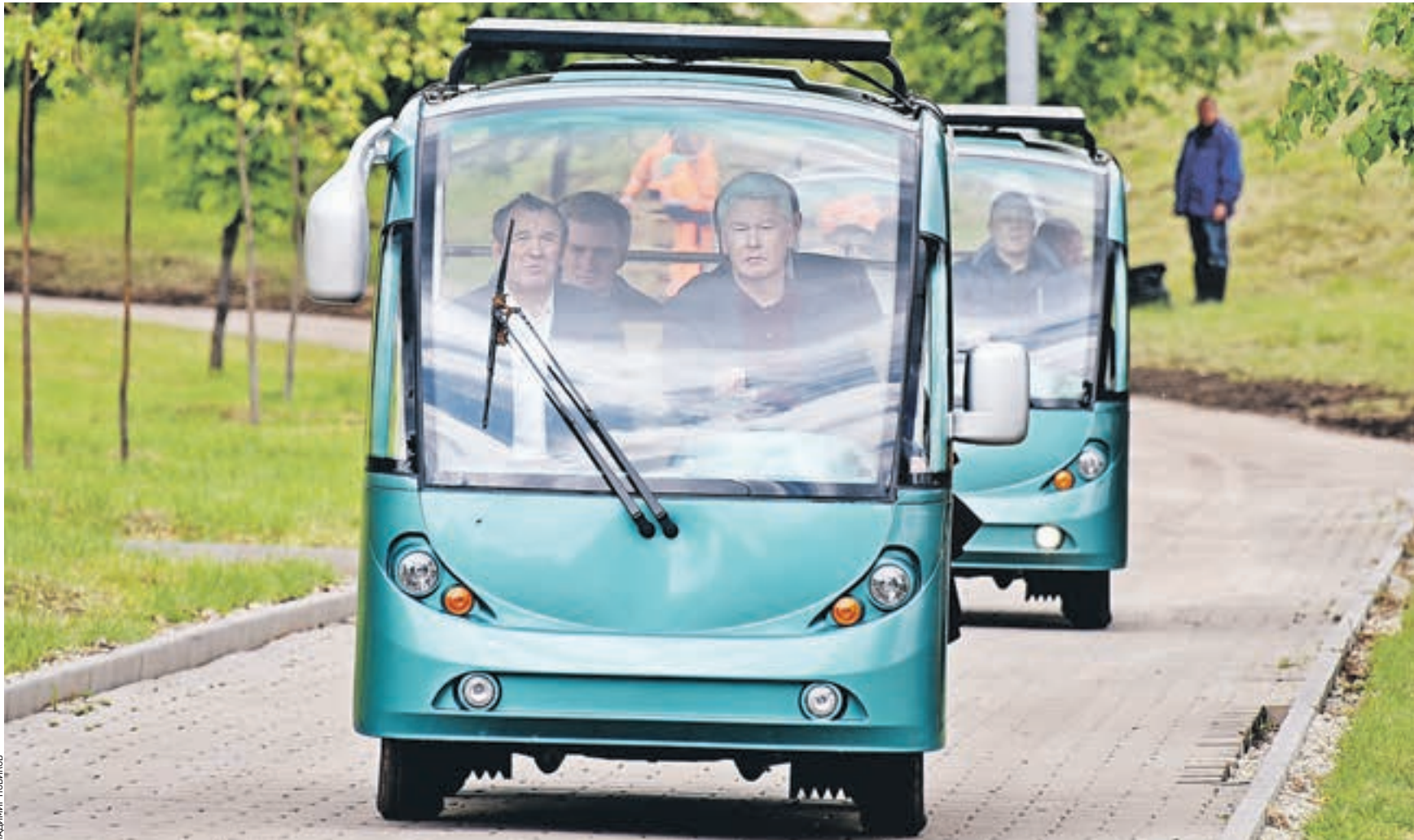
Вчера 11:39 Мэр Москвы Сергей Собянин (за рулем первого электромобиля) и заммэра столицы по вопросам жилищно-коммунального хозяйства и благоустройства Петр Бирюков (на фото слева) едут по территории Братеевского парка. Для передвижения они используют экологичный транспорт, работающий на энергии солнечных батарей

РАЗВИТИЕ Вчера мэр Москвы Сергей Собянин осмотрел ход работ по благоустройству Братеевского каскадного парка. В тот же день он посетил новый административно-офисный комплекс в Лефортове, построенный на месте промзоны завода «Серп и Молот».