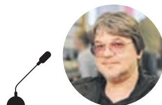
ОЛЕГ РЯСКОВ КИНОРЕЖИССЕР И ПРОДЮСЕР