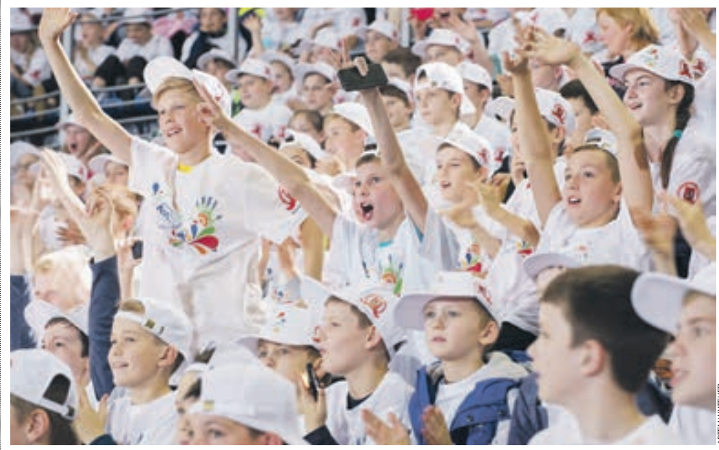
Вчера 15:10 Воспитанники столичных спортивных школ дружно приветствуют знаменитых российских баскетболистов