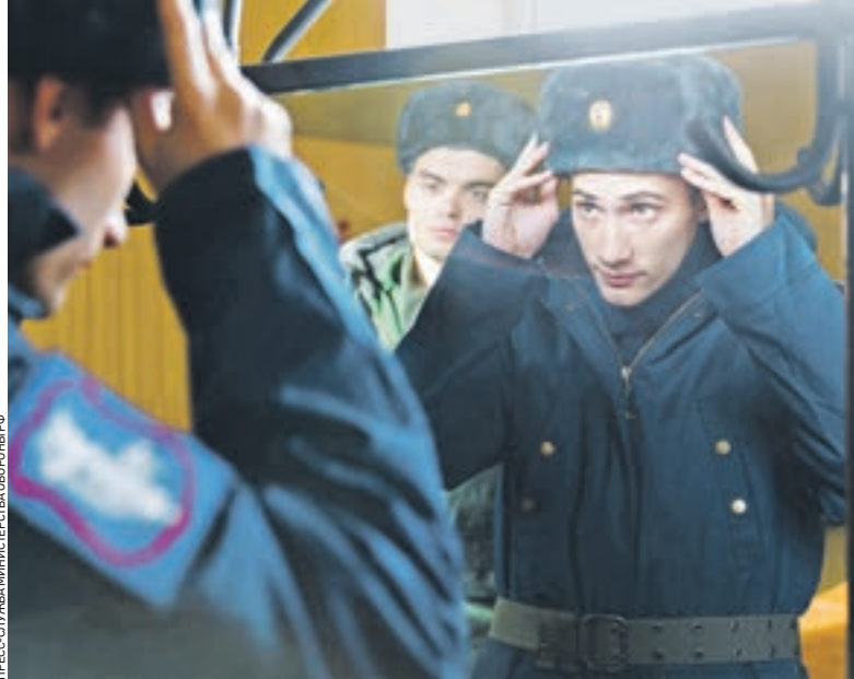
Вчера 10:10 Десантники отправятся к местам прохождения службы в синей форме, моряки — в черной, а бойцы Сухопутных войск — в привычной зеленой

10:05 Завтра начинается осенний призыв в Вооруженные силы. Служить отправятся 152 тысячи молодых россиян, более 6 тысяч из них — москвичи. Призыв не сильно отличается от предыдущего, однако нововведения есть. Так, будущие солдаты поедут служить в форме разного цвета. Корреспондент «ВМ» выяснял почему.