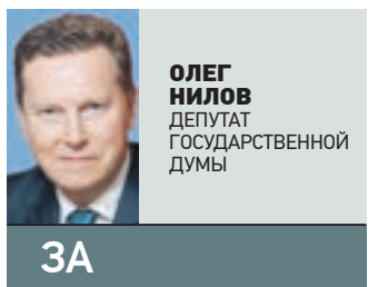
ОЛЕГ НИЛОВ ДЕПУТАТ ГОСУДАРСТВЕННОЙ ДУМЫ