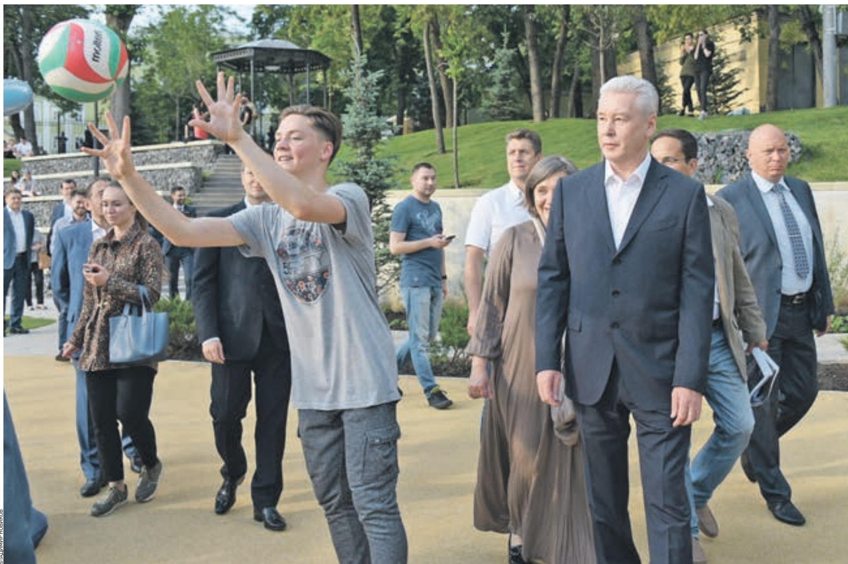
Вчера 17:30 Мэр Москвы Сергей Собянин (справа) на спортплощадке сквера в Большом Спасоглинищевском переулке, где недавно завершили благоустройство

На заседании было принято решение об организации видеонаблюдения на выборах муниципальных депутатов. Они пройдут 10 сентября. — Это важные выборы, поэтому муниципальные депутаты контролируют работу управ, местных поликлиник,