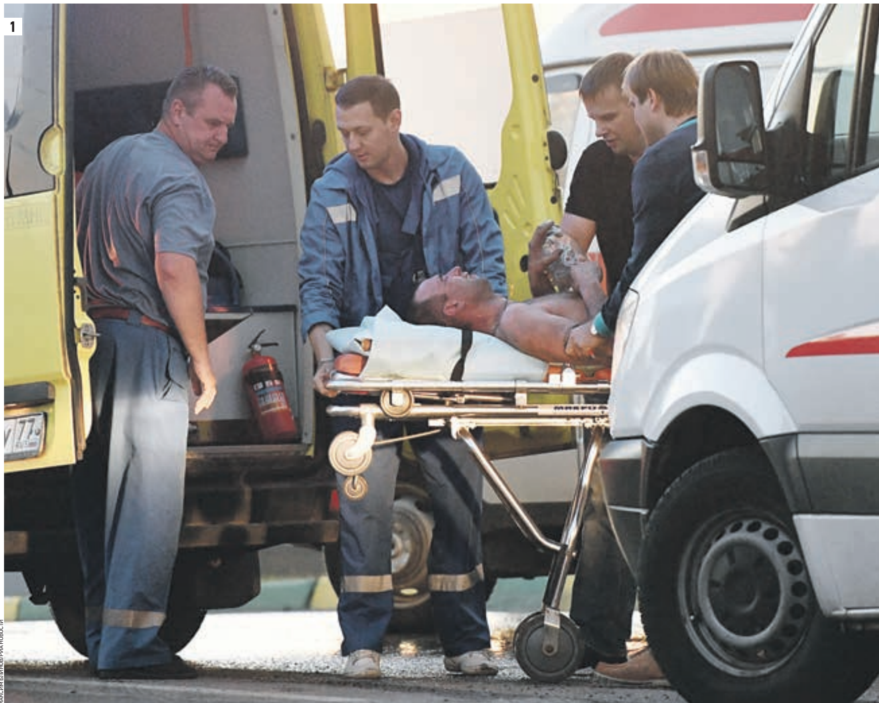
10 июля 2017 года. Сотрудники столичной службы скорой медицинской помощи проводят эвакуацию одного из пострадавших в пожаре в московское лечебное учреждение. Помимо автомобилей, в организованной эвакуации принимали участие и специализированные медицинские вертолеты. Большинство госпитализированных пострадало от задымления и ожогов (1) Торговый центр «Рио», охваченный пожаром (2)