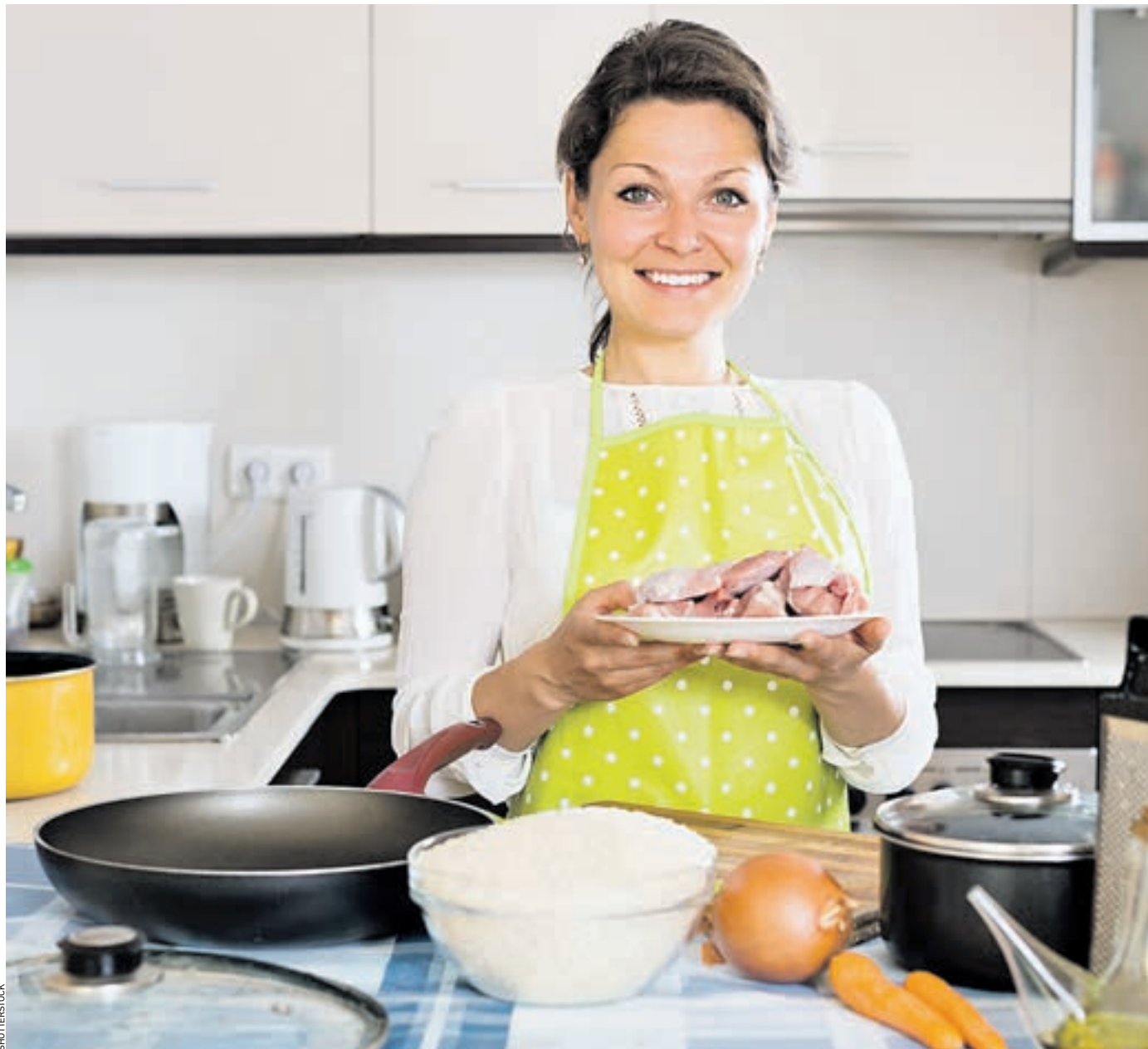
6 июля 2017 года. Москвичка готовит жаркое. Мясо нарезано кусочками, дело за овощами. Опытные повара советуют их сначала немного обжарить и лишь потом положить в горшочек для тушения