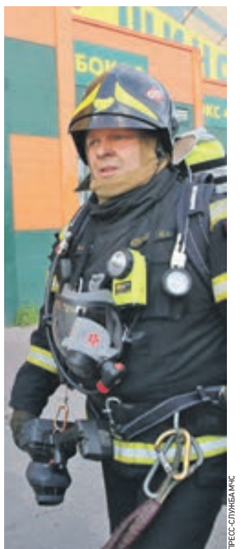
10 июля 19:30 Юрий Жуновский на месте пожара

Начальник службы пожаротушения Главного управления МЧС России по Москве Юрий Жуновский рассказал «ВМ», почему он отдал собственную маску пострадавшему при пожаре в ТЦ «РИО». Он нарушил правила, но спас человеку жизнь.