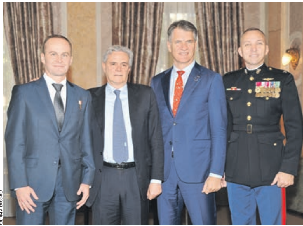
10 июля 19:12 Слева направо: космонавт Сергей Рязанский, посол Италии Чезаре Мария Рагальни, астронавты Паоло Несполо и Рэндольф Брезник на торжественном приеме

В резиденции посла Италии Чезаре Мария Рагальни прошел прием в честь космонавтов, которые в конце июля отправятся на Международную космическую станцию.