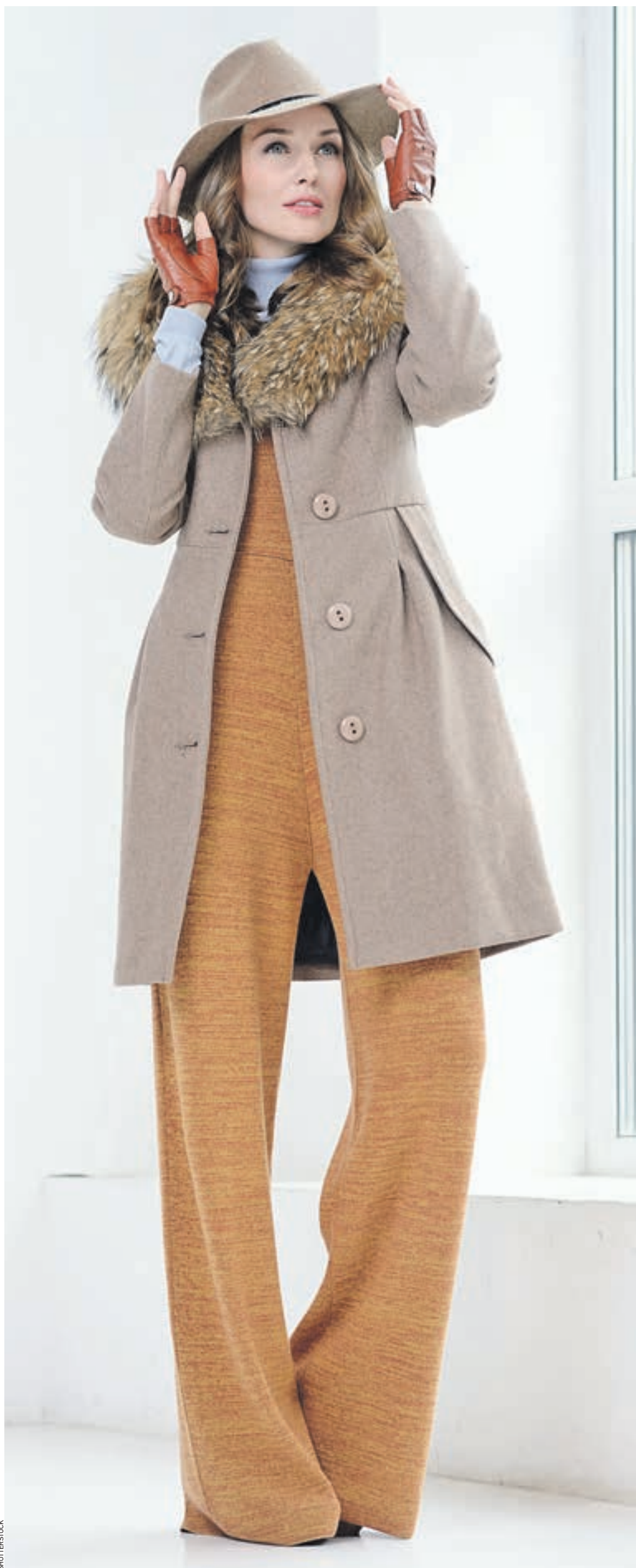
Пример пятничного образа для начала зимы: полупальто теплых оттенков с воротником из натурального меха идеально гармонирует с теплой фетровой шляпкой в тон

— Подобная яркая шапка прекрасно сочетается с короткими шубками из искусственного меха расцветкой в тон, — советует дизайнер.