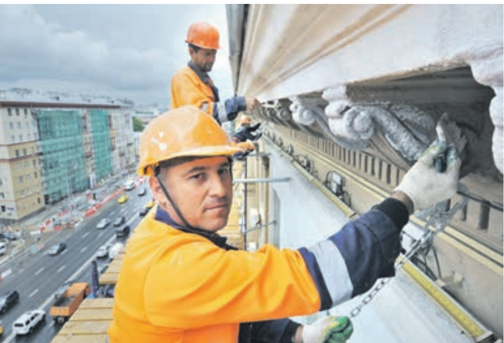
4 июля 2017 года. Ремонт фасада дома № 13/3 по Садовой-Черногрязной улице, Басманный район. Этот кадр, снятый фотокорреспондентом «ВМ» Александром Кожохиним, занял первое место в номинации «Лучшая фотография»