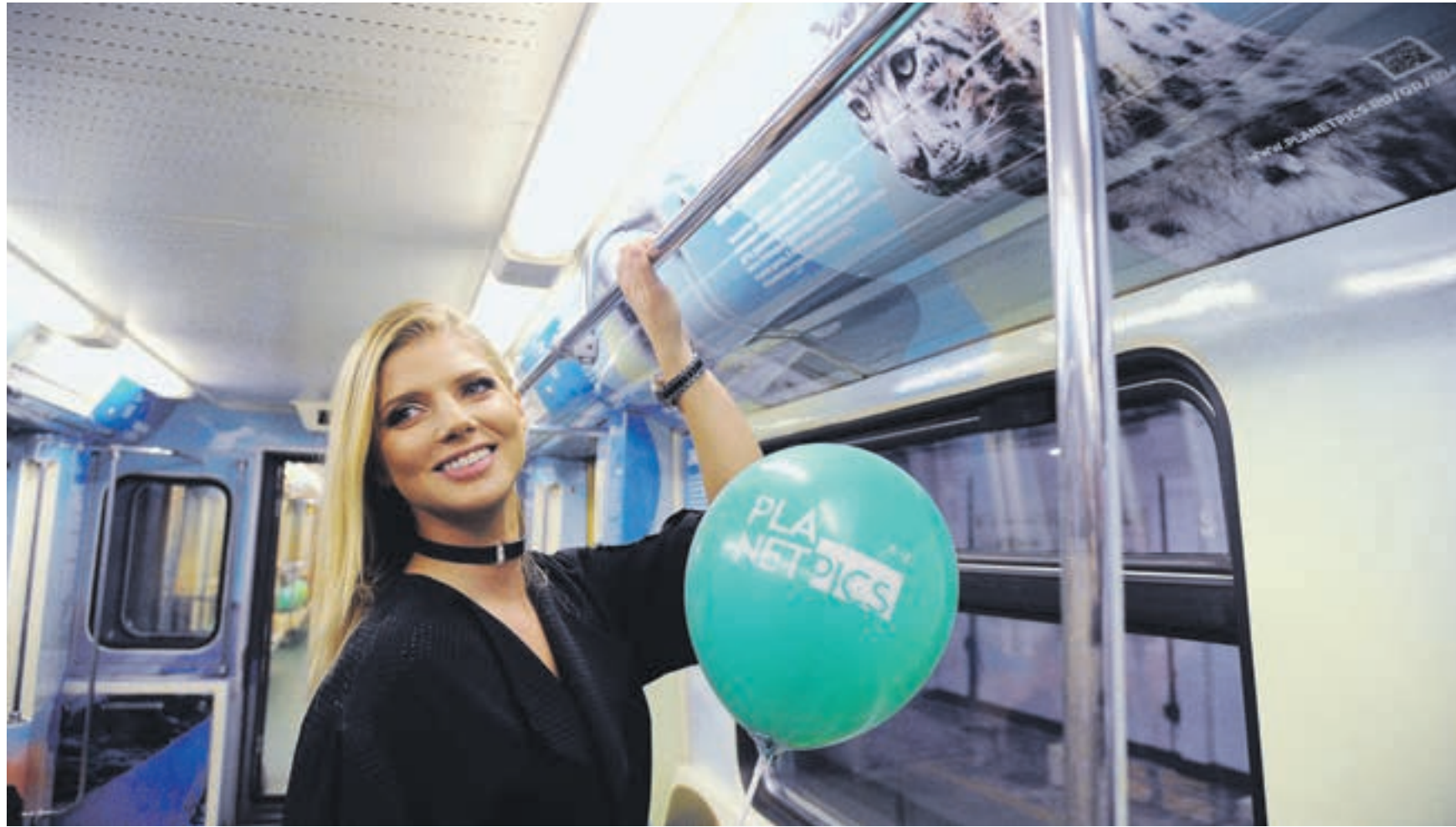
Вчера 12:23 Актриса театра и кино Анастасия Задорная любит оформление тематического поезда столичного метрополитена, посвященного Году экологии в России

Каждый вагон представляет собой отдельную экспозицию. Так, в арктической зоне поезда, выдержанной в белой цветовой гамме, пассажиры смогут узнать, что полярный заяц весьма морозоустойчивый зверь, которому не страшны холода даже в минус