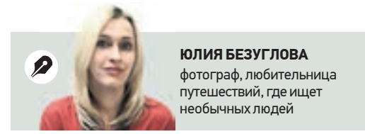
ЮЛИЯ БЕЗУГЛОВА фотограф, любительница путешествий, где ищет необычных людей

В XV веке одними из пионеров этих далеких, неласковых краев стали два инока — Савватий и Зосима, с которых началась история Соловецкого монастыря — одной из самых почитаемых монашеских обителей в России. С XVIII века монастырские несли, заключенные в толстую каменную кладку, стали использоваться как место заключения особо опасных «государевых слушников».