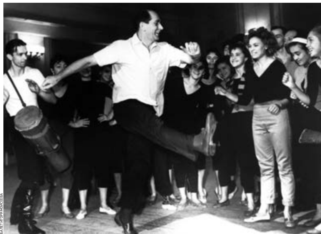
1970 год. Хореограф Игорь Моисеев (в центре) репетирует перед выступлением в Гаване. На остров Свободы он прибыл с постановкой «Вива, Куба!»