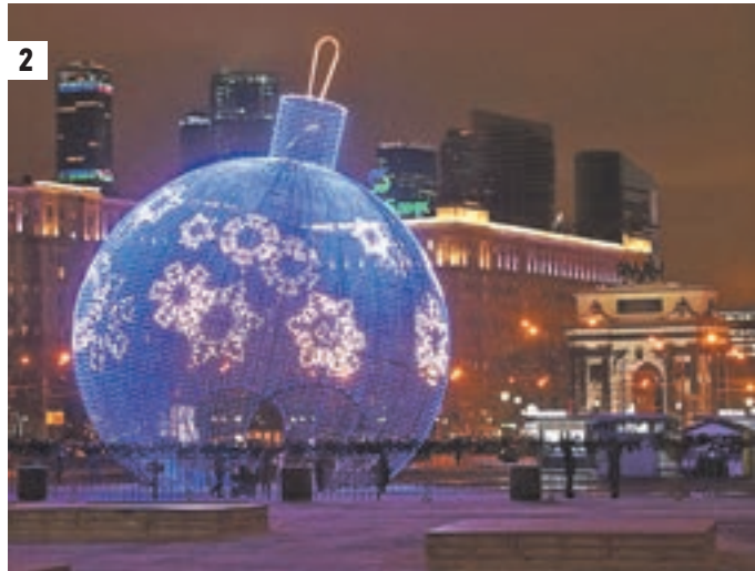
Вчера 11:50 Москвички спешат по делам мимо будущего главного новогоднего украшения Поклонной горы — гигантского светящегося шара. Сейчас вовсю идет его монтаж (1) 18 декабря 2016 года. Год назад этот новогодний шар уже украшал площадку «Путешествия в Рождество» на Поклонке (2)