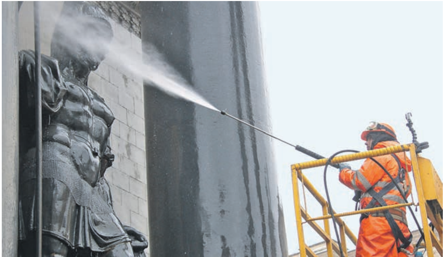
4 марта 2017 года 12:57 Работник Гормоста Антон Краев моет одну из достопримечательностей столицы — Триумфальную арку.