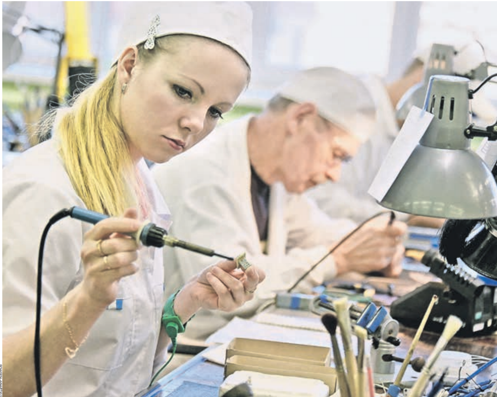
20 января 2017 года. Рабочая смена на Московском машиностроительном заводе «Авангард». Это высокотехнологичное предприятие, имеющее уникальное оборудование и развитые производственные мощности, которые обеспечивают успешное выполнение важных государственных задач по поставкам в Министерство обороны РФ зенитных управляемых ракет для надежной обороны воздушных рубежей

Глава комитета ГД по труду внес законопроект, касающийся ненормированного рабочего дня. Предлагается установить критерии «переработки» и дифференцировать компенсацию за переработку для разных категорий работников.