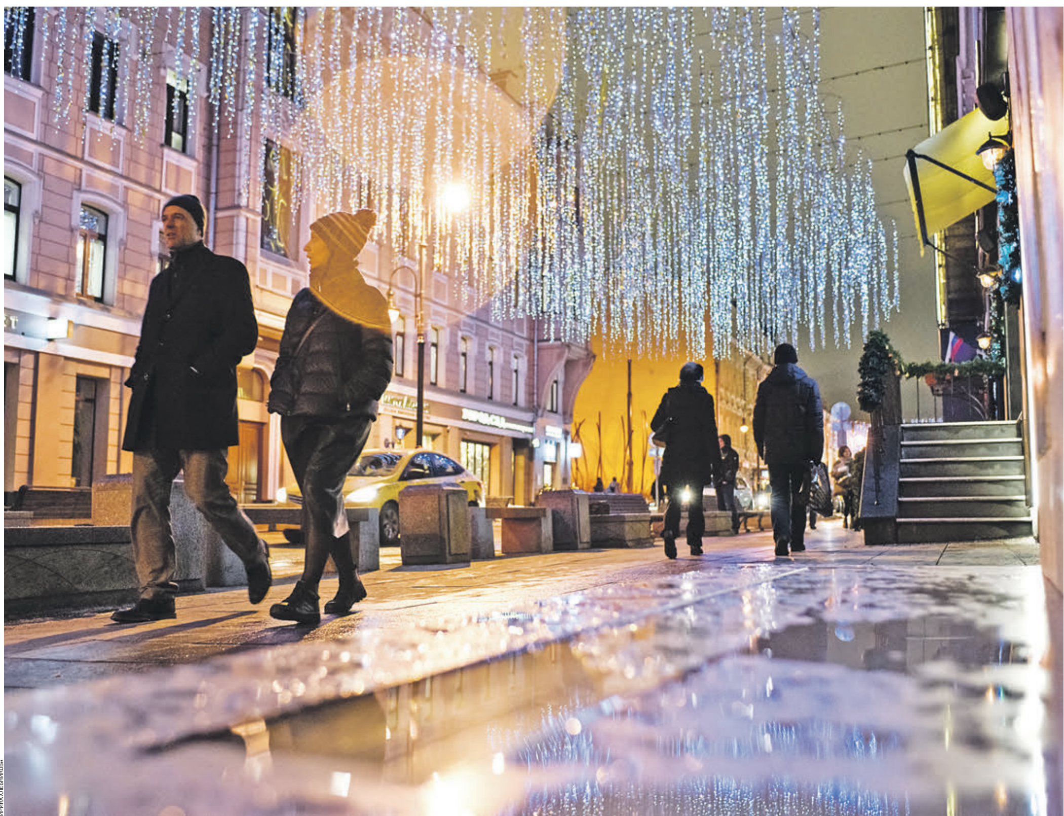
12 декабря 19:31 На Большой Дмитровке — светло, будто звездное небо заплутало в переулках столицы. В подмерзающих лужах отражаются огоньки, и влюбленные наслаждаются прогулкой по вечернему городу. Впереди — самый яркий фестиваль зимы «Путешествие в Рождество»