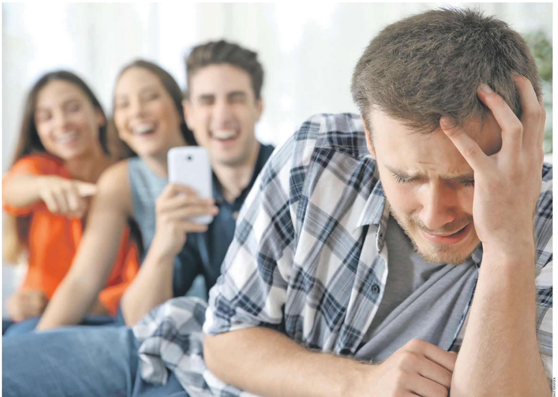
Необходимость выработки этических и моральных норм общения граждан в соцсетях стала не просто требованием, но и велением времени