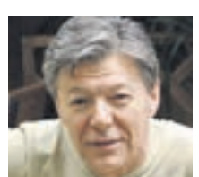
АЛЕКСАНДР ЗБРУЕВ ЗАСЛУЖЕННЫЙ АРТИСТ РФСФР

В театральном искусстве давно применяются новые технологии. Появляется иное видение озвучивания и освещения, используются видеоизображение. Но это лишь одна из опций — такая же, как возможность смотреть спектакль в виртуальной реальности. Зритель, как и тысячи лет назад, идет в театр за живым контактом с актерами. Несмотря на технический прогресс, на сцене главным остается человек. Хороший спектакль не потеряет в качестве, если убрать из него все технические новинки. Так что исчезновения театральных залов ждать не стоит. Возможно, виртуальный театр отпочкуется от традиционного и станет отдельным видом искусства, но не более.