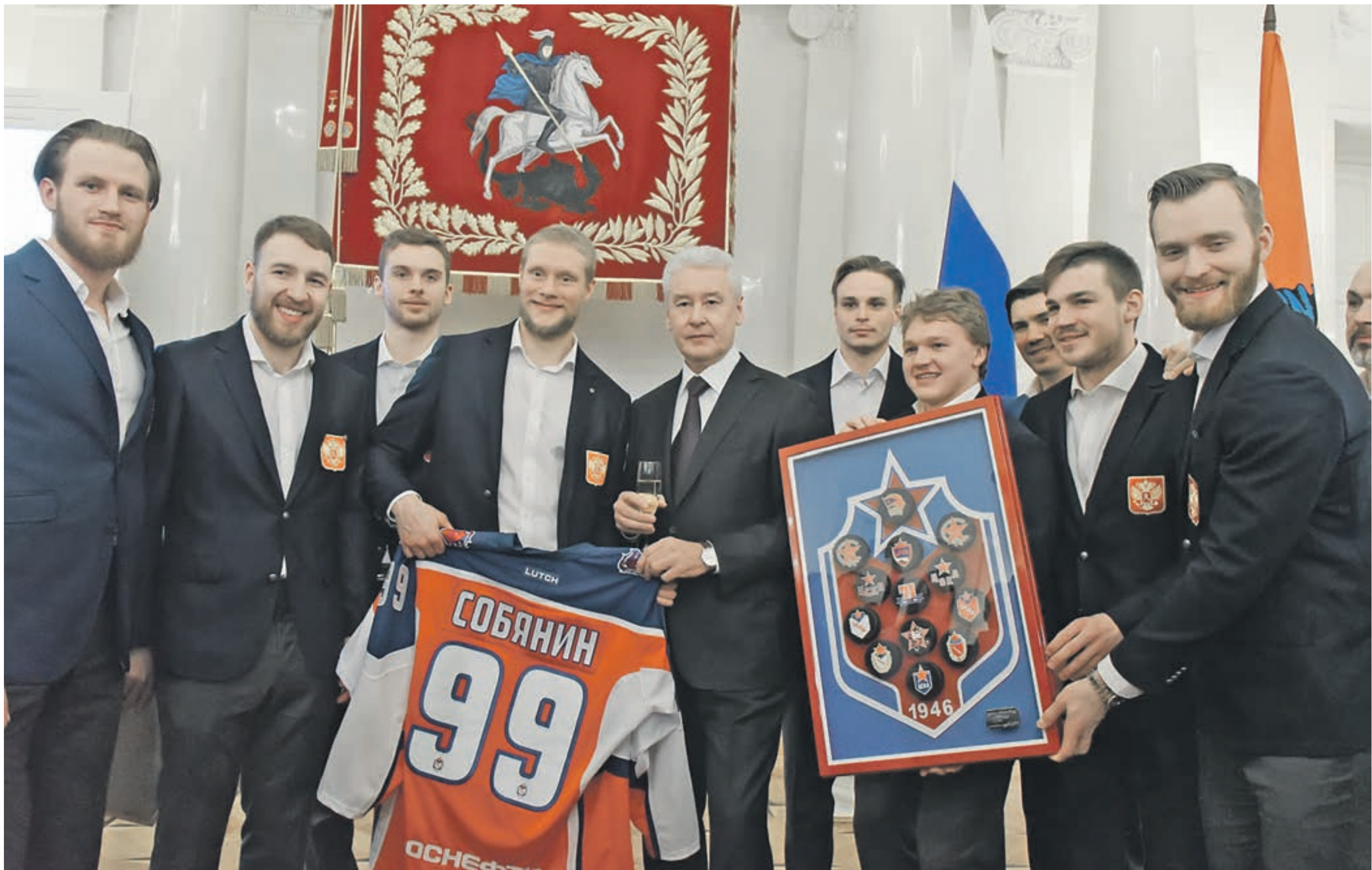
15 марта 2018 года. Мэр Москвы Сергей Собянин (в центре) поздравляет сборную России по хоккею с долгожданной золотой медалью. Слева направо: Иван Телегин, Никита Нестеров, Илья Сорокин, Сергей Андронов, Алексей Марченко, Кирилл Капризов, Игорь Никитин, Богдан Киселевич, Михаил Григоренко