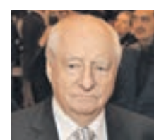
МАРК ЗАХАРОВ НАРОДНЫЙ АРТИСТ СССР

Театр может стать виртуальным. И как вам?