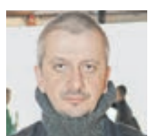
КОНСТАНТИН БОГОМОЛОВ РЕЖИССЕР-ЭКСПЕРИМЕНТАТОР

учреждениях сейчас есть условия даже для маломобильных граждан. Поэтому на спектакли лучше приходить лично. Только так можно полностью проникнуться театральной атмосферой и неповторимыми эмоциями.