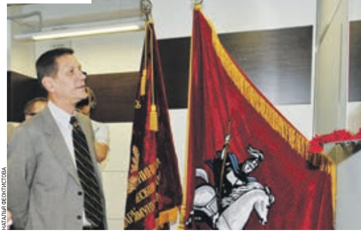
17 февраля 1942 года. Одно из полей сражений Великой Отечественной войны (сверху), где был фотокор «ВМ». 30 мая 2012 года. Первый заместитель председателя Госдумы РФ Александр Жуков в редакции «ВМ» у мемориальной таблички журналистам, погибшим в годы Великой Отечественной войны (снизу)