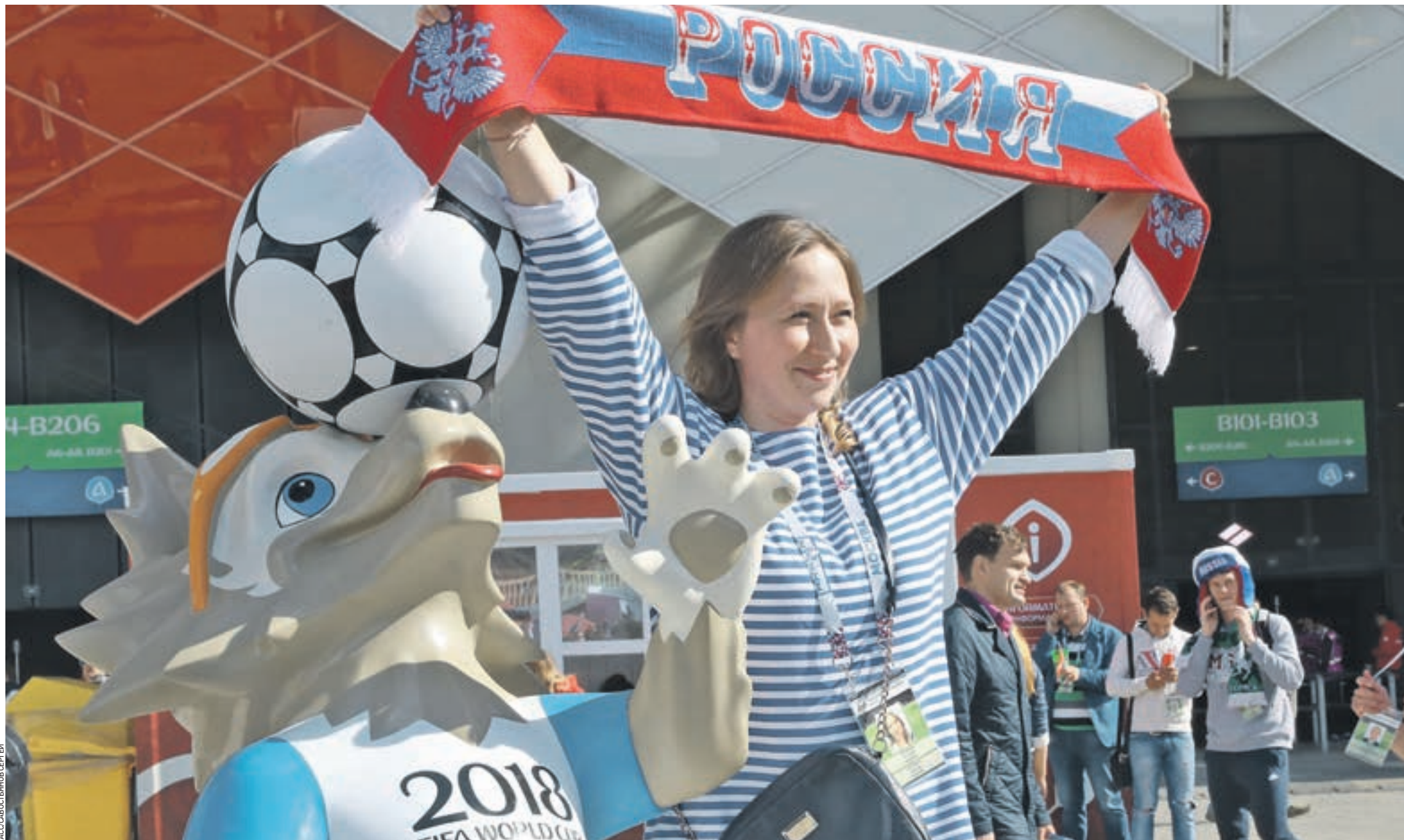
21 июня 2017 года. Российские болельщики у стадиона «Спартак» перед началом матча группового этапа Кубка конфедераций FIFA 2017 между сборными командами России и Португалии

спортсменов примут участие в Кубке мира по самбо. На ковер 23 и 24 марта выйдут неоднократные чемпионы мира и Европы, заслуженные мастера спорта России и мастера спорта международного класса.