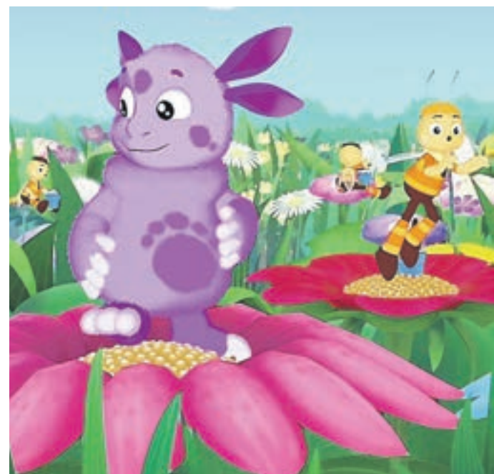
1-я серия мультфильма «Лунтик и его друзья» вышла на ТВ в 2006 году. С тех пор его производство не прекращалось

В категории «6+» будут показаны лучшие серии уже полновосточившихся сериалов «Дракоша Тоша» (серия «Подкованные монстры»), «Лунтик и его друзья» («Кинозвезды»), «Паровозик Тишка» («Подземный город»), «Дракоша Тоша» («Школа забот»), «Барбоскины» («Здравствуй, Дедушка