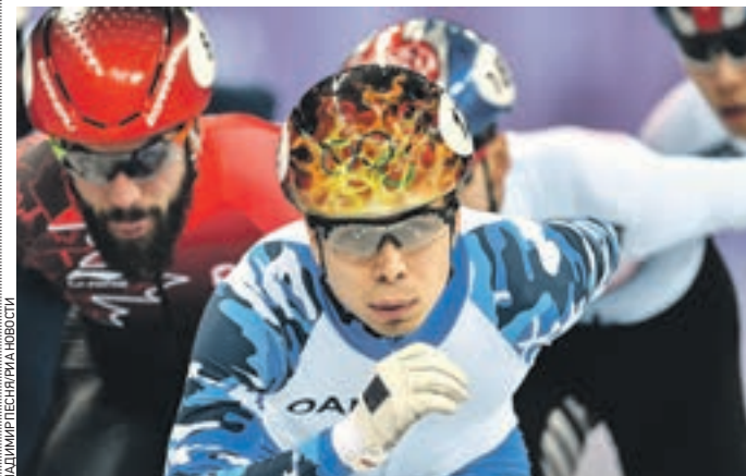
10 февраля 2018 года. Спортсмен Семен Елистратов в финальном забеге на 1500 метров в соревнованиях по шорт-треку среди мужчин на Олимпиаде в Пхенчхане