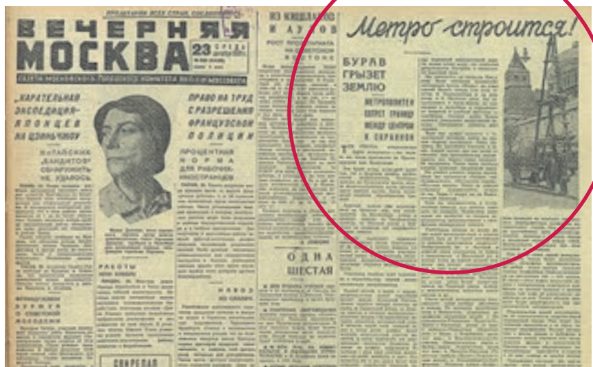
Полоса газеты «Вечерняя Москва» от 23 декабря 1931 года, посвященная строительству Московского метрополитена

Завершение строительства и открытие северного вестибюля «Окружной» планируется совместить с созданием одноименного транспортно-пересадочного узла, обеспечивающего пересадки на Московское центральное кольцо и остановку Савеловского направления Московской железной дороги. В перспективе здесь пройдет один из центральных диаметров: Одинцово — Лобня.