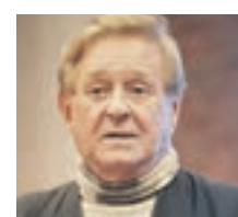
РОМАН ВИКТИУК ТЕАТРАЛЬНЫЙ РЕЖИССЕР

Если так пойдет и дальше, то театральное искусство обречено на гибель. Артистам просто не для кого будет играть. Спектакль — это особая форма взаимодействия актёра и зрителя. Когда энергия, которая идет со сцены, соприкасается с эмоциями зрителя, то возникает неповторимые мгновения. Хороший артист как бы гипнотизирует зрителя, притягивает к себе его взгляд и внимание. Это своеобразная театральная магия, которую не может передать ни одна запись. И неважно, на пленке она будет или в цифровом виде. Поэтому я очень переживаю, когда спектакль снимают на пленку. Есть много талантливых режиссеров, которые могут создать красивый изобразительный ряд. Да, это впечатляет, но от театра на этой записи останется очень мало. У театра своя уникальная атмосфера.