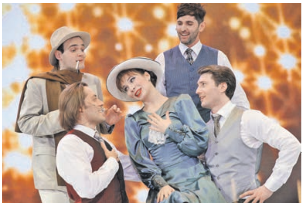
27 марта 2017 года. Центральный выставочный зал «Манеж». Выступление артистов театра «Московская оперетта» в рамках общегородской акции «Ночь театров»