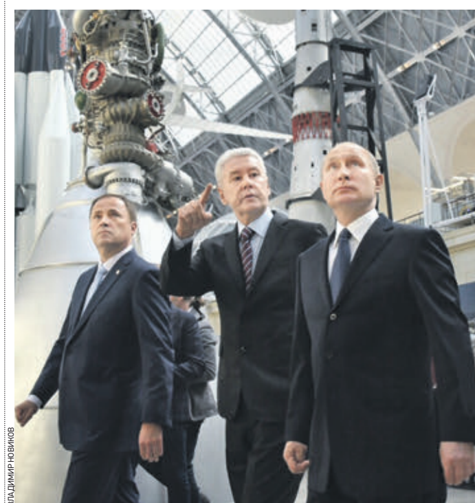
Вчера 13:00 Президент России Владимир Путин (справа), мэр Москвы Сергей Собянин (в центре) и генеральный директор госкорпорации «Роскосмос» Игорь Комаров (слева) осматривают павильон «Космос»

Вчера президент России Владимир Путин и мэр Москвы Сергей Собянин открыли знаменитый павильон «Космос» после реконструкции.