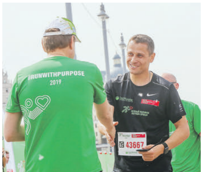
1 июня 17:57 Юрий Борзакоский финиширует на Зеленом марафоне «Бегущие сердца»

Юрий Борзакоский родился 12 апреля 1981 года. Чемпион Олимпийских игр 2004 года в Афинах в беге на 800 метров. Один из шести олимпийских чемпионов от России в мужской легкой атлетике и единственный — в беговых дисциплинах. Заслуженный мастер спорта России. Почетный гражданин города Жуковский Московской области.