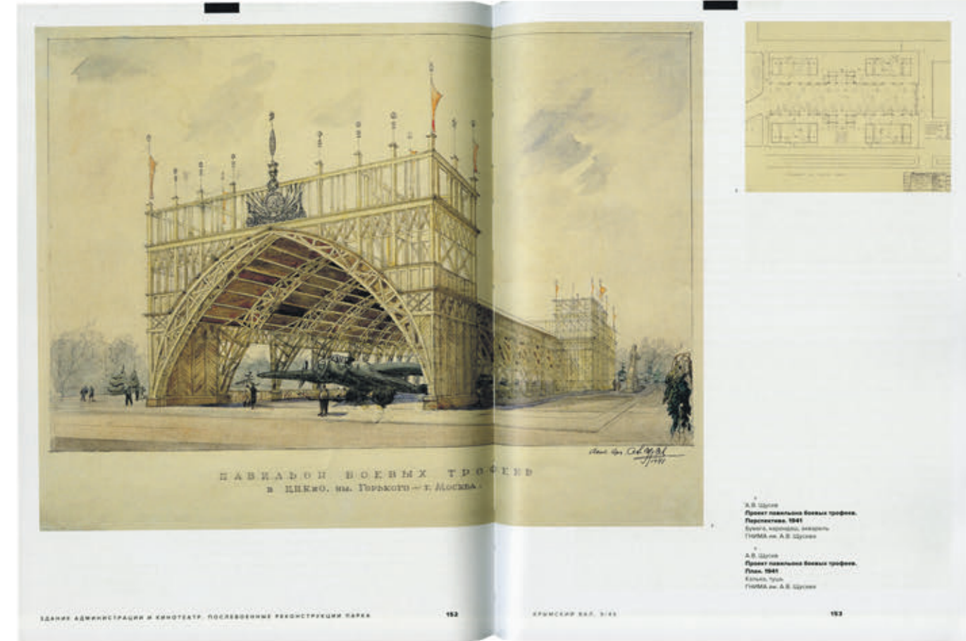
1941 год. Набросок и план проекта павильона боевых трофеев в Центральном парке культуры и отдыха имени Максима Горького за авторством архитектора Алексея Щусева

Предисловие увесистого тома сразу сообщает читателю, что именно его ждет в ближайшие три-четыре часа. Две сотни страниц, заполненные преимущественно историческими фотографиями Парка Горького, архитектурными схемами и чертежами, повествуют о почти 120-летней истории одного-единственного здания, в котором ныне располагается музей современного искусства «Гараж». История в книге «Крымский Вал 9/45. Неизвестный памятник Парка Горького» ведется от 1893 года, когда о Центральном парке культуры и отдыха имени Максима Горького в Москве еще и речи быть не могло. Читателя за руку проводят через несколько десятилетий существования здания, которое сначала было Судостроитель-