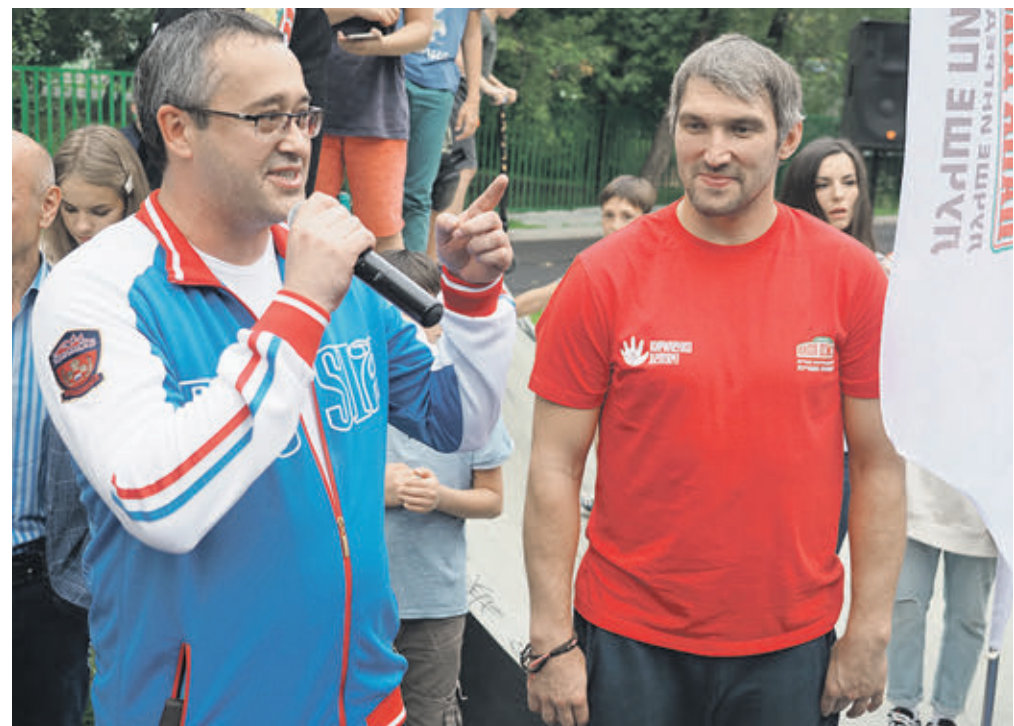
Вчера 16:04 Спикер Мосгордумы Алексей Шапошников и хоккеист Александр Овечкин (справа) на открытии баскетбольной площадки