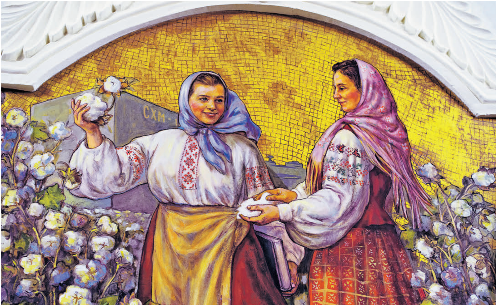
Мозаичное панно, изображающее сборщиц хлопка, украшает станцию метро «Киевская».

История столичной подземки — это путешествие во времени, гримасы которого оставили свои заплаты, вместе с тем это и рассказ об эволюции эстетических представлений и понятий о красоте, о том, как регламентировалась творческая свобода, вздувались и сжимались бюджеты на строительные материалы. В архитектурном отношении метро оказалось совершенно всеядным организмом. Проектировать станции в самые короткие сроки поручали зодчим разных поколений, в том числе с дореволюционным образованием: Николаю Ладовскому, Ивану Фомину, Ивану Таранову, Алексею Душкину, братьям Яковлевым, Владимиру Шуко и другим. Все они не имели перед глазами никаких образных концепций и отправных точек для оформления объекта новой типологии. Возможно, благодаря установке свыше «строить красивые станции» сегодня в метро собрана вся энциклопедия, учебник для