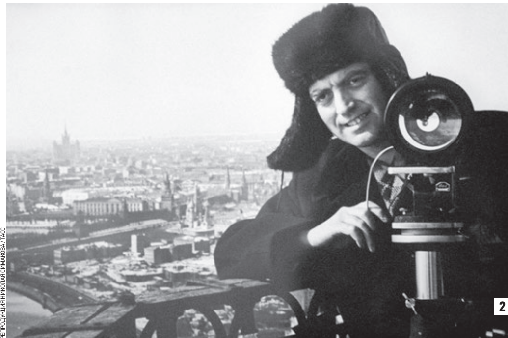
6 июля 1963 года. Американская актриса Сьюзен Страсберг на III Московском международном кинофестивале (1) стала одной из звезд, попавших в объектив Валерия Генде-Роте (2)

В книге представлена неформальная жизнь Московского кинофестиваля от 1961 до 1991 года. Снимки Валерия Генде-Роте никогда не были протокольными, что бы он ни снимал. На весь мир известна его фотография Юрия Гагарина, когда первый в мире космонавт делает доклад главе советского государства Никите Хрущеву. Валерий Генде-Роте всю жизнь был приверженцем неформальной фотографии, и трудиться в СССР ему было нелегко. Но оттого так легки и непринужденны его фотографии. Московский международный кинофестиваль был своеобразным окном, через которое проходило общение людей, разделенных железным занавесом, — СССР и всего остального мира. Владимир Генде-Роте снимал Софи Лорен, Марину Влади, Федерико Феллини, Джину Лоллобриджиу, Милоша Формана, Элема Климова, Ларису Шепитько — все эти имена много говорят любителям кино. Посмотрев альбом, можно понять, как проходила неформальная часть общения звезд мирового кино с советскими людьми. Мне довелось быть знакомым с Валерием Генде-Роте лично. На съемках это был совершенно незаметный человек. Репортажный метод его работы