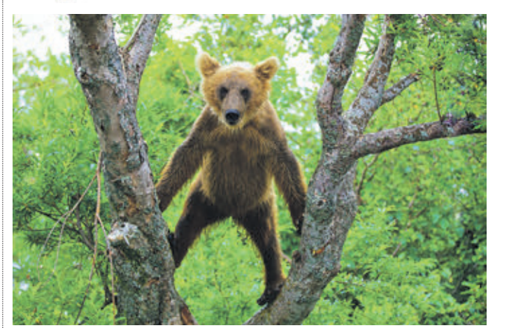
Фотография «Хозяин русского леса», сделанная Геннадием Юсиным в Южно-Камчатском заказнике

диких медведей с его необыкновенной природой. Медведи на отдыхе, медведи на рыбалке, мишки в лесу, мишки в снегу, мишки с высоты и мишки с земли... А еще есть лисы, парочка китов и каланов, упомянутая выше нерка, топорок, семейка песцов, белоплечий орлан... Юсин искренне любит всю эту заповедную братию, однако это скорее умиление горожанина, которому посчастливилось вырваться на природу из бетонного плена мегаполиса, нежели вдумчивый взгляд знатока-натуралиста. В отличие от классиков фотоанималистики, снимающих повседневную жизнь зверей, прекрасно в ней разбирающихся и готовых ради одной выразительной фотографии неделями сидеть в засадах, Юсин скорее снимает зверей в интерьере, в роли которого у него выступают декорации камчатских заповедников. В снимках много глянца и даже гламура, они красивы, порой предсказуемы, отлично подойдут для настенного календаря или заставки на монитор, но Юсин, похоже, и не претендует на звание классика жанра. Он просто снимает землю, похитившую его сердце, и явным образом, что был в этом у нее не первым и уж точно — не последним.