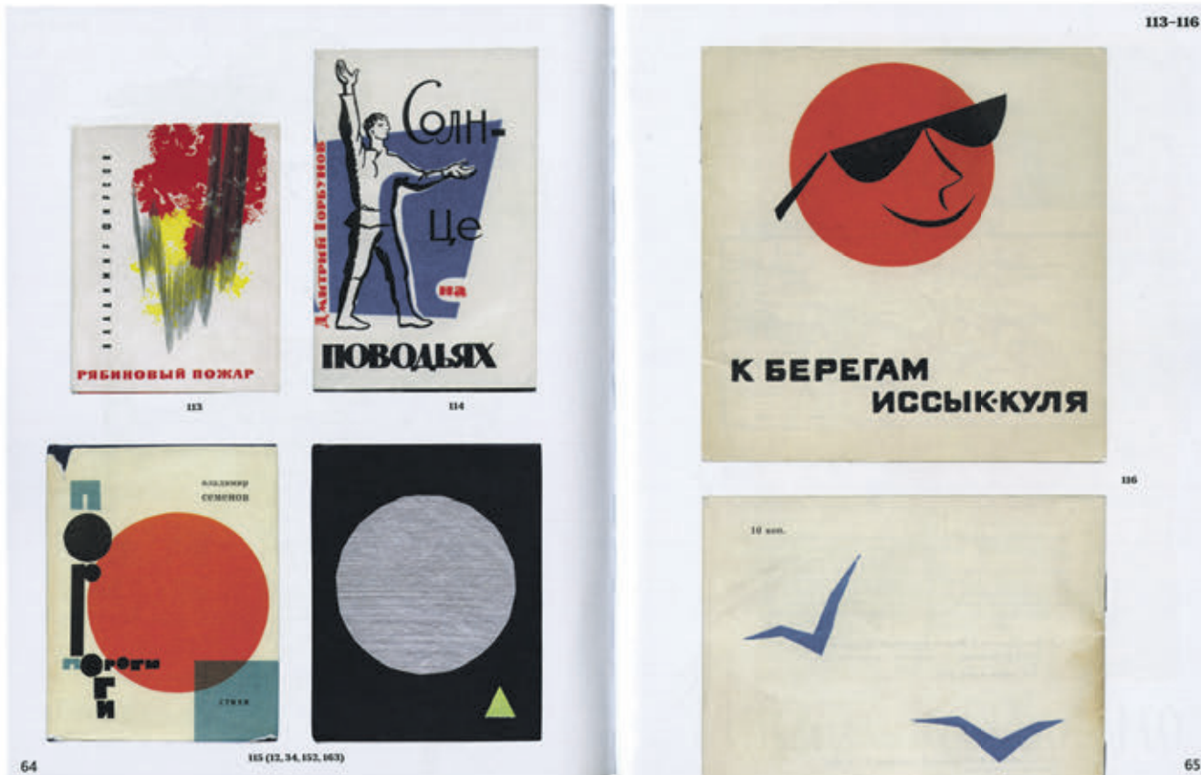
Иллюстрации из книги Владимира Кричевского «Графические знаки Оттепели», демонстрирующие образцы книжного оформления 60-х годов прошлого века

Заслуженный графический дизайнер Владимир Кричевский в своей новой книге «Графические знаки Оттепели» изучил и обобщил книжное оформление 60-х годов XX века. Советский промышленный дизайн того времени заметно отличался от предыдущего сталинского периода.