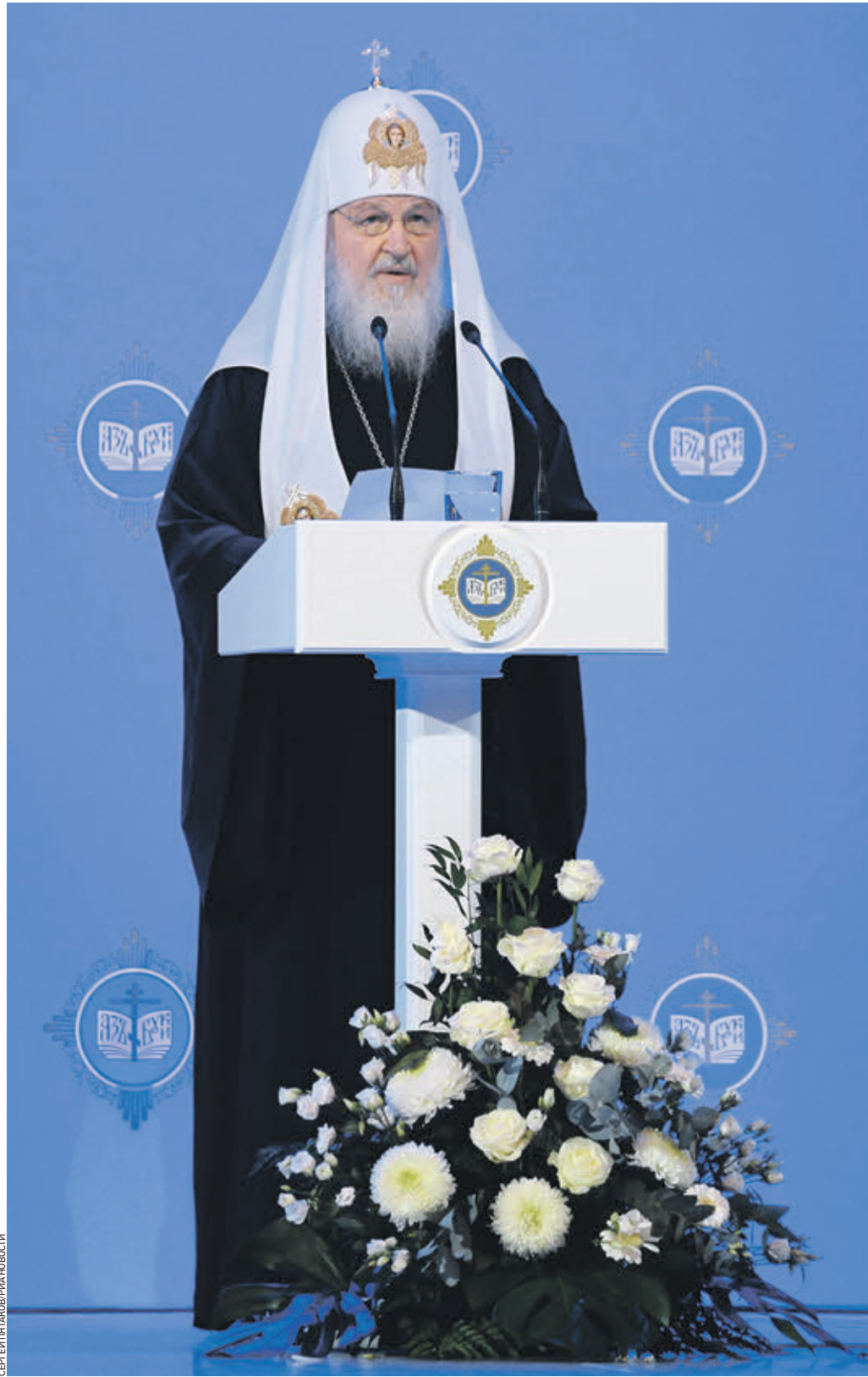
Вчера 16:07 Патриарх Московский и всея Руси Кирилл на торжественной церемонии открытия Международных Рождественских чтений в Государственном Кремлевском дворце

— Мы должны по-новому понять и осмыслить события войны. Не случайно первым человеком, который призвал встать на защиту, был патриарх Сергей. Именно Церковь первой произнесла призыв бороться с захватчиками. Через документы, факты, свидетельства мы должны показать, каким вышел советский народ из войны, каково наследие Великой Победы, — сказал первый