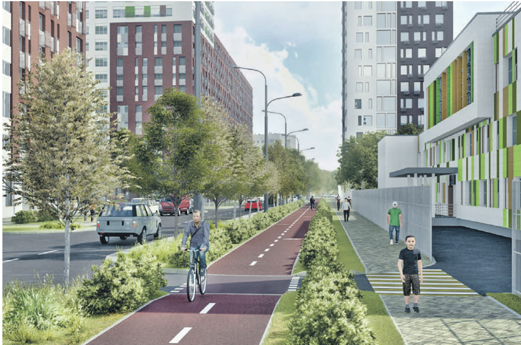
Проект планировки территории микрорайона Ж в Люблине на юго-востоке Москвы. Здесь, на месте пятнадцати снесенных домов, возведут жилые строения площадью 188 тысяч квадратных метров, а также социальные и образовательные учреждения

Больше всего домов предполагается расселить в микрорайонах 36–28 района Восточное Измайлово и кварталах 2, 4 района Очаково-Матвеевское — по 33 пятиэтажки в каждом. В микрорайонах Восточное Измайлово построят 10 новых домов, школу на 600 мест, два детских сада на 140 и 200 мест, ФОК с бассейном, детскую поликлинику на 320 посещений и культурно-досуговый центр. В Очаково-Матвеевском возведут