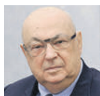
ВЛАДИМИР РЕСИН Депутат Госдумы РФ, Советник мэра Москвы

Приятно видеть, как наша программа совершенствуется, как оттачивается система организации всего комплекса работ — от создания и прихода, поиска благотворителей, подготовки площадки к строительству до сдачи объекта и его последующей эксплуатации. Это большой труд и большая ответственность. С 2010 года в эксплуатацию по программе введен 71 храм. Из них 57 храмовых комплексов в рамках программы и 14 — сверх нее. Девять храмов ожидают ввода, из них четыре — сверх программы. 12 объектов возведены, на них завершены основные строительные-монтажные работы, предостаток отделки и украшения. Среди них тоже есть два храма сверх программы. За девять лет, что существует наша программа, мы вплотную подошли к рубежу — 100 храмов.