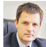
СЕРГЕЙ КУЗНЕЦОВ ГЛАВНЫЙ АРХИТЕКТОР МОСКВЫ

В целом тот факт, что Министерство строительства и жилищно-коммунального хозяйства России выходит с инициативой усиления авторского контроля, считаю очень правильным. Роль архитектора действительно нужно усиливать.