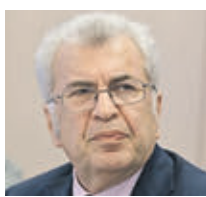
ЕВГЕНИЙ ЯМБУРГ ДОКТОР ПЕДАГОГИЧЕСКИХ НАУК

Школьникам хотят разрешить семейное обучение. И как вам?