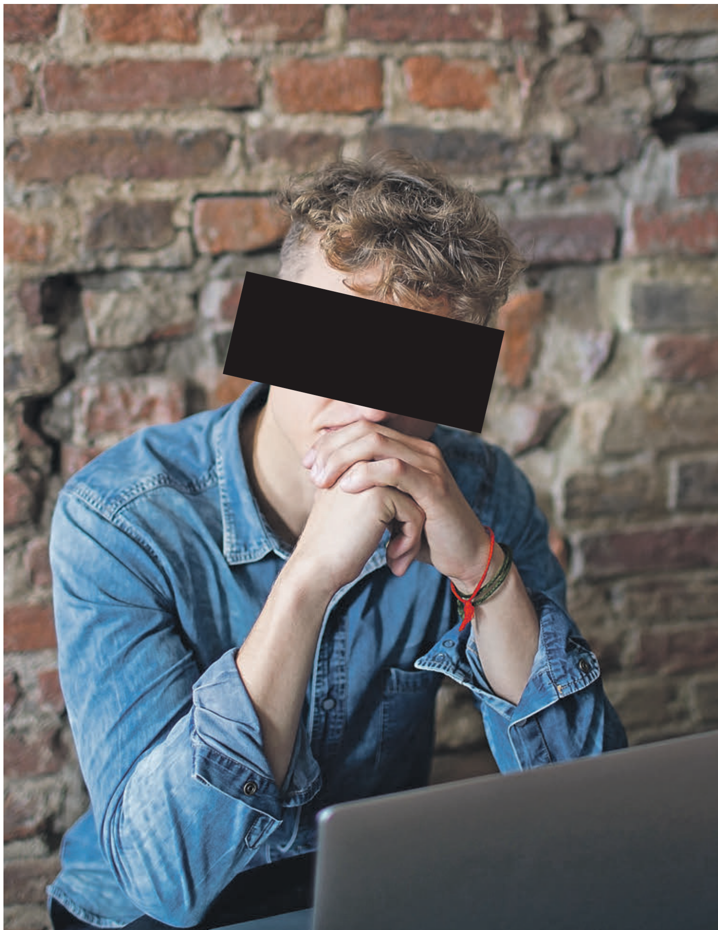
Авторы многих популярных в интернете текстов остаются анонимными. Иногда — помимо собственного желания

Пока есть плагиат и воровство контента, пренебрежение к труду других людей, их авторству — бумага будет жить».