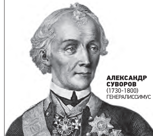
АЛЕКСАНДР СУВОРОВ (1730-1800) ГЕНЕРАЛИССИМУС

Тайна есть только предлог, больше вредный, чем полезный. Болтун и без этого будет наказан.