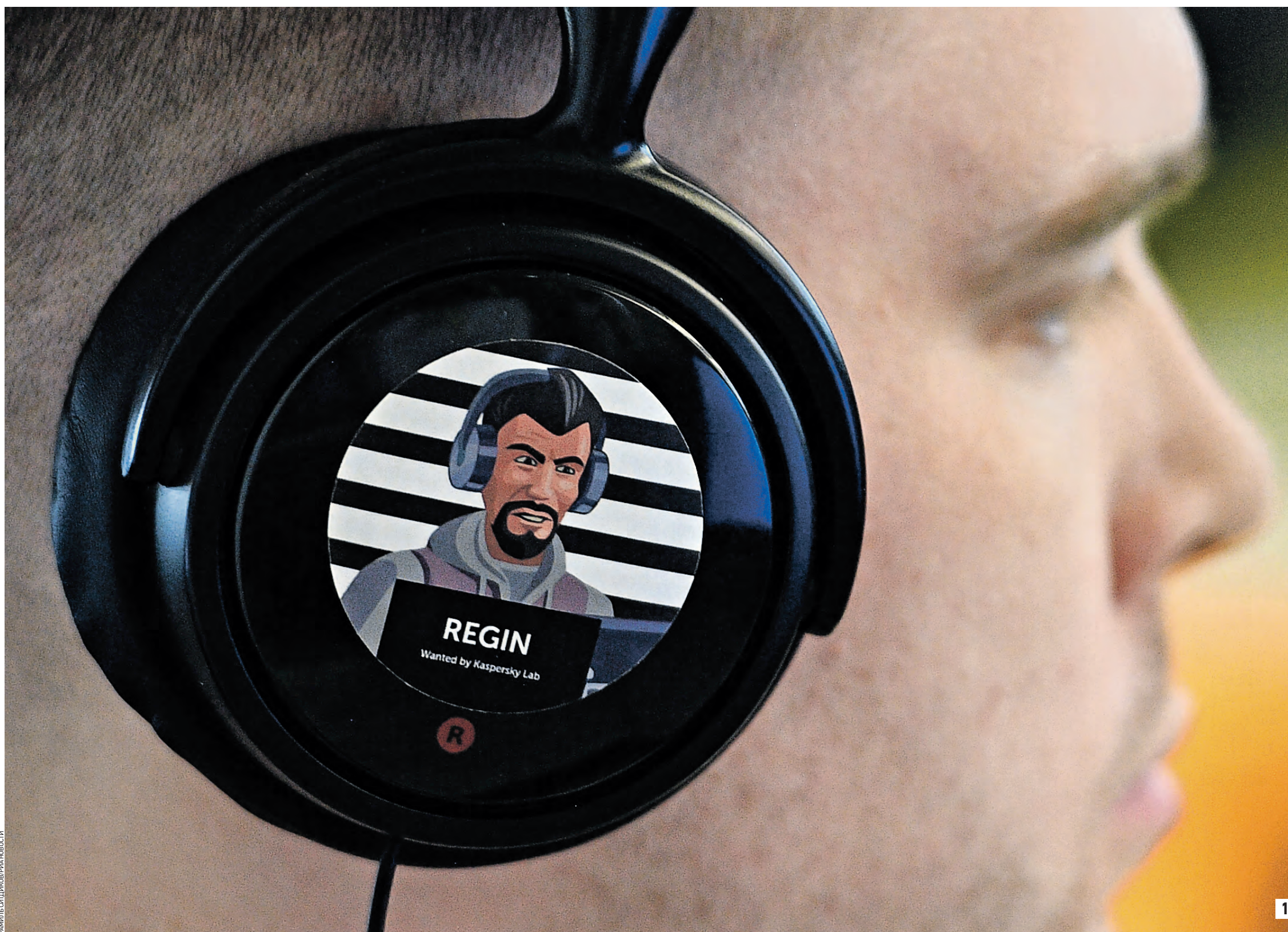
16 мая 2019 года. Один из сотрудников компании «Лаборатория Касперского», работающей в сфере информационной безопасности с 1997 года. Технологии компании защищают более 400 миллионов пользователей и 270 тысяч корпоративных клиентов, включая государственные органы, во всем мире (1) Советский плакат «Болтать — врагу помогать» создавался художником Виктором Корецим в 1954 году, в условиях, когда Советский Союз был окружен потенциальными внешними врагами, а шпионаж расцветал буиным цветом (2)

Эпоха цифровых технологий диктует перемены подхода к безопасности данных