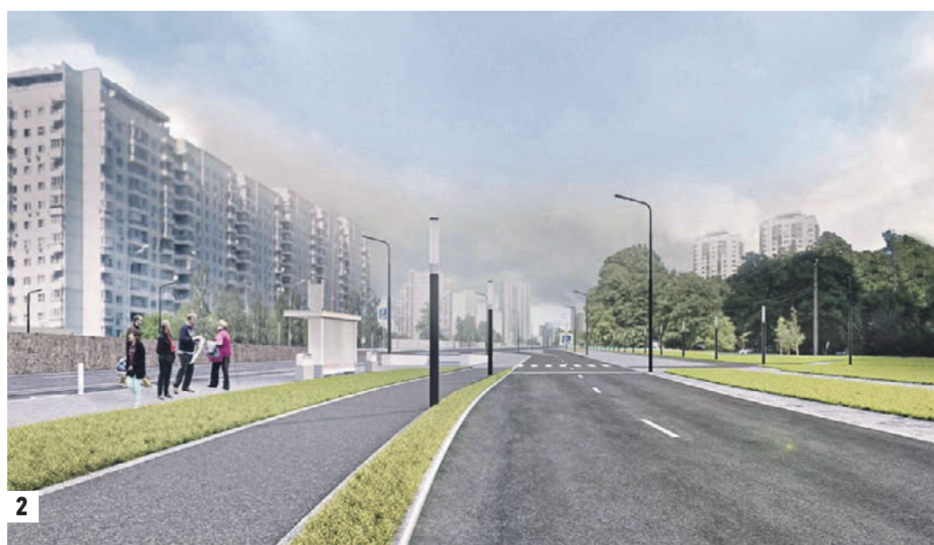
Проект архитекторов. Так будут выглядеть благоустроенные территории участка Ленинского проспекта от улицы Кравченко до Московской кольцевой автодороги (1) Благоустройство одной из ключевых магистралей столицы завершится уже в этом году (2)