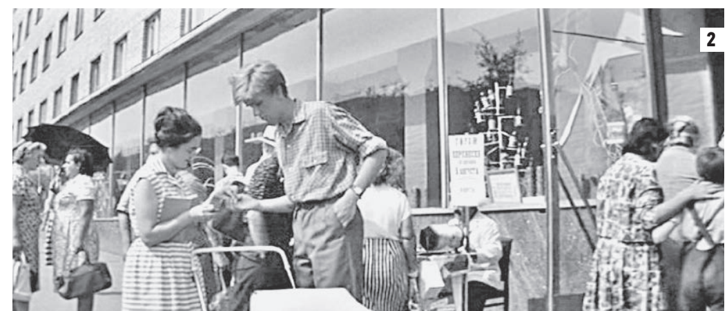
23 марта 1965 года. Летчики-космонавты Павел Беляев и Алексей Леонов (в центре, слева направо) в кортеже на Ленинском проспекте после завершения полета на корабле «Восход-2» (1) Кадр из фильма «Я шагаю по Москве» (2)

месте расположено здание Института общей и неорганической химии имени Курнакова. В середине века активно строился юго-запад столицы, потому в кадрах, в которых