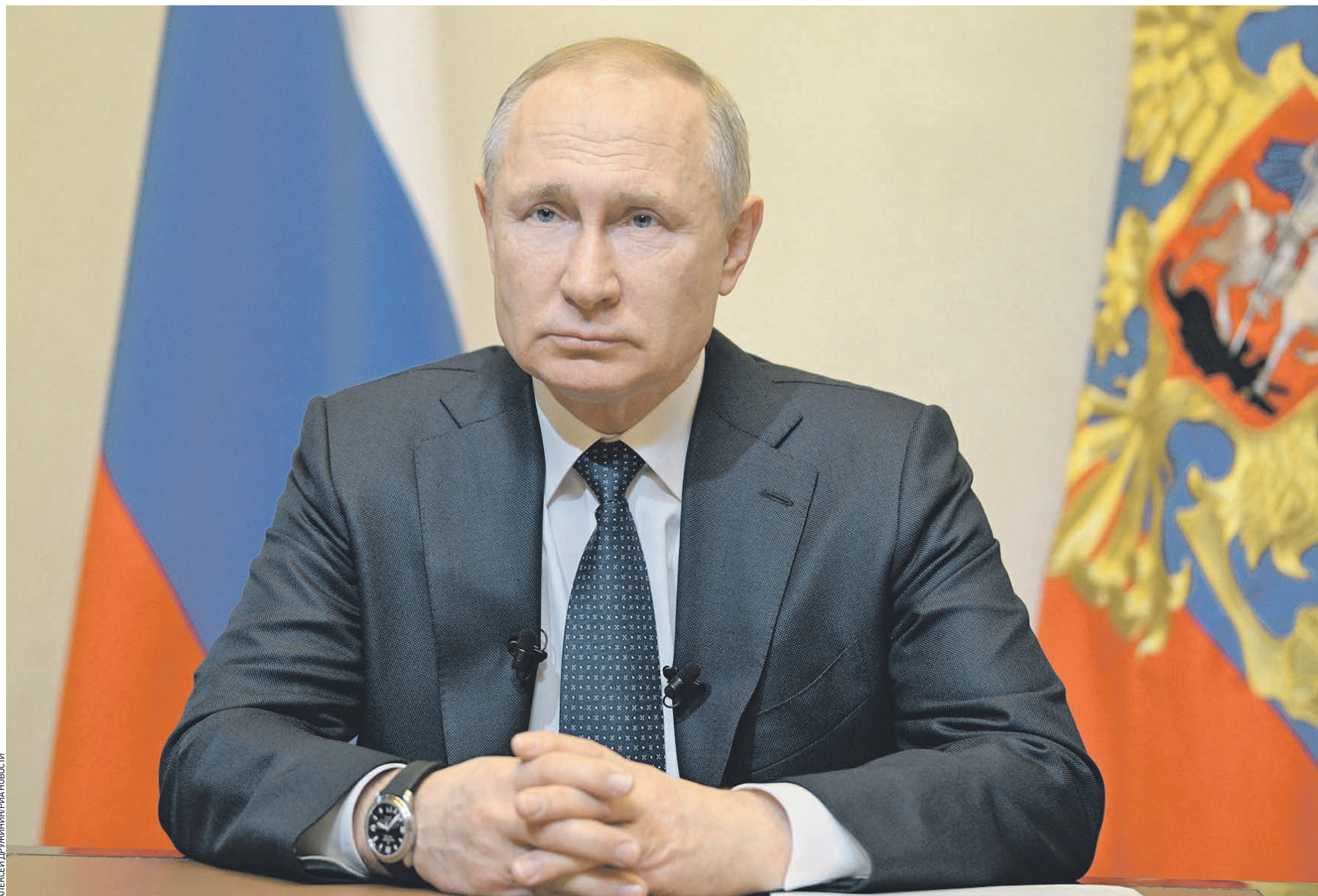
Вчера 16:33 Президент Владимир Путин выступает с обращением к гражданам России

Глава государства отметил, что ситуация с пандемией коронавируса в мире развивается остро, и подчеркнул, что главный приоритет — жизнь и здоровье наших граждан. В связи со сложившейся ситуацией Владимир Путин принял решение о переносе Общероссийского голосования по поправкам в Конституцию, ранее назначенное на 22 апреля. А чтобы предотвратить угрозу быстрого распространения болезни, он объявил следующую неделю нерабочей, с сохранением заработной платы. — Выходные дни продлятся с субботы, 28 марта, по воскресенье, 5 апреля, — пояснил президент, уточнив, что все структуры жизнеобеспечения, в том числе медицинские учреждения, аптеки, магазины, учреждения, обеспечивающие банковские и финансовые расчеты, транспорт, а также органы власти всех уровней продолжат свою работу. Важно, по его мнению, обеспечить социальную защиту граждан, сохранение их доходов и рабочих мест, а также поддержать малого и среднего бизнеса, в котором заняты миллионы людей. В этой связи Владимир Путин принял