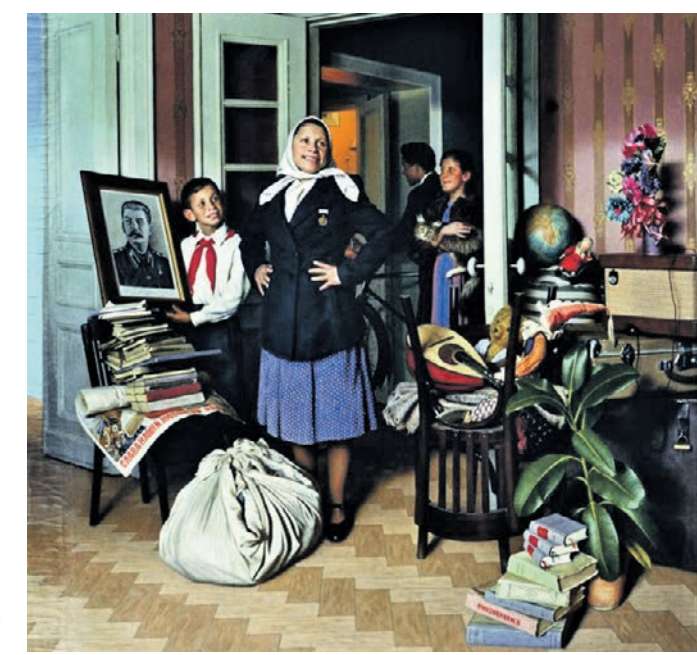
Переезд на новую квартиру. Художник — Александр Лактионов, 1952 год

По первой программе сноса пятиэтажек осталось расселить 24 дома. Четыре дома на северо-востоке снесут за счет бюджета до конца года.