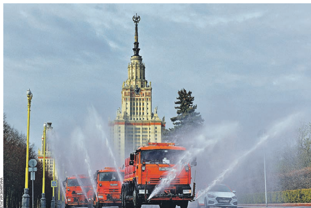
24 апреля 08:35 Колонна автомашин Комплекса городского хозяйства проводит дезинфекцию смотровой площадки на Воробьевых горах и территории около МФУ

В Москве до пандемии уровень регистрируемой безработицы составлял 0,43 процента от экономически активного населения. На сегодня уровень безработицы вырос и составляет 0,66 процента. Несмотря на сложившуюся трудную ситуацию на рынке труда, Центр занятости населения продолжает помогать москвичам в поиске работы. Сегодня в банке центра «Моя работа» кандидатам доступно порядка 40 тысяч вакансий. С 26 марта центр занятости трудоустроил 1364 человека.