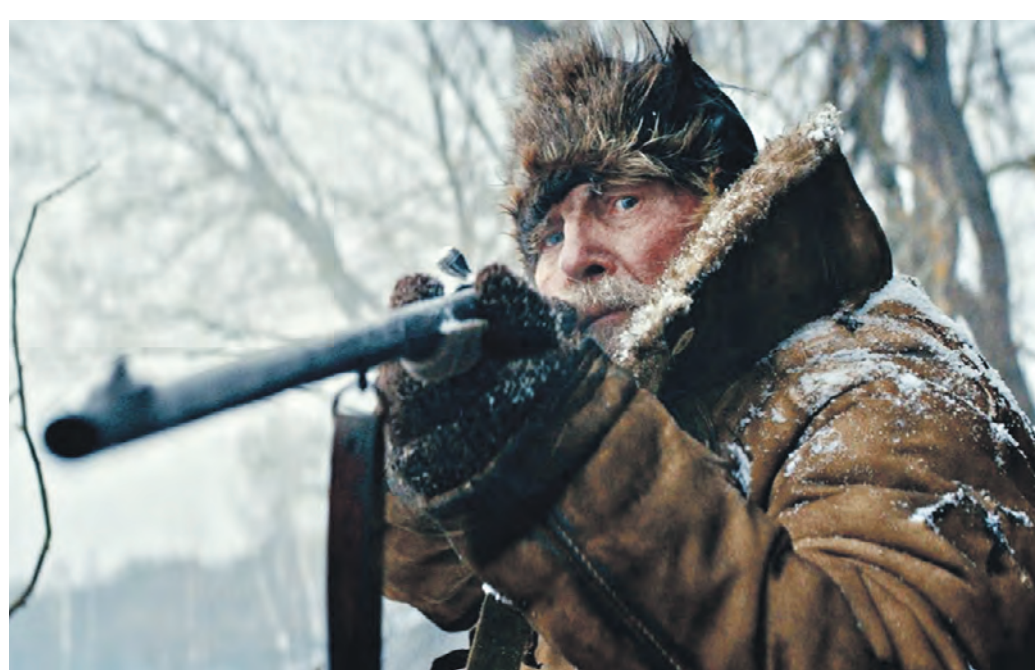
Народный артист Беларуси Владимир Гостюкин в фильме «Красный призрак» сыграл проводника, который отлично знает местность «Вяземского котла»