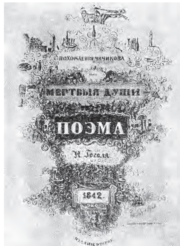
Обложка поэмы «Мертвые души», изданной в 1842 году. Рисунок Николая Гоголя

Белинский, Некрасов, другие прогрессивные деятели того времени увидели в «Мертвых душах» беспощадную сатиру на самодержавие и крепостное право. Гоголь с этим не согласился. Его замысел был шире. Он планировал написать три части поэмы по примеру «Божественной комедии» Данте. Труд Гоголя должен был указать народу путь выхода из изображенного в первом томе бюрократическо-крепостного «ада» через некое «чистилище» (второй том) в «рай» (третий том). Итог известен. От двух последних томов сохранились лишь отдельные фрагменты. Остальное (если оно существовало в реальности) было сожжено писателем. Осознав неподъемность задачи создать идеальный образ совершенного человека в многогранной «поэме», Гоголь попытался сделать это в публицистике. Но «Выбранные места