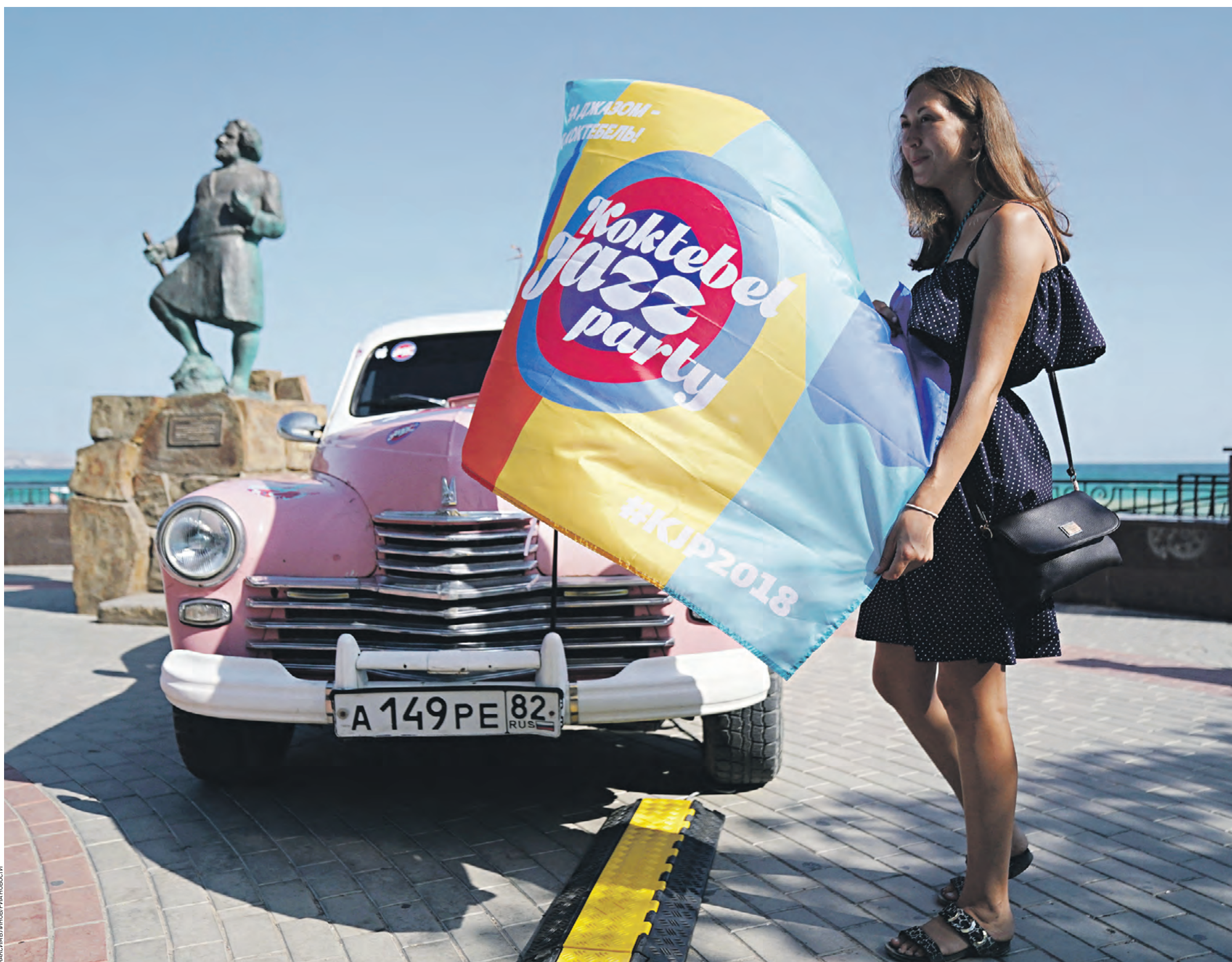
24 августа 2018 года. Туристка делает фото на память рядом с машиной «Победа» во время проведения музыкального фестиваля Koktebel Jazz Party на фоне памятника поэту Максимилиану Волошину