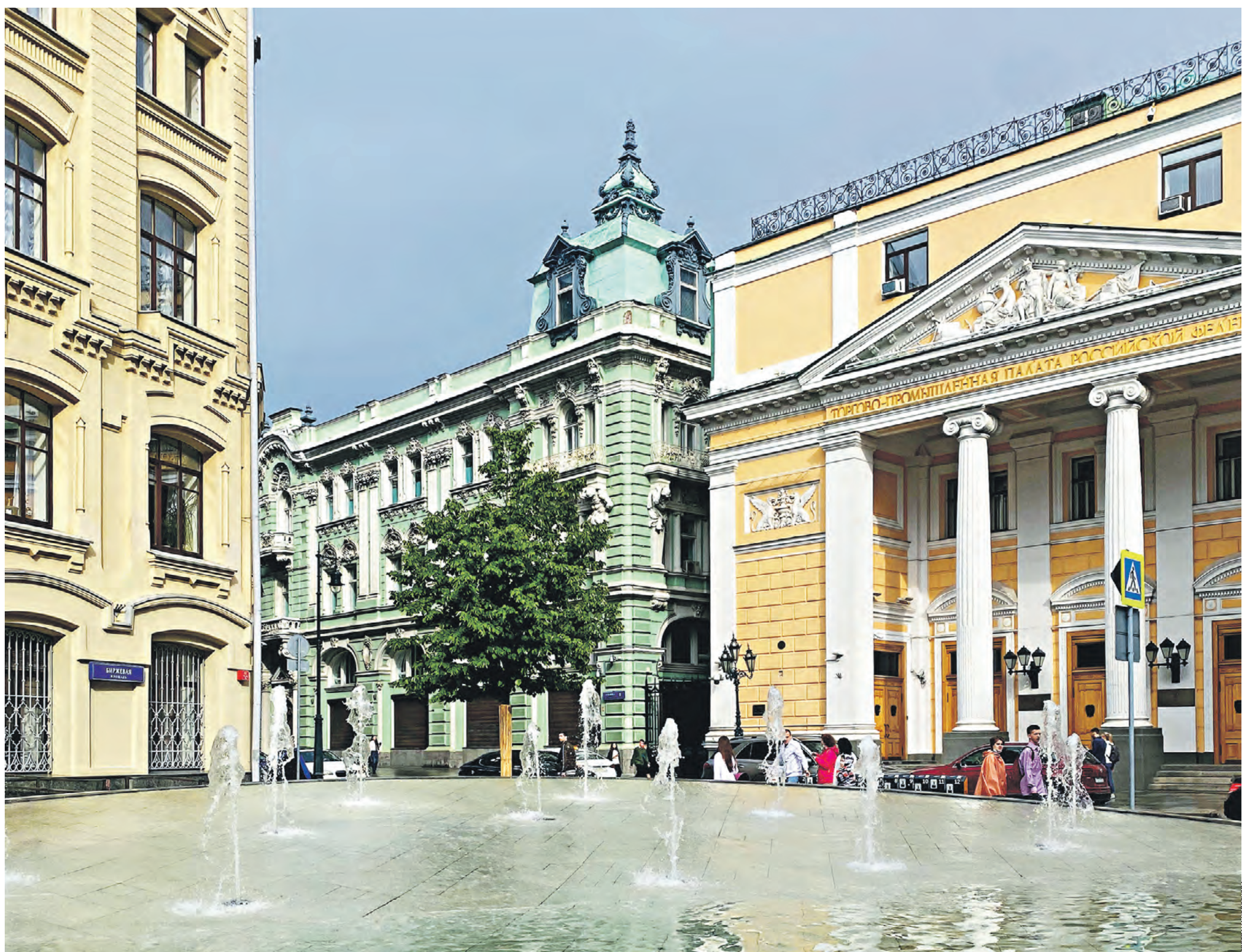
Фонтан на Биржевой площади. Внешне напоминает монету в воде, а еще он «сухой» — без чаши внизу