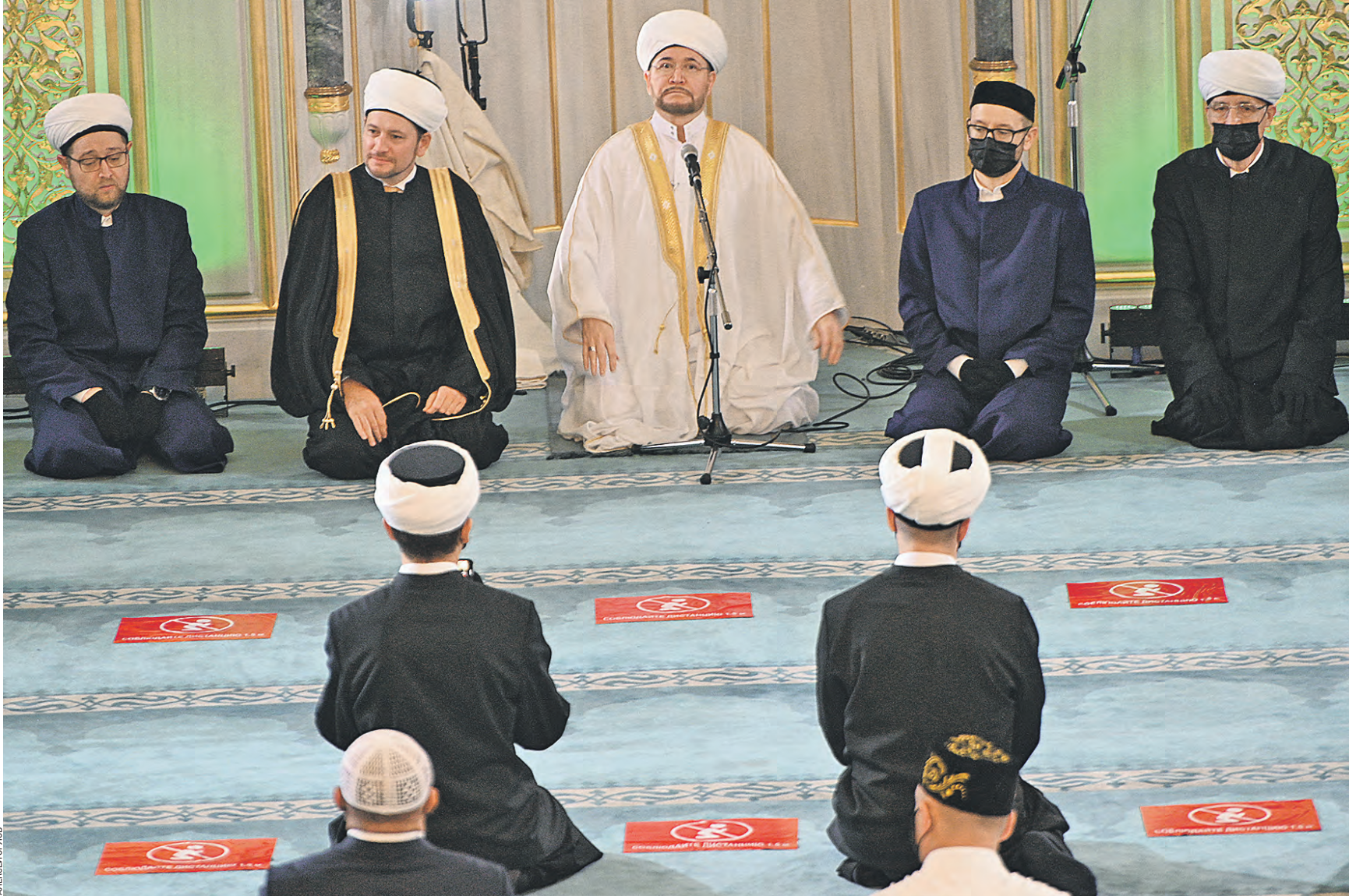
Вчера 8:04 муфтий Равиль Гайнутдин (в центре) вместе с членами Духовного управления мусульман Российской Федерации и представителями исламского духовенства города совершает праздничный намаз в Московской соборной мечети в честь Курбан-байрама

В это время прямо у выхода из метро «Проспект Мира» единовещив встречали подготовленные волонтеры, которые на разных языках объясняли