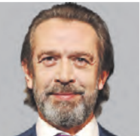
ВЛАДИМИР МАШКОВ ХУДОЖЕСТВЕННЫЙ РУКОВОДИТЕЛЬ ТЕАТРА ОЛЕГА ТАБАКОВА

го класса и за пять лет получить диплом о высшем актерском образовании. У ребят есть возможность раньше выходить на сцену и получать практический опыт. Я считаю, очень важно начать обучать актера его профессии как можно раньше. 15–16 лет — самый эмоционально выразительный период жизни человека, дальше социум заставляет нас гасить эмоции. В юности чувства еще не сформированы, зато эмоции яркие, потом чувства растут, а проявление эмоций становится не таким спонтанным и мощным. Актеру же важно зафиксировать пики этих состояний для своей дальнейшей деятельности. В юном возрасте можно увидеть всю свою эмоциональную палитру, а проявляется она через мимику, голос и пластику. Олег Павлович часто говорил, что его опора и надежда — выросшее «непоротое поколение». Но у меня есть ощущение, что первое «непоротое поколение» — то, которое мы набираем сейчас. Ребята очень быстро адаптируются в общении. Они открыты, не зажаты. Публичность не является для них стрессом. Они не пугливы, хотя, как и все юные, достаточно уязвимы.