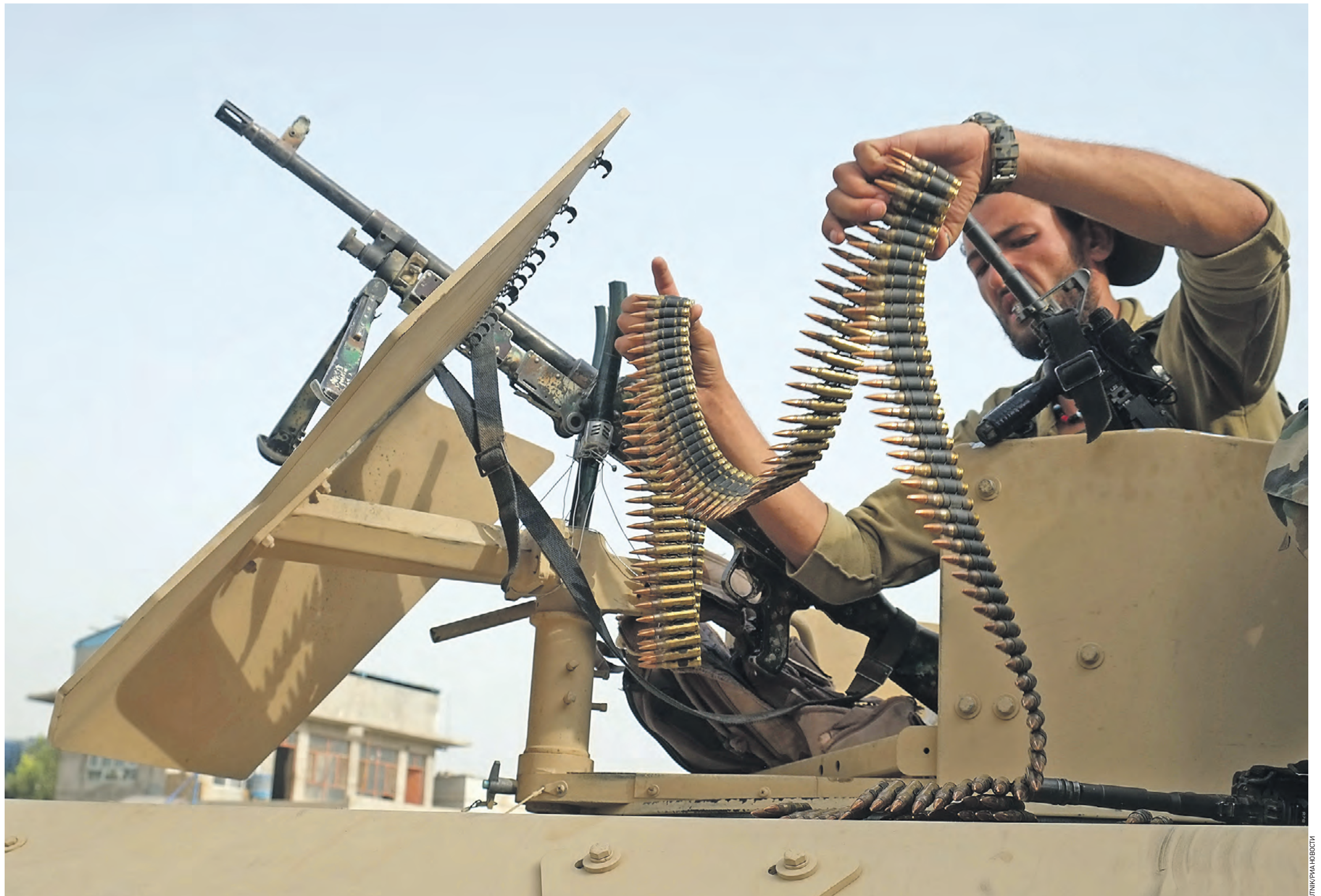
14 июля 2021 года. Военнослужащий правительственных войск Афганистана в 7-м районе города Нандагара. Продолжается противостояние с боевиками «Талибана» (движение признано террористическим, запрещено в РФ)