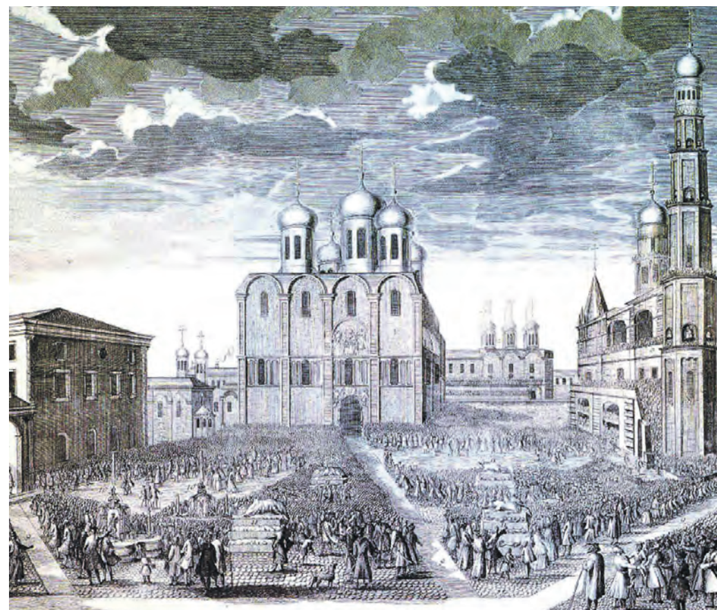
1744 год. Вид Успенского собора и Соборной площади. Гравюра Ивана Соколова по рисунку Иоганна Элиаса Гриммеля