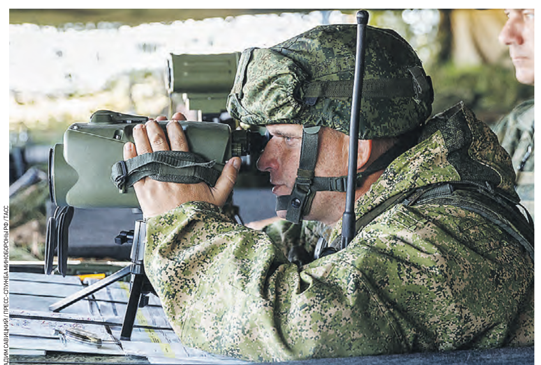
11 сентября 2021 года. Военнослужащий во время совместных российско-белорусских стратегических учений «Запад-2021» на полигоне Мулино в Нижегородской области

Они оказали настолько мощную огневую поддержку обороняющимся подразделениям коалиционной группировки войск, что наступающие дрогнули, остановились, побежали... Новейшая боевая машина пехоты оснащена 57-мм автоматической пушкой, пусковыми установками противотанковых управляемых ракет (ПТУР) «Корнет» и новым управляемым ракетным комплексом «Булат» с малогабаритными ракетами для поражения огневых точек и легкобронированной техники противника. Особенностью информационно-управляющей системы вооружения боевого модуля «Эпоха» является наличие системы автоматизированного поиска и распознавания объектов противника, их сопровождения, подготовки и выдачи экипажу боевой машины предложений по одновременному или поочередному применению двух каналов огневой поражающей способности. На учении «Запад-2021» запущены одна за другой противотанковые ракеты эффективно поразили установленные на бро-