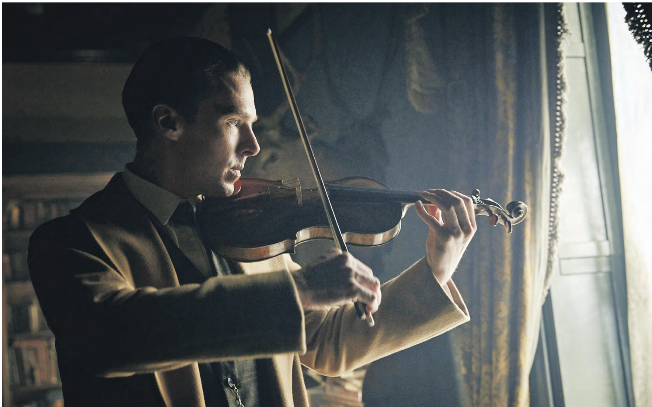
2010 год. Актер Бенедикт Камбербэтч в образе Шерлока Холмса в телесериале «Шерлок» создал идеальный образ сноба-профессионала: его высокомерие и презрительность по отношению к другим не имеют границ

— Сейчас у нас снобизм существует в двух ипостасях. Первая — класс нуворишей, среди которых, конечно, есть и очень образованные люди. Их снобизм связан с тем, что они абсолютно искренне не понимают, что кто-то может жить в иных реалиях, — рассказывает психолог. — После достижения определенного уровня материального достатка человек не лишается проблем — как минимум этот достаток нужно поддерживать, — однако он нередко забывает о том, как жил прежде. Или происходит иное: он отторгает, отталкивает от себя свои воспоминания, не желая соответствовать поговорке «из грязи в князи». Отсюда столь популярные в этой среде поиски родовых корней — в чем нет, конечно, ничего плохого, но корни именно благородных. Уже стихла мода на создание родовых гербов, скупки якобы фамильного антиквариата