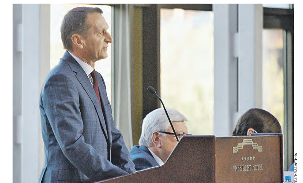
4 октября 10:11 Председатель Российского исторического общества Сергей Нарышкин приветствует участников Всемирного конгресса учителей истории, который впервые прошел в Москве. На мероприятии собрались педагоги из 37 стран мира, чтобы обсудить проблемы и перспективы исторического образования.