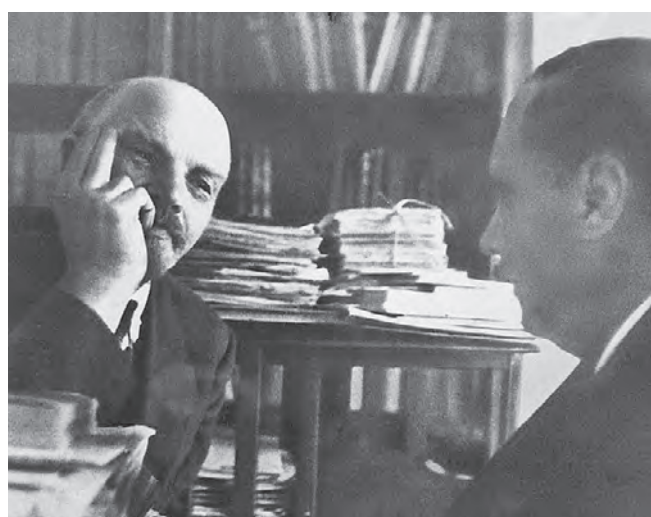
6 октября 1920 года. Владимир Ленин (слева) встретился в Кремле с писателем Гербертом Уэллсом