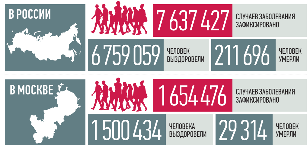
По данным стопкоронавирус.рф и mos.ru на 19:00 5 октября

Вакцина «Спутник V» остается эффективной против господствующего в настоящее время в России варианта нового коронавируса «дельта». Исследования показали, что критичного снижения эффективности нет, сообщил вчера представитель разработчика вакцины, глава лаборатории Центра имени Гамалеи Владимир Гуцлин.