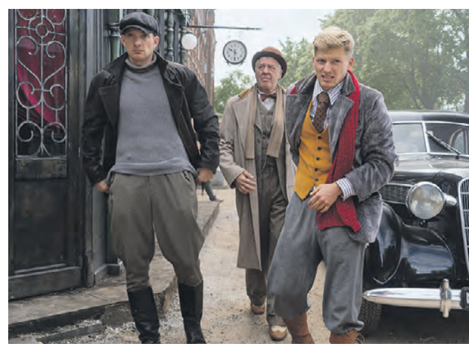
Кадр из нового сериала канала НТВ «За час до рассвета». Действие этой истории происходит в 1946 году

Телеканал НТВ заявил о сериальных новинках, которые он намеревается показать в наступившем году.