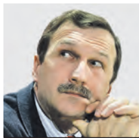
ГЕОРГИЙ БОБТ ОБОЗРЕВАТЕЛЬ

Мнение колумнистов может не совпадать с точкой зрения редакции «Вечерней Москвы»