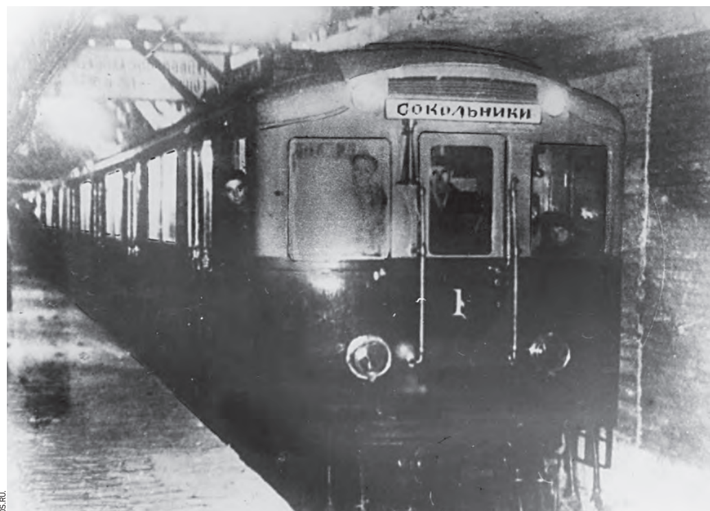
1934 год. Таким был первый поезд Московского метрополитена. Его собрали к открытию подземки на Мытищинском машиностроительном заводе