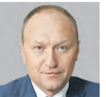
АНДРЕЙ БОЧКАРЕВ ЗАМЕСТИТЕЛЬ МЭРА МОСКВЫ ПО ВОПРОСАМ ГРАДОСТРОИТЕЛЬНОЙ ПОЛИТИКИ И СТРОИТЕЛЬСТВА

Также продолжится развитие проекта Московских центральных диаметров. Но главный проект дорожников на данный момент — формирование в столице системы хордовых магистралей. В целом в наших ближайших планах — ввести около 74 километров дорог. При этом необходимо отметить, что Москва всегда перевыполняет свои планы по дорожному развитию и вводит не менее 100 километров ежегодно. В Новой Москве планируется к вводу 45 километров магистралей. С учетом планов по развитию метро 2021 и 2022 годы станут настоящим прорывом в сфере транспортного развития этих территорий. Еще одной важной задачей является сохранение положительной динамики строительства в городе социальных, культурных и спортивных объектов.