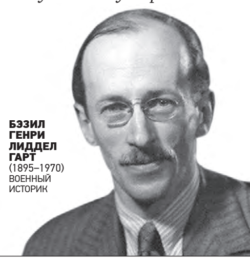
БЗЫЛ ГЕНРИ ЛИДДЕЛ ГАРТ (1895–1970) ВОЕННЫЙ ИСТОРИК

Победа под Москвой была одержана прежде всего мужеством и стойкостью русского солдата, его способностью выносить тяготы и непрерывные бои в условиях, которые прикончили бы любую западную армию.