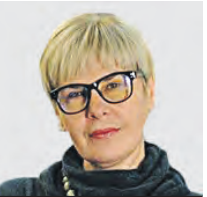
ОЛЬГА МАХОВСКАЯ ОБОЗРЕВАТЕЛЬ

Помимо уровня внимания, нужно контролировать и способность ребенка отдавать внимание, заботиться о другом, находить слова поддержки. Это очень связанные способности. Как только взрослеющий человек погружается в заботу об окружающих, от кошки до пожилой соседки, он меньше стягивает внимания себе. Открывается важный закон связи с другими людьми — взаимопомощь и взаимоподдержка. Помощь и внимание нужны слабым, сильные их дают. Тут уж выбирайте, на чьей вы стороне. И все-таки в тревожные времена мы все нуждаемся во внимании впрок. Говорят, что службы доставки цветов расцвели при пандемии. Это оптимистичный сигнал — люди хотят быть счастливыми и делиться счастьем.