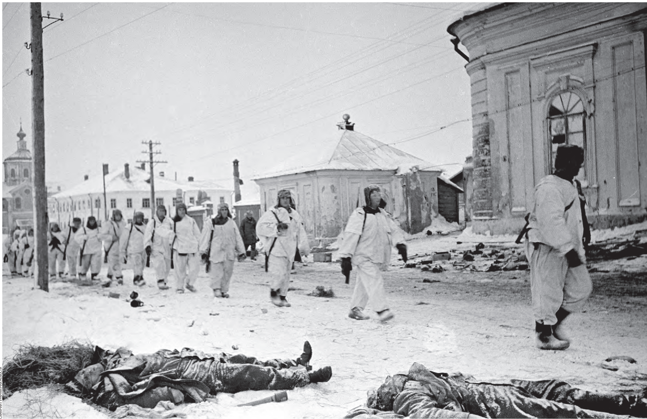
16 декабря 1941 года. В ходе Калининской наступательной операции город Калинин (ныне Тверь) был освобожден частями 29-й и 31-й армий Калининского фронта. Бойцы Красной армии вступили в город

Действительно, до Калинин танки 1-й танковой дивизии вермахта добрались 12 октября быстро и беспрепятственно. Оборонительные рубежи, окопы и противотанковые рвы, выкопанные вокруг областного центра женщинами и подростками, занять было попросту некому. Не из кого было советскому командованию организовать и оборону в самом городе. Однако к ходу, наскоком, германским войскам вернуться в Калинин все же не удалось. Дорогу врагу