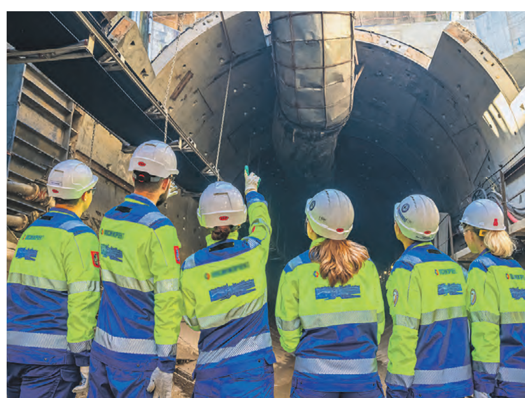
Специалисты инжинирингового холдинга «Мосинжпроект» осматривают ход работ на строительстве одной из станций Большой кольцевой линии метрополитена. Компания отмечает 63-летие участия в ключевых градостроительных программах Москвы

Параллельно ведется проектирование еще двух направлений — Рублево-Архангельской и Бирюлевской веток метрополитена, которые улучшат транспортную доступность северо-западных и южных районов города. Занимается холдинг и развитием улично-дорожной сети в столице. Так, крупнейшими проектами являются рекон-