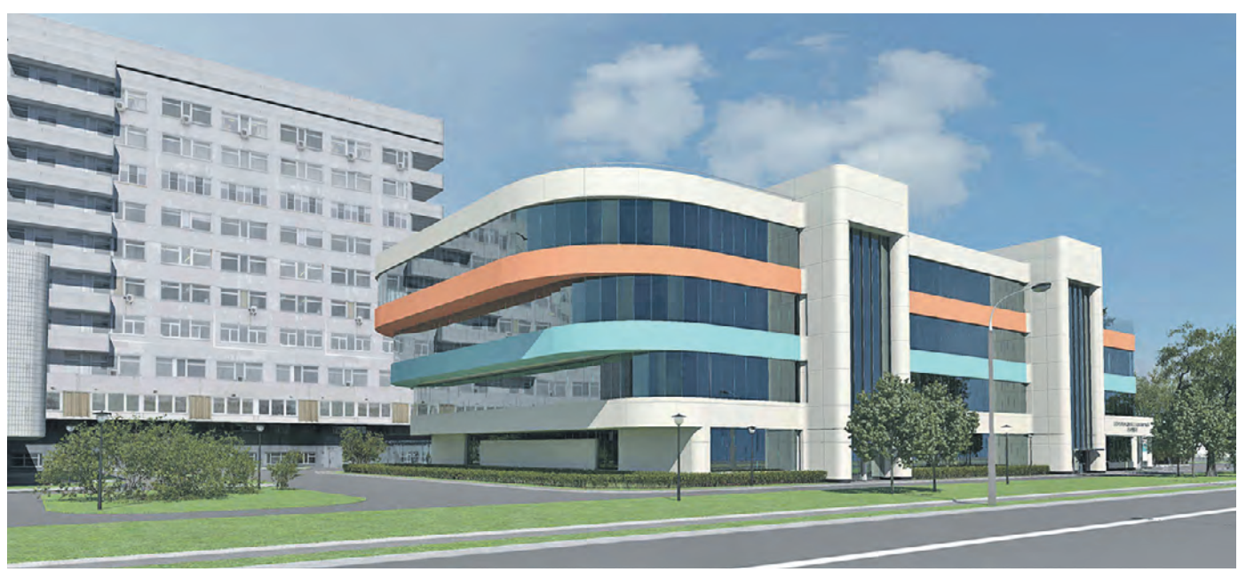
Проект скоромощного стационарного комплекса Городской клинической больницы № 15 имени Филатова. Здание учитывает архитектурный облик сложившегося больничного комплекса

Кроме того, в следующем году здесь будет введен в эксплуатацию корпус лучевой терапии на 50 коек и 8 «горячих коек» (изолированные койки для пациентов, получающих лечение радиоактивными препаратами). Уникальный комплекс для проведения 3D- и 4D-лучевой терапии обеспечит точечное воздействие на клетки опухоли. Комплекс помещений дневного стационара даст возможность проводить химиотерапию, отмечает Загрудинов. В корпусе будет работать лаборатория радиоизотопной диагностики, благодаря чему можно будет проводить своевременную диагностику онкологических заболеваний на ранней стадии.