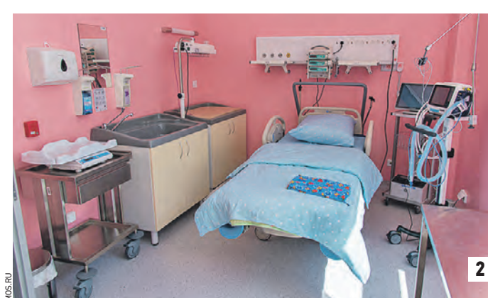
2 июня 2022 года. Новый перинатальный центр в Коммунарке открыли в июне (1) Палаты ждут первых пациентов (2)