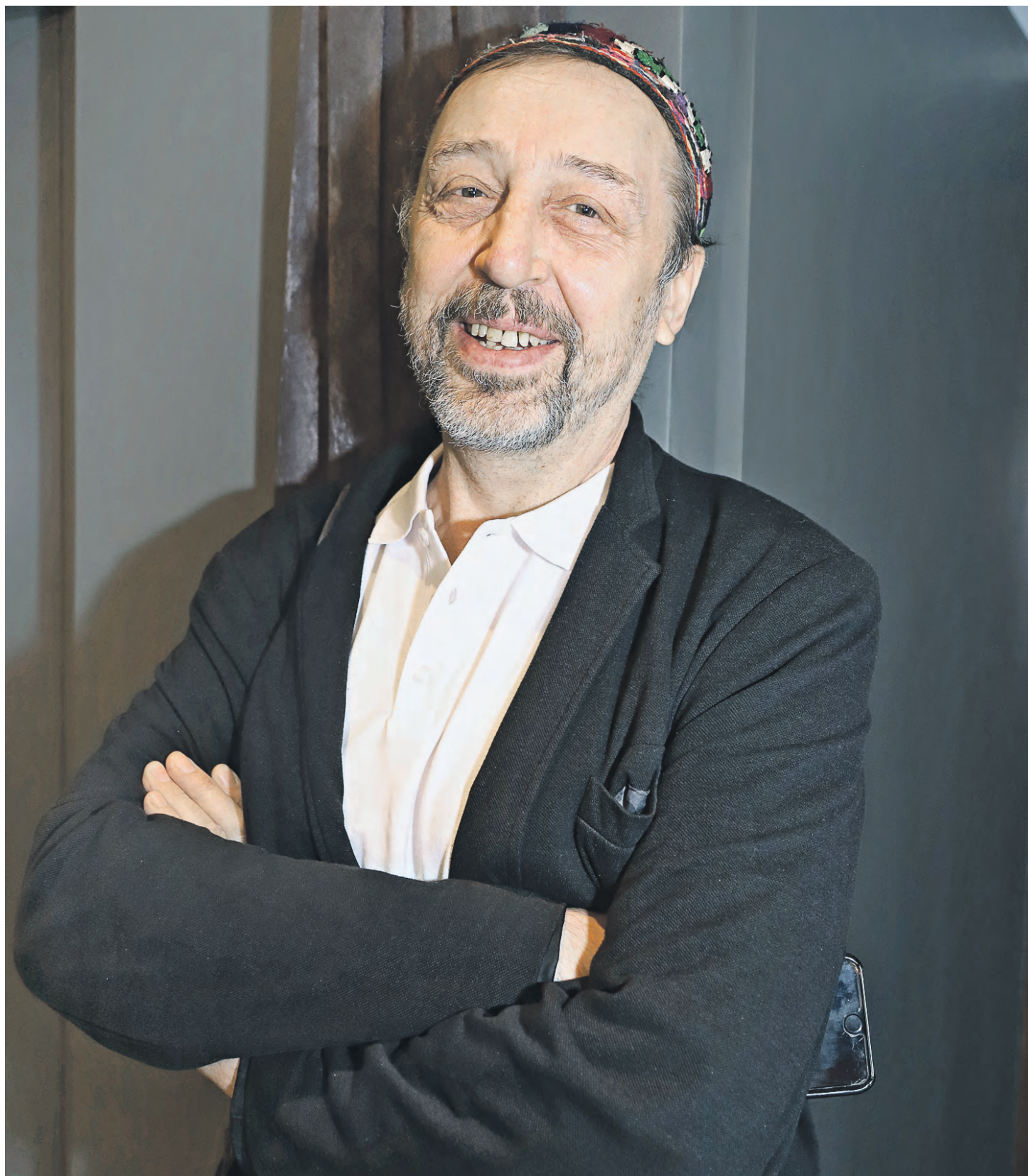
6 сентября 2019 года, Москва. Режиссер и драматург Николай Коляда в Театре имени Евгения Вахтангова на сборе труппы и открытии 99-го сезона

Вы и «чернуху» умудряетесь превращать в нежность. Как справляетесь с негативом? Посмеяться и пожалеть себя, кто жалеет зла. Господи, помирять-то все будем! А злиться — это