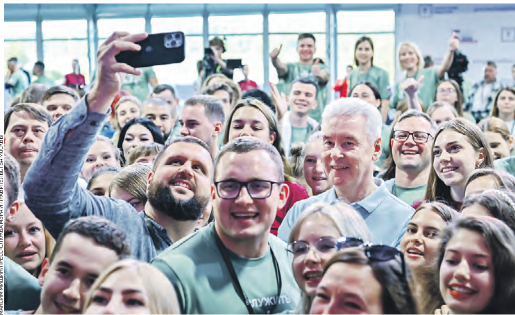
16 августа 19:03 Мэр Москвы Сергей Собянин (в центре) встретился с участниками форума «Территория смыслов» и рассказал об управлении столицей

развитие российской государственности. По традиции форум проходит на площадке образовательного центра президентской платформы «Россия — страна возможностей» в Солнечногорске. Встретившись с участниками, Сергей Собянин рассказал о развитии столичного региона в промышленном секторе и туристической отрасли, социальной и культурной сферах. Также молодежь заинтересовалась в мэра Москвы, как управлять столицей. Из зала прозвучал вопрос: где проще быть руководителем — в огромном мегаполисе или небольшом селе. — Управлять большим и малым — значит, испытывать примерно одинаковые трудности. Я не всегда мегаполисом управлял — работал в сельском, мэром маленького города, — поделился воспоминаниями Сергей Собянин. — У села свои проблемы, у города — свои, у мегаполиса — другие. Но решать все их,