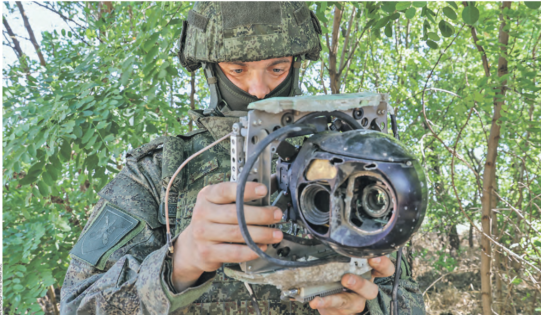
15 августа 16:40 Военнослужащий 58-й общевойсковой армии России держит в руках фрагмент беспилотного летательного аппарата, который сбили средствами противовоздушной обороны в Запорожской области