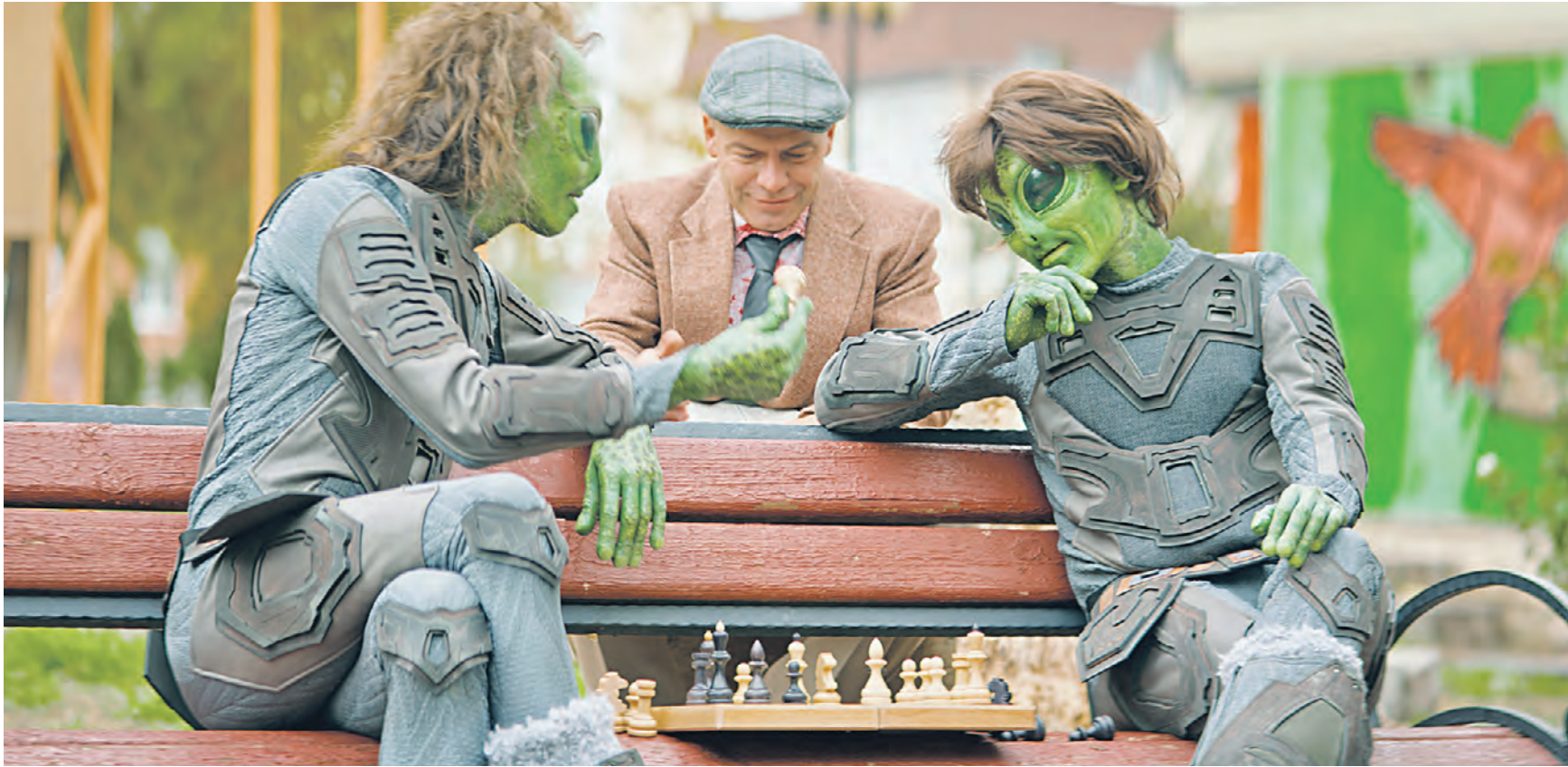
Кадр из фантастической комедии «Очевидное невероятное», проект онлайн-кинотеатра Онко стал участником фестиваля «Новый сезон»