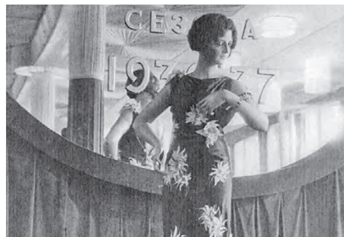
Манекенщица демонстрирует платье из коллекции осенне-зимнего сезона — 1936–1937 в зале Дома моделей на Сретенке

Празднично встретила пролетарская столица День советской авиации. С утра на стадионы, в сады и парки Москвы устремились массы трудящихся, чтобы спортивными состязаниями, карнавальными шествиями, народными гуляньями отметить День авиации. 19 августа 1935 года В этом году отметили важную дату — 100 лет со дня основания гражданской авиации России. Город поздравлял работников Московского авиационного центра. — Он был создан в 2003 году по распоряжению правительства Москвы. В учреждении сегодня