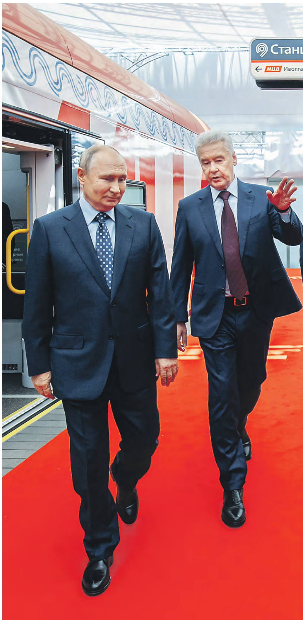
Вчера 14:32 Президент России Владимир Путин (слева) и мэр столицы Сергей Собянин запустили третий Московский центральный диаметр. Церемонии провели в «Манеже», где в рамках урбанфорума работает выставка о транспорте и его развитии