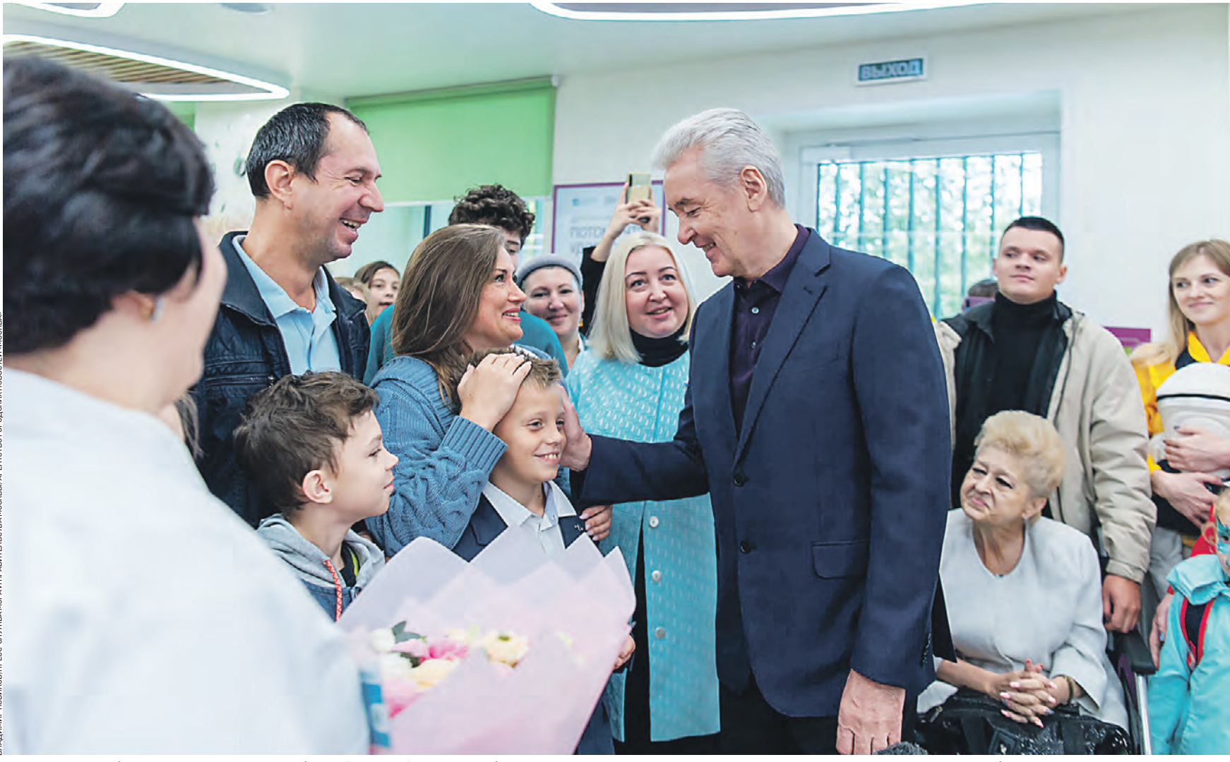
9 сентября. Мэр Москвы Сергей Собянин (в центре) осматривает обновленное медучреждение в столичном районе Лосиноостровский и пообщался с прикрепленными к нему горожанами. После напремота в поликлинике установили современное оборудование, появились комфортные кабинеты и зоны ожидания для пациентов

В своем личном блоге Сергей Собянин рассказал, как работает новый комплекс Центра имени Логинава. Прием пациентов в нем ведется с августа. За два месяца медицинскую помощь получили почти 90 тысяч человек.