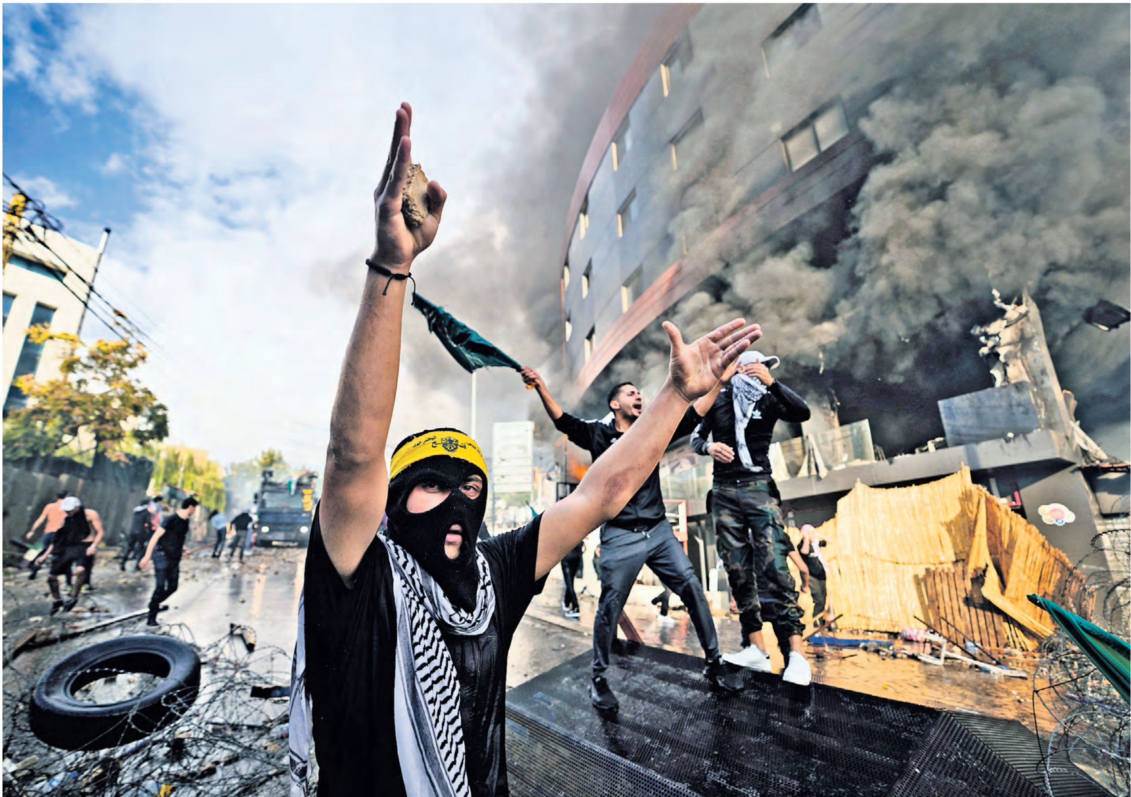
18 октября. Полиция применила водометы и слезоточивый газ для разгона протестующих в поддержку Палестины у здания посольства США в пригороде Бейрута