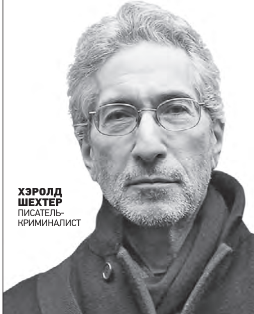
ХЭРОЛД ШЕШТЕР ПИСАТЕЛЬ КРИМИНАЛИСТ

Интерес к историям серийных убийц нельзя назвать нездоровым, поскольку истории, сказки, шутки и фильмы о кошмарных вещах помогают людям избавиться от подавленных страхов.