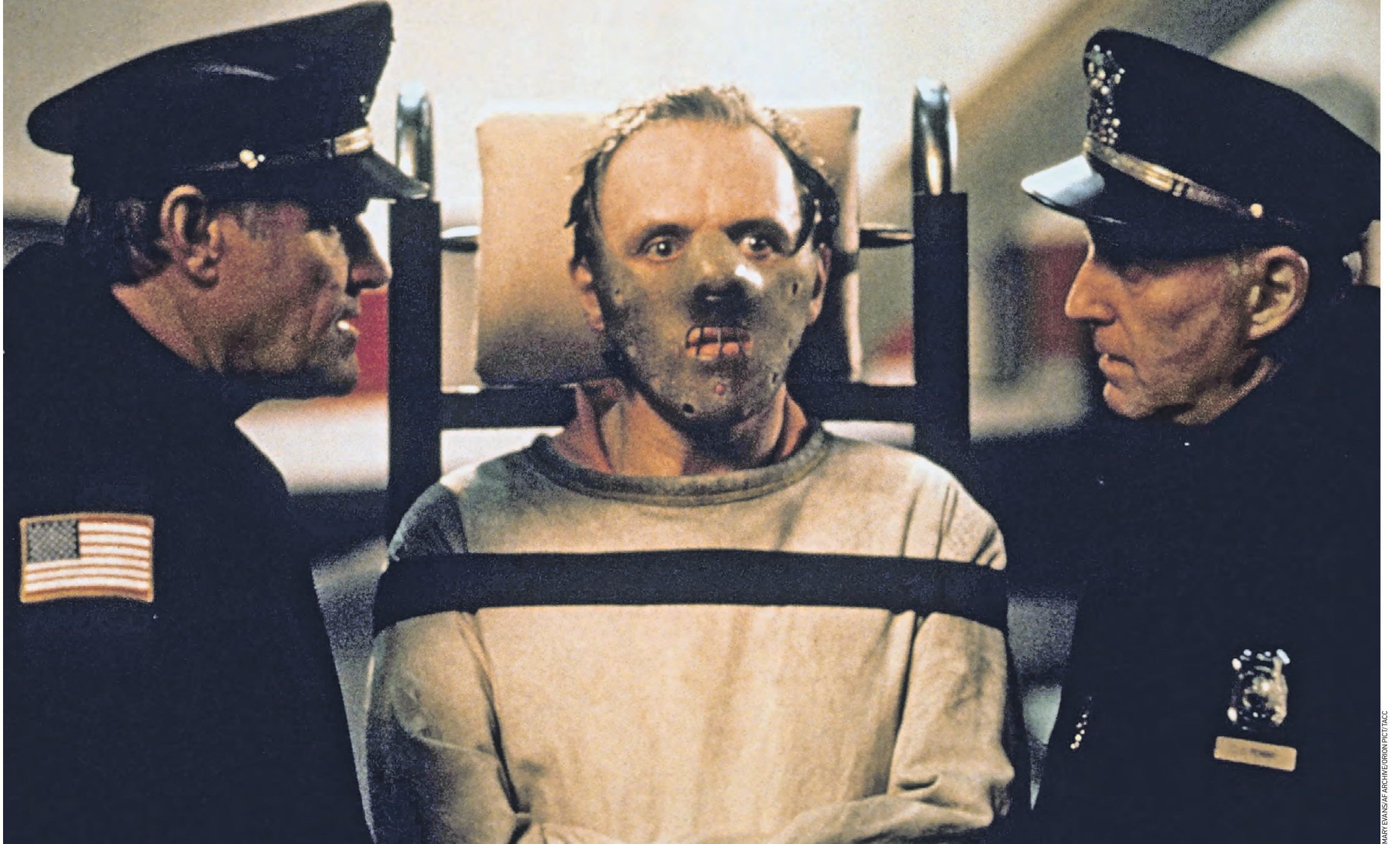
Кадр из фильма «Молчание ягнят» (режиссер Джонатан Демме, 1991 год). В роли заключенного серийного убийцы Ганнибала Лектера — актер Энтони Хопкинс

Нет. Если мы говорим про тех, кто совершил однократные минимальные преступления вроде кражи или чего-то подобного, то с ними еще можно работать через религию, философию экзистенциализма, психологию. Но как только че-