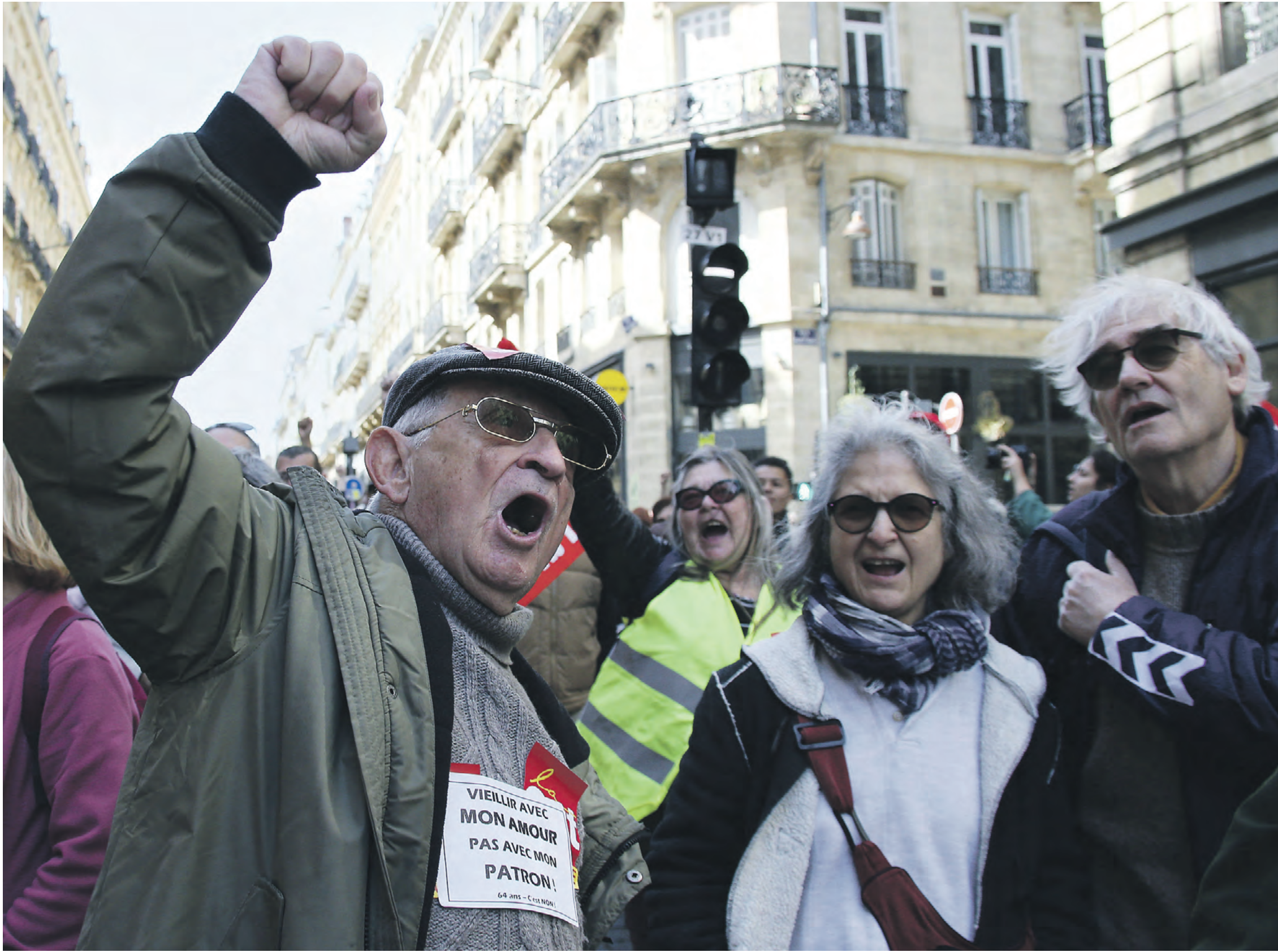
28 марта 2023 года. Бордо, юго-западная Франция. Протестующие демонстранты активно возмущаются решением президента Эмманюэля Макрона увеличить возраст выхода на пенсию до 64 лет

Улицы французских городов захлестнула волна протестов