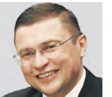
РАФИК ЗАГРУТДИНОВ РУКОВОДИТЕЛЬ ДЕПАРТАМЕНТА СТРОИТЕЛЬСТВА ГОРОДА МОСКВЫ

Сегодня наш департамент курирует огромное количество строек — в работе от 600 до 800 объектов ежегодно. В этом году их финансирование приближается к триллиону рублей. Так, вместе с вводом жилых домов сдаются школы, детсады, поликлиники, больницы, культурные центры. Только за прошлый год сдали 102 соцобъекта. Сейчас в работе — еще 89 зданий.