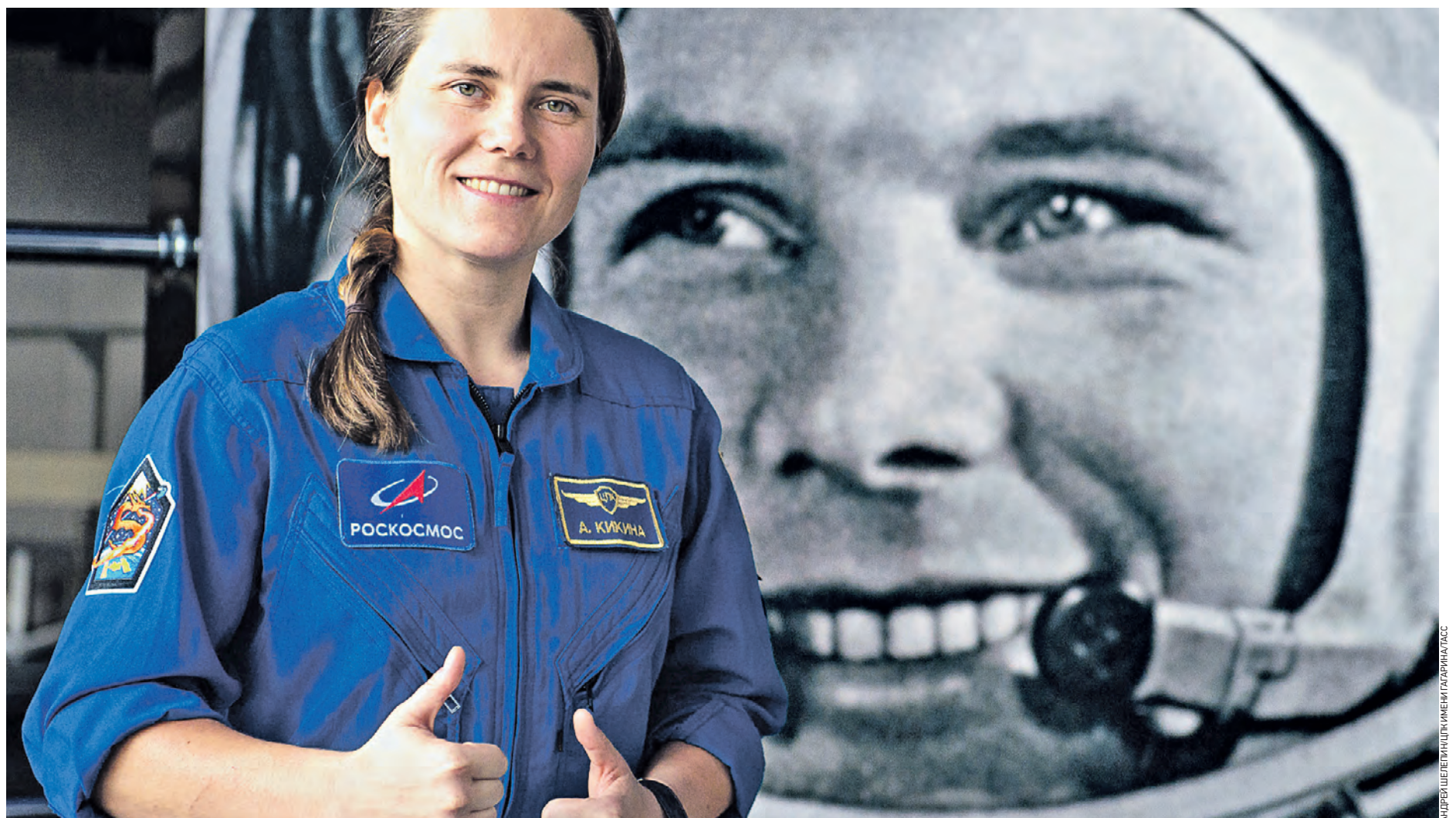
26 августа 2022 года. Московская область. Звездный городок. Космонавт Анна Кикина во время пресс-конференции, посвященной подписанию соглашения между Госкорпорацией «Роскосмос» и НАСА о перекрестных полетах. Сотрудничество стран в космической сфере, несмотря на все санкции, продолжается