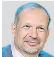
АНАТОЛИЙ ПЕТРУКОВИЧ ДИРЕКТОР ИНСТИТУТА КОСМИЧЕСКИХ ИССЛЕДОВАНИЙ РАН

Согласно результатам миссий, особый интерес для ученых представляют определенные места на спутнике — лунные полюсы. Это уникальные территории. Ведь они всегда находятся под лучами Солнца, а значит, там можно установить лунную базу, которая все время будет «подпитываться» энергией. Помимо этого, на этих полюсах существуют признаки наличия воды, льда и возможные останки местной органики. Проект «Луна-2023» планируется к старту в июле этого года. В его задачи входит посадка недалеко от южного полюса Луны. Данная миссия позволит лучше подготовиться к экспедиции «Луна-2027» и произвести тестирование систем безопасной посадки и технологий выживания космического аппарата на поверхности спутника. А вот в свою очередь «Луна-27» уже позволит глубже исследовать поверхность единственного спутника Земли.