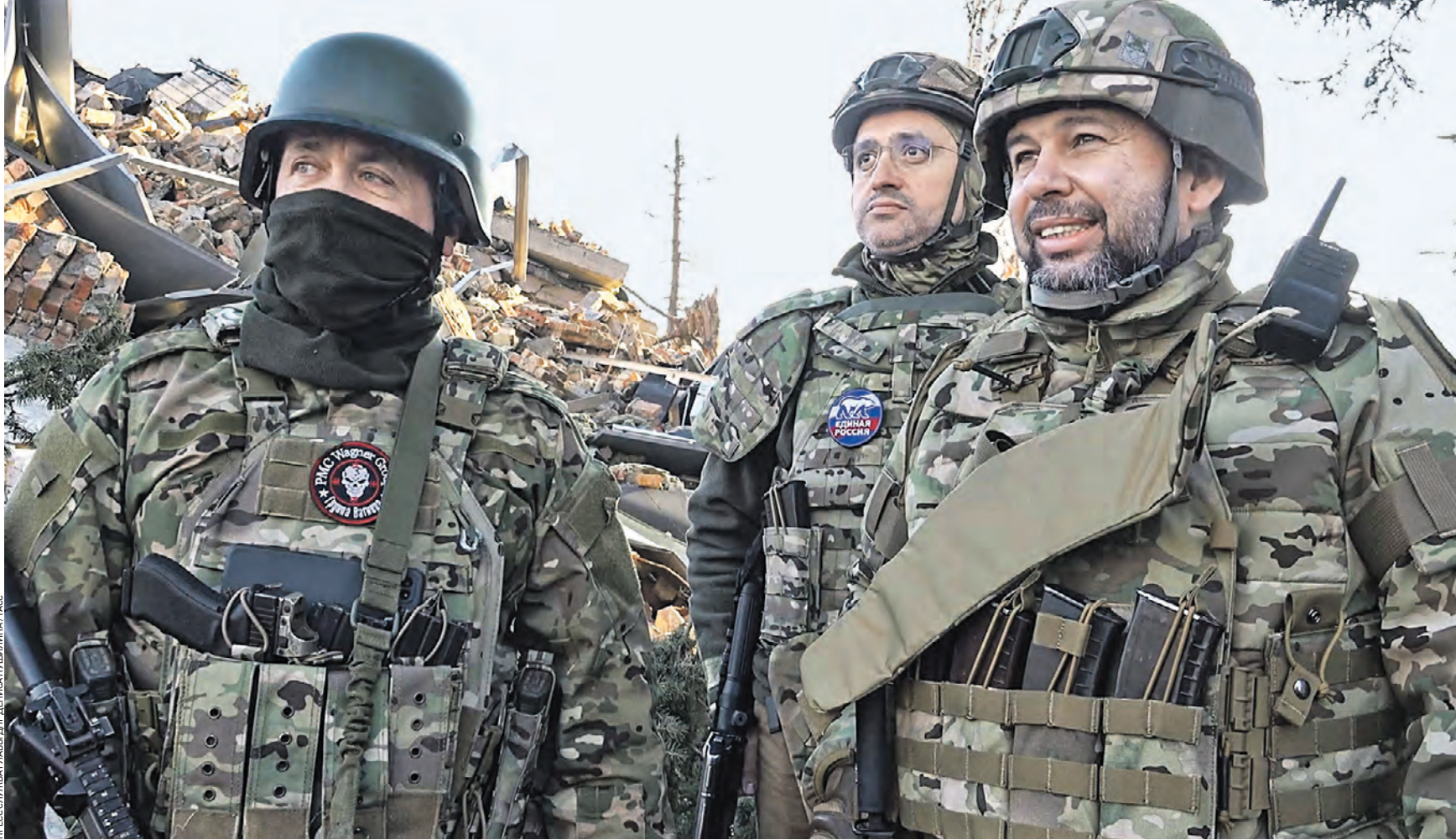
Вчера 15:45 Временно исполняющий обязанности главы Донецкой Народной Республики Денис Пушилин (справа) во время осмотра зданий в Артемовске, которые пострадали из-за обстрелов ВСУ. Отступая из города, боевики киевского режима подорвали несколько построек. Все они обязательно будут полностью восстановлены