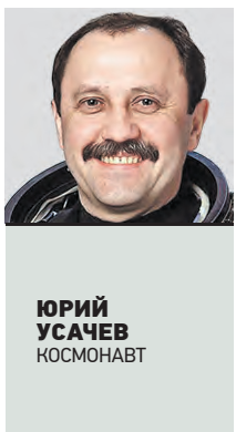
ЮРИЙ УСАЧЕВ КОСМОНАВТ

Профессия космонавта по-прежнему очень популярна. Да, полвека назад полететь в космос было мечтой миллионов советских детей. Но и сейчас к нам в РКК «Энергия» приходят люди и просят отправить их в отряд подготовки космонавтов. Кстати, попасть в этот отряд, который тренируется в Звездном городке, не так сложно, как кажется. Главные требования — это высшее образование, три года работы в космической отрасли и хорошее здоровье. Быть пилотом совсем не обязательно. Лично я, например, по образованию инженер, выпускник МАИ. А сейчас к нам активно идут и после Бауманки, и из Физтеха, и даже после медицинских вузов, потому что медики в космосе тоже необходимы. Работа космонавта престижна не только из-за своей романтики, но и по вполне материальным соображениям. «Роскосмос» не так давно озвучил данные по зарплате космонавтов. Так, только у кандидатов в космонавты она в среднем составляет около 300 тысяч рублей в месяц, а у опытных космонавтов, которые уже в космосе побывали, — более 500 тысяч рублей. Это вполне серьезные суммы, и люди идут за высокой зарплатой в том числе. При