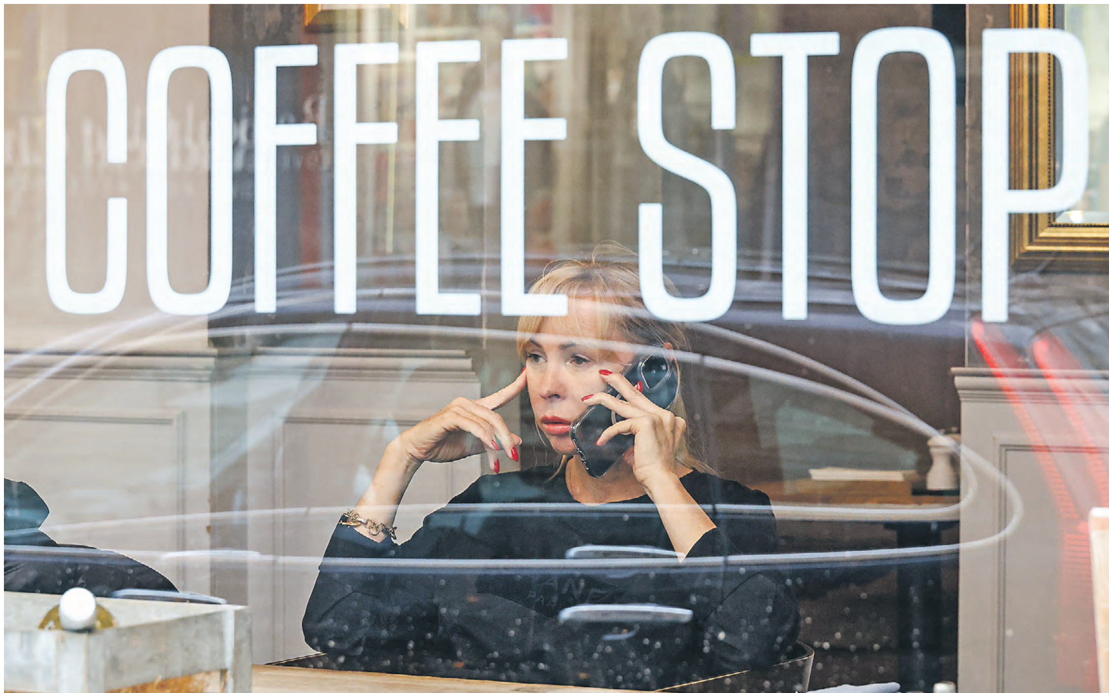
31 октября 2023 года. Женщина в кафе с нерусским названием в Большом Козинском переулке. Подобные англицизмы на вывесках были очень популярны еще недавно, когда мы стремились встроиться в западную цивилизацию

Писатель Юрий Поляков предлагает создать Опорный пункт охраны русского языка