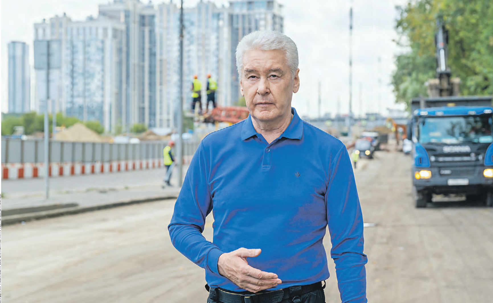
5 августа. Мэр Москвы Сергей Собянин проконтролировал, как продвигается реконструкция участка Сельскохозяйственной улицы от Московского скоростного диаметра до Юрловского проезда. Это первый из трех этапов проекта по созданию новой хордовой магистрали на северо-востоке города

Подем быстрее Проект будет реализован в три этапа. Первый уже стартовал. Он включает в себя реконструкцию участка Сельскохозяйственной улицы от МСД до Юрловского проезда. В результате проезжую часть расширят с двух до шести полос. Кроме того, построят 900-метровую дорогу-связку с Юрловским проездом. На первом этапе также частично реконструируют улицы Олонечкая и Декабристов.