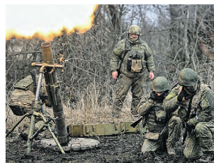
2023 год. Морские пехотинцы Черноморского флота РФ ведут огонь по позициям ВСУ из 120-мм миномета 2С11 «Сани»