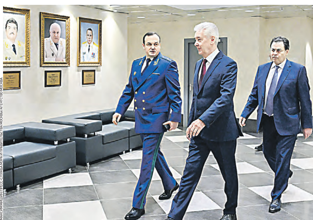
4 февраля. Прокурор Москвы Максим Жук, мэр Москвы Сергей Собянин и заммэра Москвы по вопросам региональной безопасности и информационной политики Александр Горбенко (слева направо) перед началом заседания коллегии