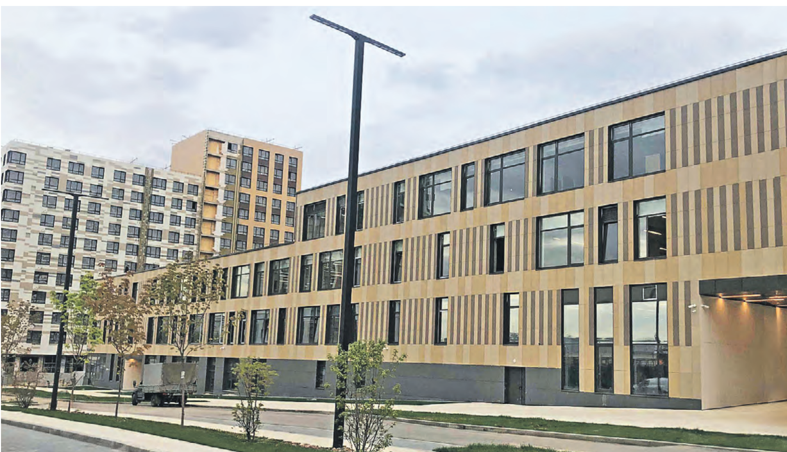
Здание школы на 900 мест построили в Южном административном округе столицы по адресу: 1-й Котляковский переулок, 4Б

В инфраструктурных договорах пропишут и определенные бонусы для инвесторов. Так, застройщики при подписании инфраструктурного договора могут рассчитывать на льготы по плате за изменение вида разрешенного использования земельного участка под строительство жилья. Инфраструктурный договор становится единым комплексным документом, где четко прописаны как обязательства застройщика, так и предоставленные ему льготы и преферен-