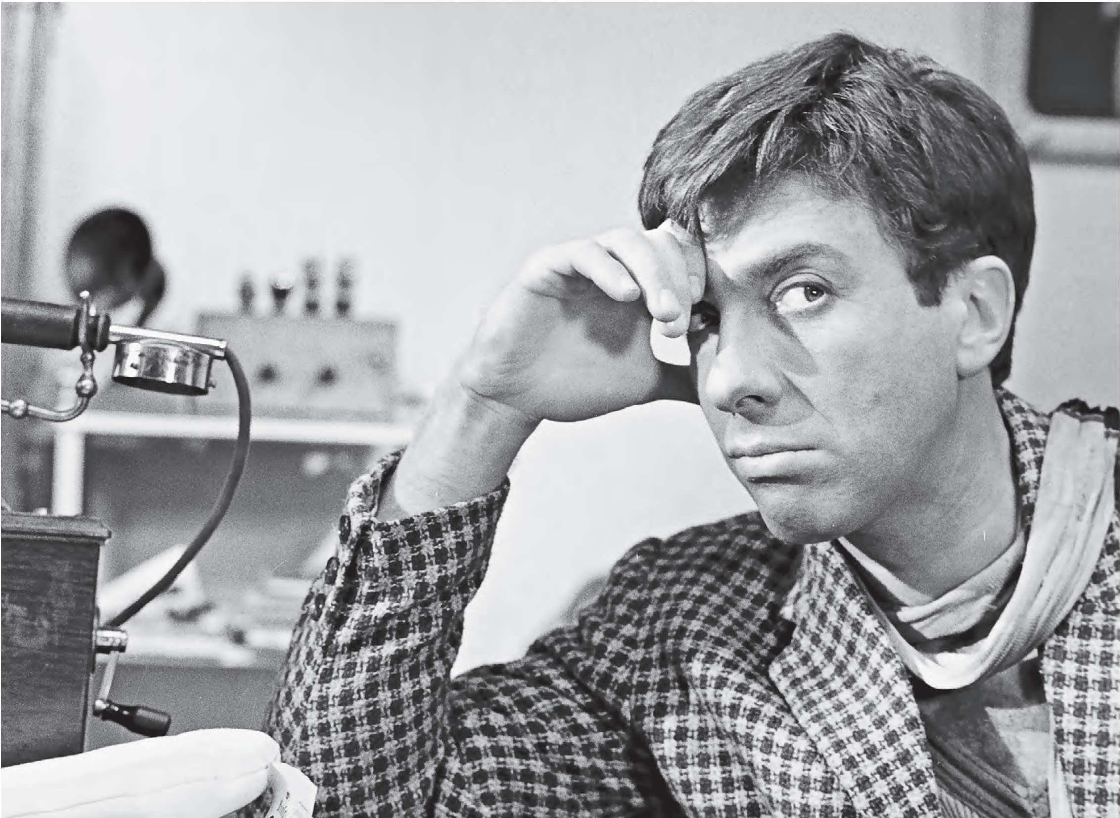
Актер Сергей Юрский в роли Остапа Бендера в сцене из фильма «Золотой теленок» режиссера Михаила Швейцера (1968). Как известно, Бендер был большим мастером пустых обещаний и нереализуемых планов, но ему верили!

Почему необязательность стала нормой и как понять, что вас точно обманут