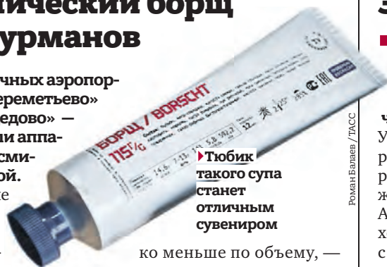
Тубик такого супа станет отличным сувениром