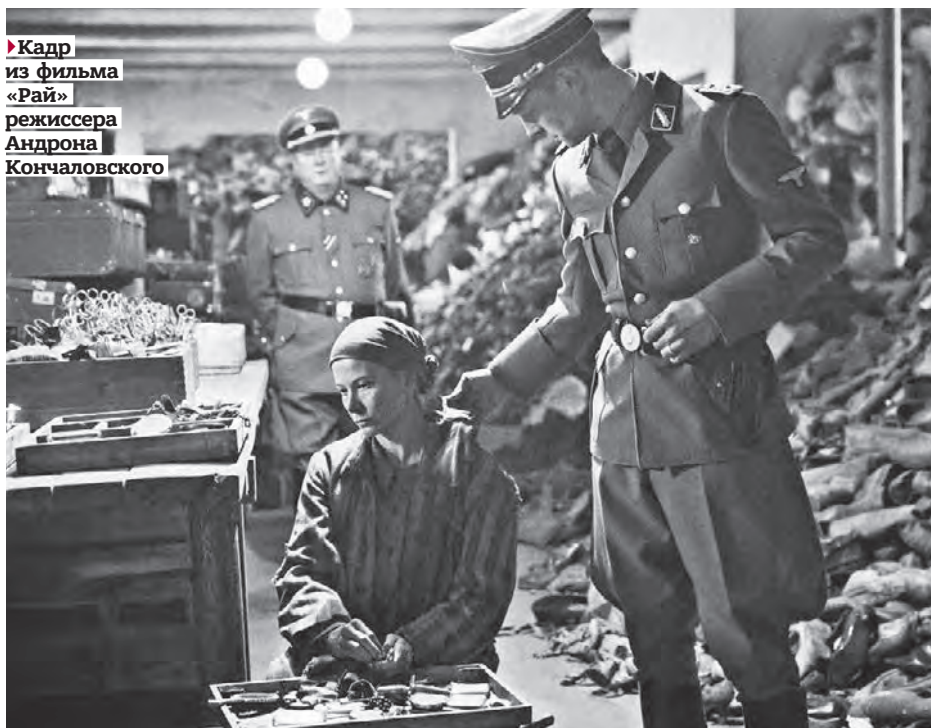
Кадр из фильма «Рай» режиссера Андрына Кончаловского

Вчерашняя аристократка Ольга арестована нацистами за укрывательство еврейских детей. Обаяние и привлекательность Ольги не меркнут и в застенке; ею увлекается француз-коллаборационист Жюль, который занимается ее делом. Его вердикт прост: он может облегчить ее участь, но в обмен на любовь. Однако этому сбыться не суждено: призрачная надежда на свободу тает — Ольга оказывается в концлагере. Высокопоставленный офицер СС Хельмут когда-то был влюблен в Ольгу и теперь, предвидя поражение Гитлера, пытается спасти любимую. Она готова бежать с ним, но только вот ее представления о рае серьезно изменились... Жесткий, полный колоссальной внутренней энергии фильм. Обязателен к просмотру как одна из лучших работ