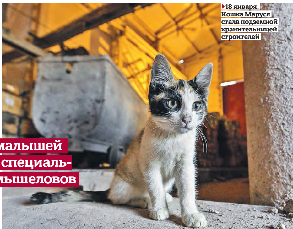
18 января. Кошка Маруся стала подземной хранительницей строителей

к хозяйке. С появлением кошки атмосфера на строительной площадке одного из сложнейших участков московского метро значительно улучшилась. — Она каждый день встречает их и провожает в шахту строителей, причем поймала уже не один десяток мышшей и крыс, — сообщили в пресс-службе Мосметростроя. За эти достижения строители подкармливают Марусю домашними обедами.