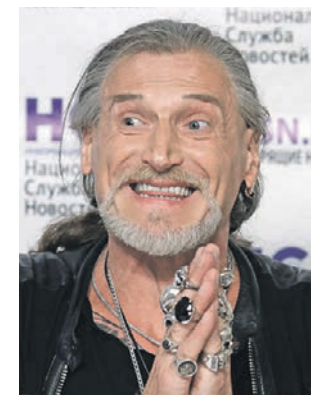
Никита Джигурда имеет все шансы получить наследство поклонницы

Ну конечно, разговор пойдет и о ситуации с Анастасией Заворотнюк: будет сделана попытка докопаться до правды, что с ней на самом деле. Другими же героями выпуска станут красавцы Кокорин и Мамаев и их родственники, Никита Джигурда, который бьется за