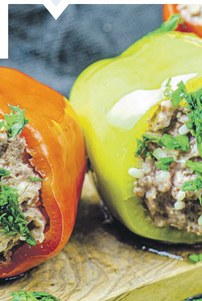
Рис залейте кипятком. Перцы очистите от перегородок и семян. Обжарьте лук и морковь. Теперь смешайте все ингредиенты и начините смесью перцы. Уложите их вертикально в кастрюлю, добавьте ложку сметаны и томатной пасты, залейте водой и тушите 45 минут.