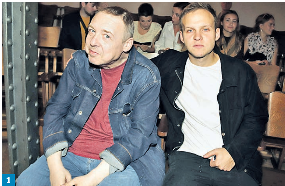
2 сентября 2019 года. Похудевший Александр Семчев (слева) и актер Данил Стеклов (1) Семчев в привычном для зрителя образе (2)

■ В этом году условную премию «Сбрось лишнее» уверенно можно присудить заслуженному артисту России Александру Семчеву. Еще весной к своему 50-летию актер предстал в новом для себя имидже — он похудел на 100 килограммов. Александр Семчев, сколько его помнит зритель, всегда был добродушным толстячком. Но когда весы стали показывать угрожающие 200 килограммов и у артиста развился сахарный диабет, он испугался за свою жизнь, взял себя в руки и твердо решил избавляться от лишнего. Сначала он похудел на 40 килограммов, чем вызвал беспокойство поклонников — они решили, что Александр Семчев серьезно болен. Но он успокоил публику.