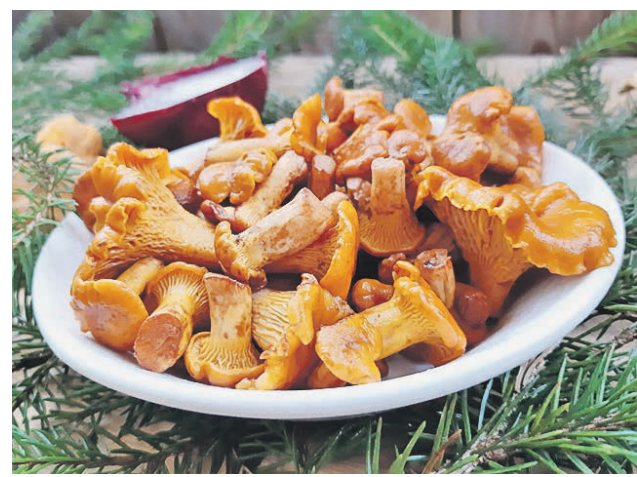
Соленые открытым способом грибы вкусны и безопасны: в них не развивается ботулизм

сколько литровых банок мы намерили? Вот столько столовых ложек соли (крупной, не йодированной) и надо взять. Если вы любитель зеленого — прибавьте еще одну. Теперь накрываем грибы марлей, сверху ставим груз и держим так 30 дней минимум. Грибы по краям могут покрыться налетом, но это нестрашно, просто уберите его. Подают грибы с луком, маслом, некоторые добавляю