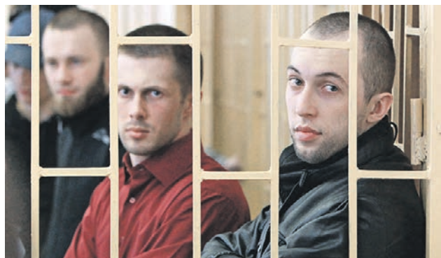
Участники группы «приморских партизан» за решеткой

Уже сегодня вечером, 19 сентября, в 23:00, на канале ТВ-3 покажут новую серию из документального цикла «Это реальная история», речь в которой пойдет о знаменитом деле «приморских партизан».