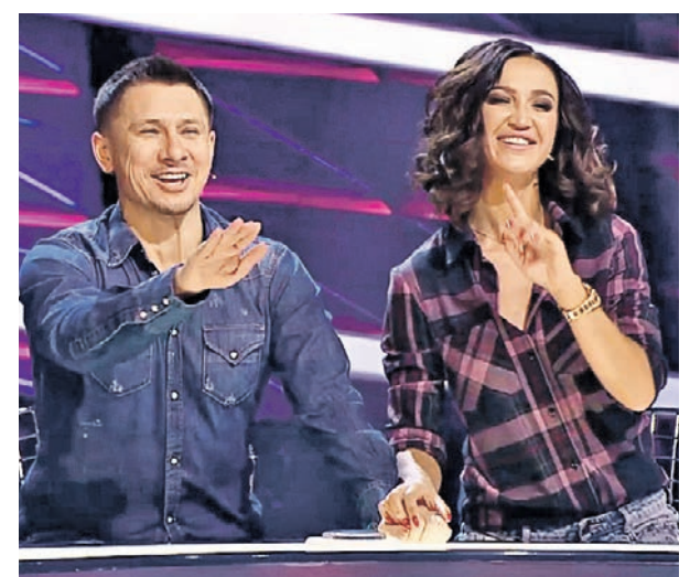
Тимур Батрутдинову и Ольге Бузовой не привыкать к совместным выступлениям в шоу