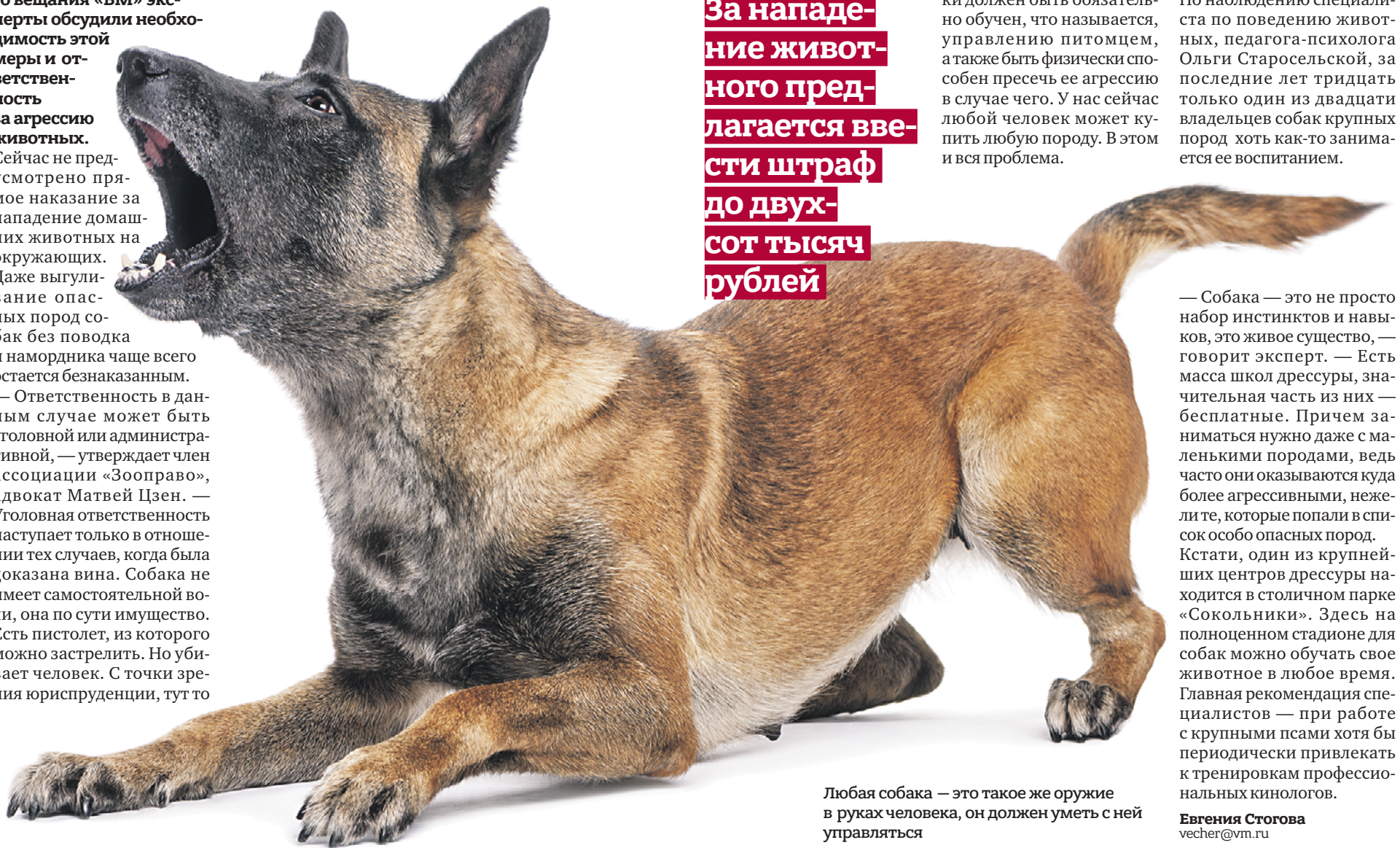
Любая собака — это такое же оружие в руках человека, он должен уметь с ней управляться

За нападение животного предлагается ввести штраф до двухсот тысяч рублей