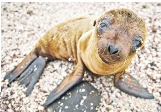
Из-за экспериментов над природой морские котики выбрасываются на берег и погибают

— Помните, каким было прошедшее лето в России и в Европе, — рассказала ясновидящая «Вечерке». — Мы же прекрасно понимаем, как должно выглядеть каждое время года: в природе все развивается логично, постепенно набирает силу. Даже если грянул гром — перед этим создаются определенные атмосферные условия. А у нас же сегодня 20 градусов, завтра — 10 градусов, послезавтра заморозки. То, что мы сейчас наблюдаем, в том числе