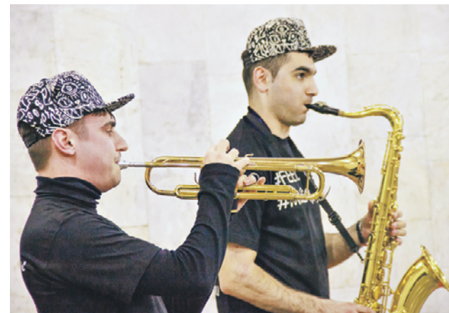
Коллектив Show-Band Feel Style исполняет музыку, под которую трудно устоять на месте