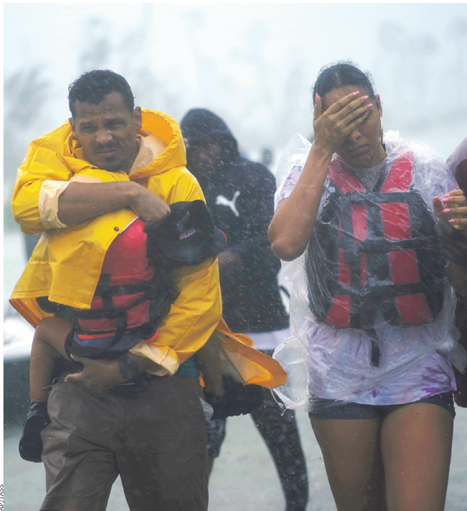
3 сентября 2019 года. Эвакуация жителей Багамских островов, над которыми завис ураган «Дориан»

низкого и высокого давления, которые формируют ураганы, тайфуны, засухи. Существует и форма геотектонического воздействия: последствиями таких экспериментов становятся землетрясения. С точки зрения геополитики климатическое оружие — эффективный способ анонимного контроля и подавления территории условного противника.