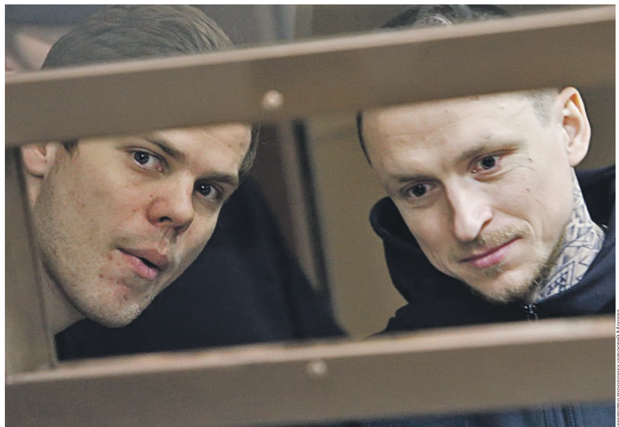
Агентство городских новостей Москва

• 100% уничтожение клопов, тараканов. Гарантия. Т. 8 (965) 386-47-09