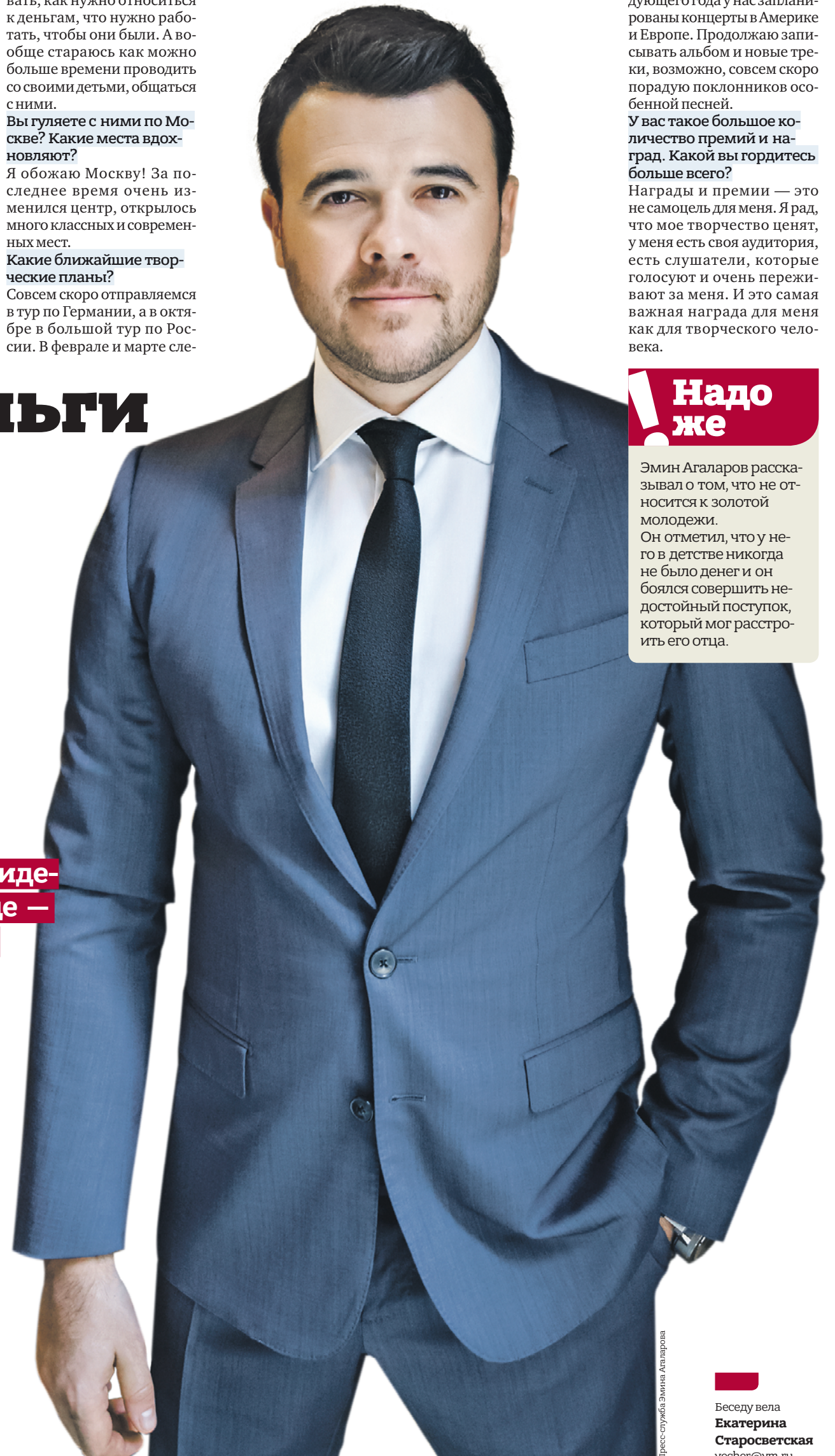
Пресс-служба Эмина Агаларова

В 1983 году с родителями переехал в Москву. С 1994 по 2001 год жил в США. Был женат на Лейле Алиевой.