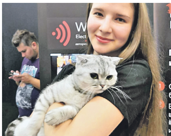
8 сентября 2019 года. Кошка Луша председателя ЦИК Эллы Памфиловой помогает снимать стресс