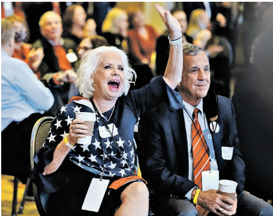
4 ноября 2020 года. Странники Республиканской партии в штате Джорджия наблюдают за ходом голосования на всеобщих выборах

Американские президентские выборы состоялись