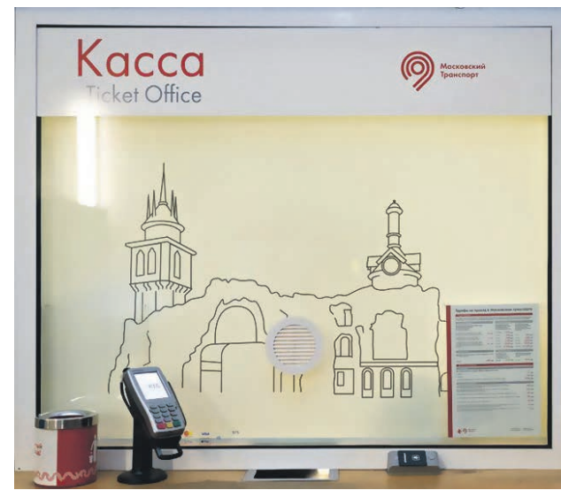
Касса на станции «Краснопресненская» Московского метрополитена