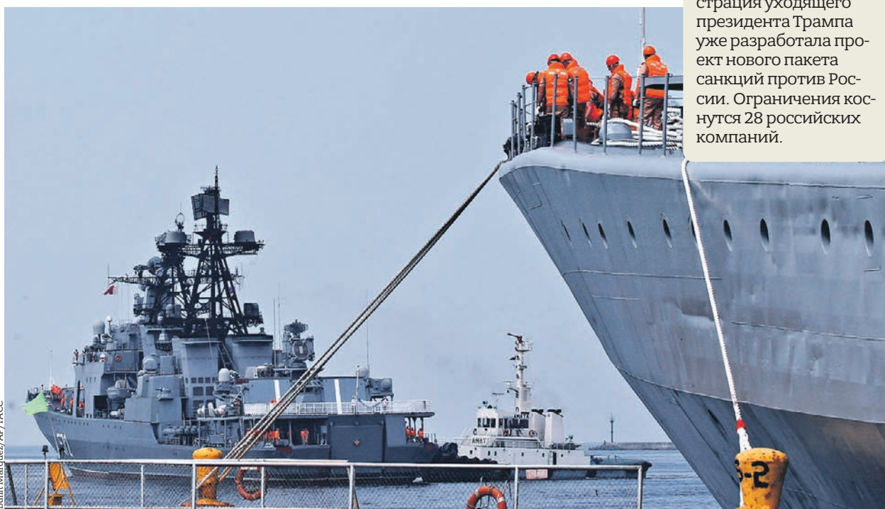
8 апреля 2019 года. Большие противолодочные корабли «Адмирал Виноградов» и «Адмирал Трибуц» (слева направо) в порту города Манилы

«Адмирал Виноградов» готов использовать таран против «Маккейна»