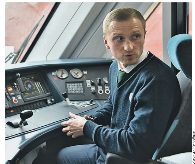
8 ноября 2019 года. Машинист в поезде «Иволга» Московских центральных диаметров