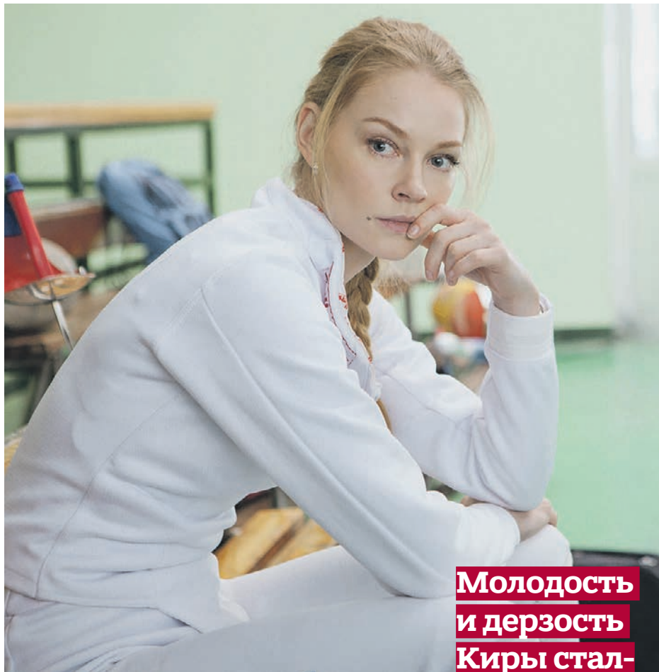
Светлана Ходченкова в роли Александры Покровской в фильме «На острие»