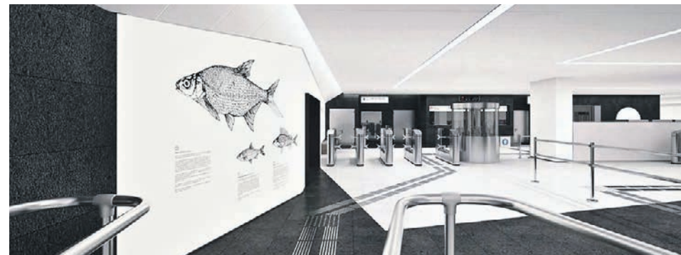
Визуализация станции «Нагатинский Затон» Большой кольцевой линии метро

Еще один отрезок подземного кольца между станциями «Текстильщики» и «Кленовый бульвар» готов практически наполовину. Как рассказал заммэра Москвы по вопросам градостроительной политики и строительства Андрей Бочкарев,