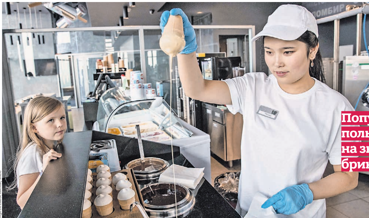
Дегустация мороженого на смотровой площадке, расположенной на 89-м этаже башни «Восток» многофункционального комплекса «Федерация» на территории делового комплекса «Москва-Сити»