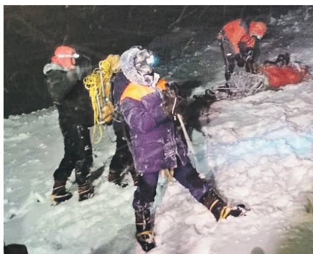
24 сентября 2021 года. Поисково-спасательные работы на горе Эльбрус в республике Кабардино-Балкария

Как рассказали в турфирме Elbrus.guide, сначала одной