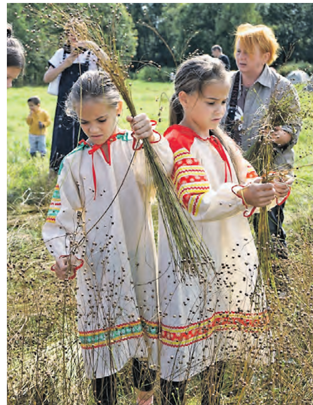
2024 год. Семейный фольклорный фестиваль «Влюблен в лен» в Ярославской области

По данным одного из крупных сервисов путешествий, в 2024 году поток путешественников по городам Золотого кольца вырос почти на 40 процентов. Заодно еще громче зазвучало слово «избинг», в котором прослеживается связь «избы» и модных