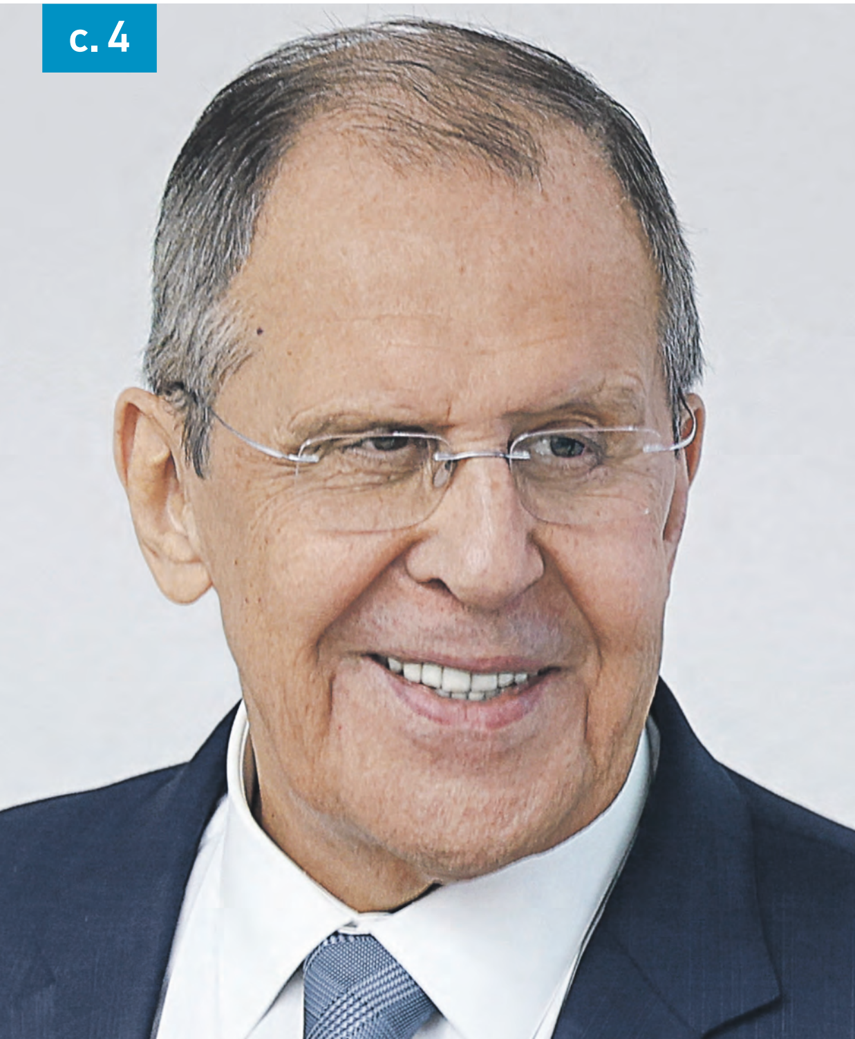
Глава МИДа Сергей Лавров находится на дипломатической службе уже 52 года