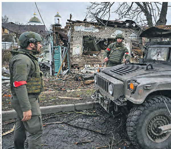
16 марта. Российские военнослужащие возле подбитого броневедомобиля Humvee в городе Суджа