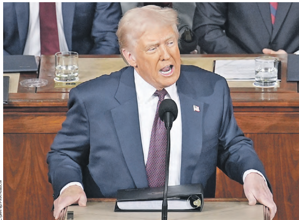
4 марта. Американский лидер Дональд Трамп во время выступления на заседании конгресса в Вашингтоне

Вчера ВСУ нанесли очередной удар по энергетической структуре России: беспилотники попали в нефтепровод.