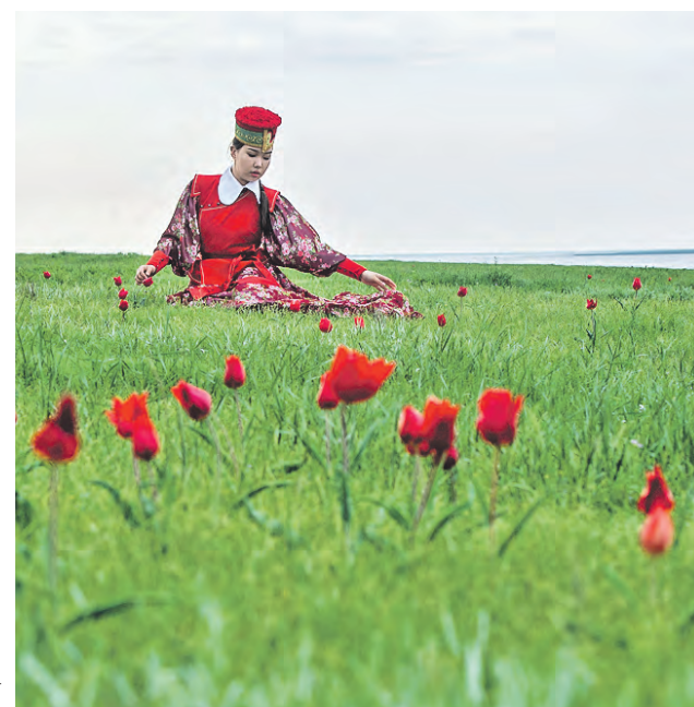
Весь апрель в Калмыкии проходит под знаком «Фестиваля тюльпанов»