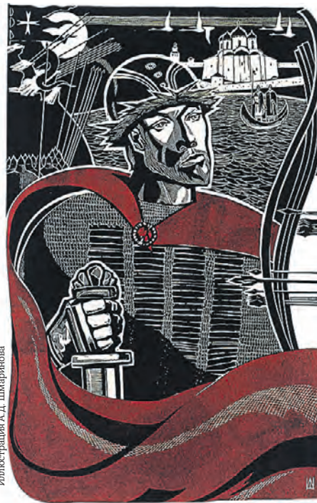
Иллюстрация А.Д. Шмаринцова

Экспозиция охватывает огромный временной отрезок — от XIII века до наших дней. В работах художников разных поколений оживают образы русских воинов — от древнерусских ратников до солдат XXI века. В сюжетах картин и сцены сражений князя Игоря с половцами, и легендарная победа Александра Невского на Чудском озере, и подвиги участников Отечественной